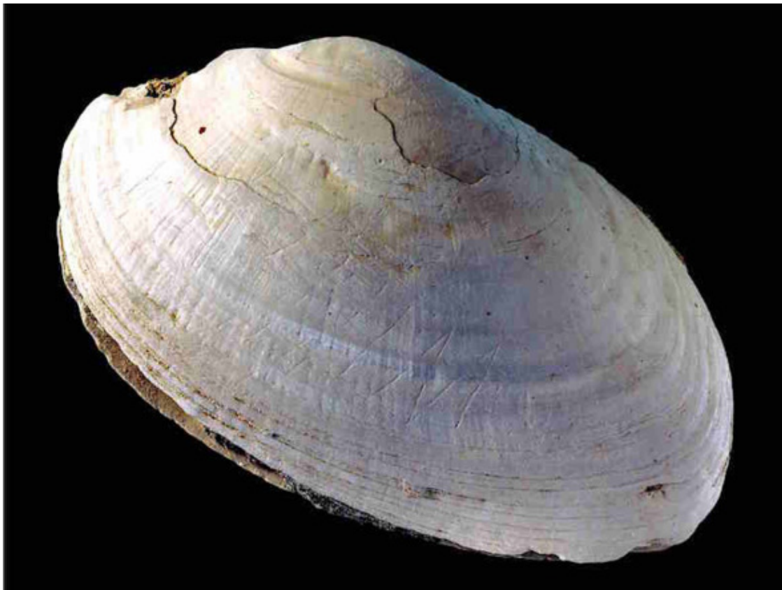
Ява. Гравировка на раковине

были изобретены сложносоставные орудия, где наконечник приклеивался к древку с помощью смол и (предположительно) закреплялся верёвкой.