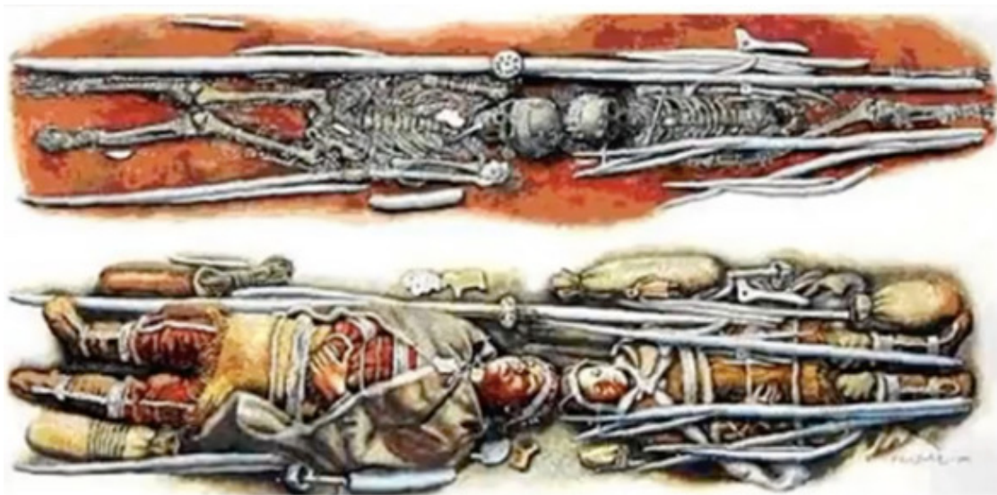
Мальчики Сунгирия. Реконструкция по захоронению

Изотопный анализ пищевых предпочтений знаменитого парного захоронения мальчиков из Сунгирия показал, что один мальчик питался, как и всё племя, очень хорошо. Диета его состояла, в основном, из мяса. Он ел, бывало, рыбу, не брезговал растительной пищей, но мясо любил очень. Второй мальчик из захоронения лишь иногда ел рыбу и растительность, но мяса не ел совсем. При этом – не голодал: его скелет не несёт признаков голодового стресса. Основу его рациона составляли беспозвоночные: жучки, паучки, червячки, гусенички. Мальчики жили в одно время, в одном племени и похоронены в одной могиле. Один ел мясо, второй – червяков. Судя по износу суставов, первый совершал движения гарпуном, а второй всегда сидел на корточках. Рядом с любителем червяков лежал футляр для охры, сделанный из кости человека, который тоже ел беспозвоночных и был... пра-пра-пра-дедушкой мальчика! Очень необычная традиция пищевой лимитации группы людей, возможно – мужчин отдельной родовой линии. (27) Предположу, что это и есть начало религий: демонстрация принадлежности к социальной группе, связанность общественным договором, «чувство локтя», если хотите.