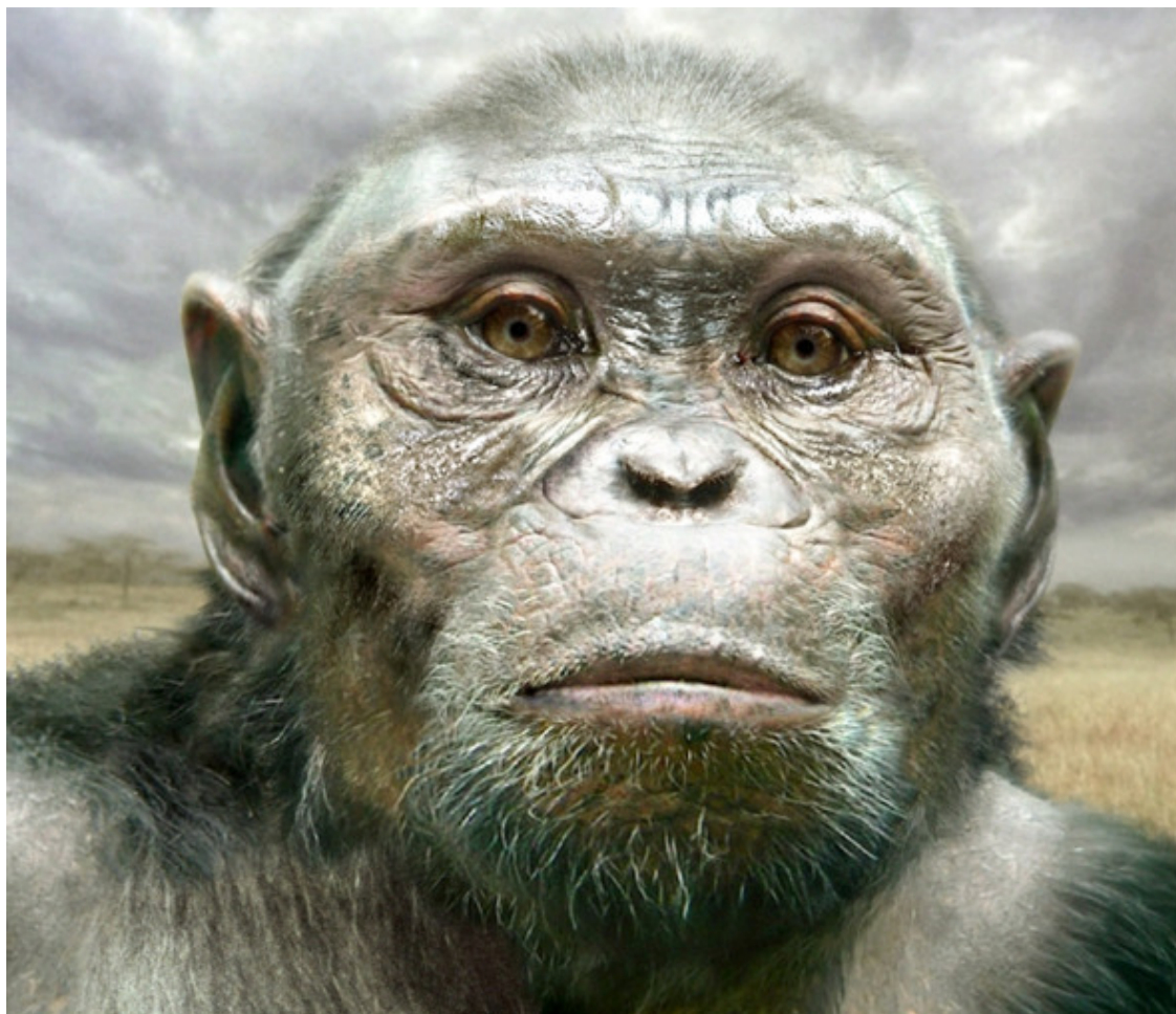
Люси. Реконструкция. В. Дик