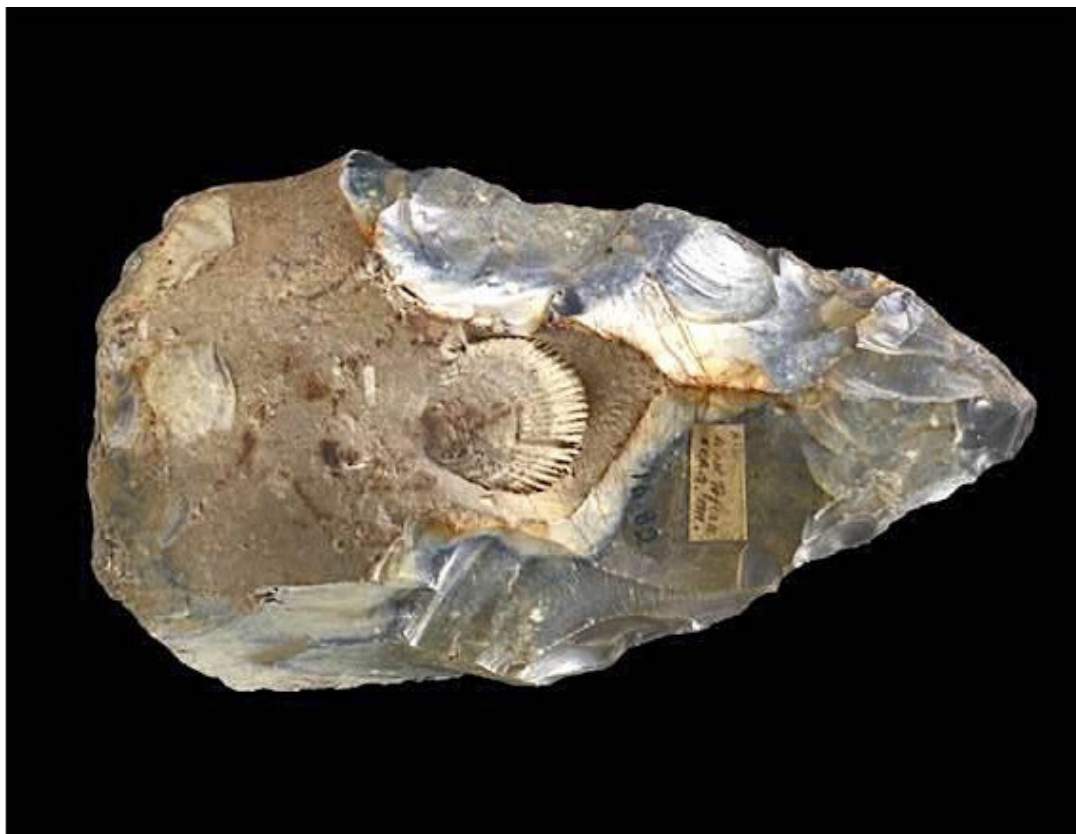
Бифас. Кембриджский музей археологии и антропологии

Мне эта идея кажется излишней, поскольку находка может быть обусловлена физическими причинами. Как показали раскопки в пещере Терра-Амата, гейдельбержцы уже умели строить стационарные «шалашы» с кострищем у входа. (9) При этом обоняние человекообразных устроено так, что не выносит запаха гниющей мертвечины. Поэтому шестнадцатиметровая яма-расщелина, которую называют «пещерой», вполне могла быть санитарной свалкой, без демонстрации уважения к туловищу, лишь бы не пахло и не оскорбляло мои гейдельбержские обонятельные ощущения. Вполне возможно, что наши традиции захоронений, постепенно обросшие ритуальными сказками, берут своё начало из простейшего стремления гейдельбержцев к улучшению санитарных условий места проживания.