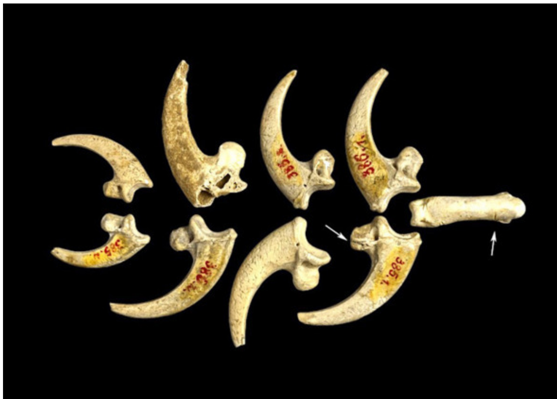
Ожерелье из Крапины

Если эстетические предпочтения гейдельбержца заканчивались на создании симметричных бифасов, то неандертальцы любили украшать себя: 130 тысяч лет назад, когда Homo sapiens в Европе ещё не наблюдалось, какой-то на редкость важный неандерталец из пещеры Крапина (Хорватия) щеголял в ожерелье из когтей орлана-белохвоста. (13)