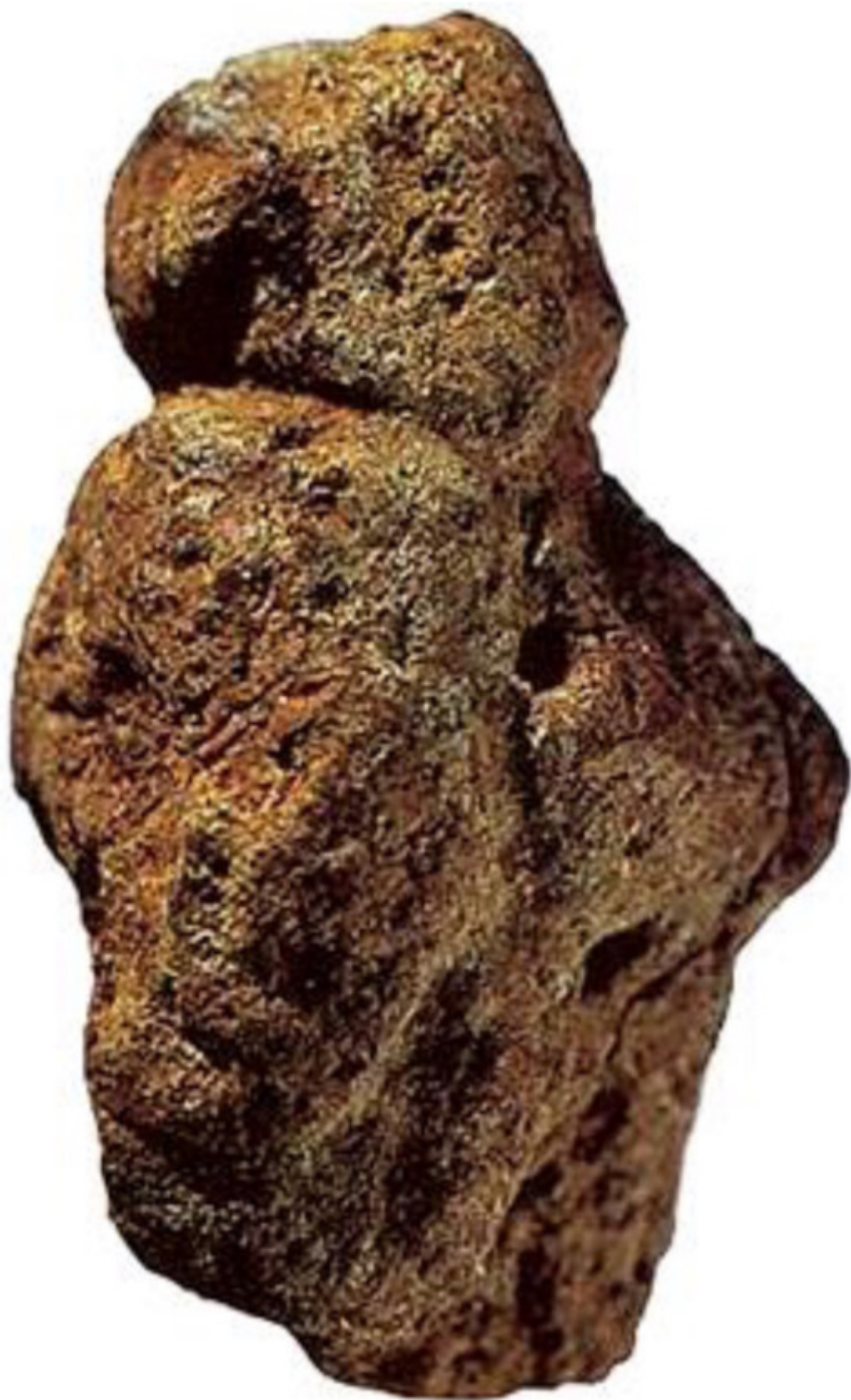
«Венера» из Берехат-Рама, Израиль