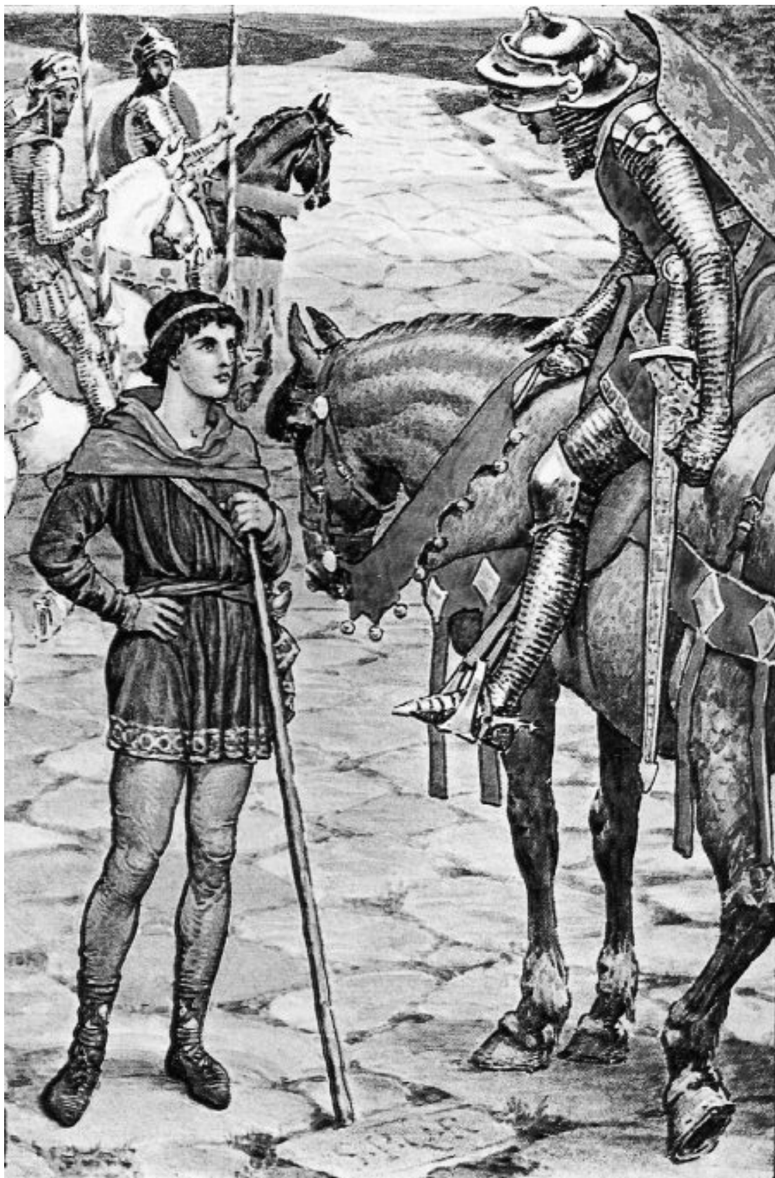
У. Крейн. Молодой Парцифаль спрашивает сэра Оуэна