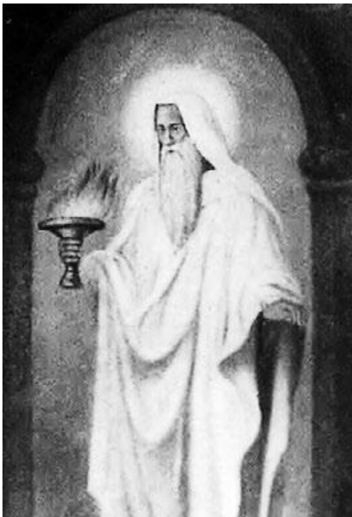
Зороастр – основатель религии древних персов – с пламенеющей чашей

В нартском эпосе упоминается легендарная чаша Амонга, предвещавшая счастливые или несчастливые события. В исламе чаша из бирюзы Джамы, в которую смотрят суфии, символизирует зеркало мира. В Индии мы находим представления о чаше с напитком бессмертия – Сомой или амритой (хаома в зороастризме, амброзия в Греции), утерянным даром богов, делающим человека сопричастным Вечности. Великой святыней считают верующие и чашу Будды, почитая ее как источник мудрости и силы, символ чистоты и возвышенных стремлений. Пламенеющая чаша отчеканена на древнееврейских серебряных шекелях времени Соломона и более древних. В тибетском буддизме Бодхисаттвы изображаются держащими чашу с языками пламени.