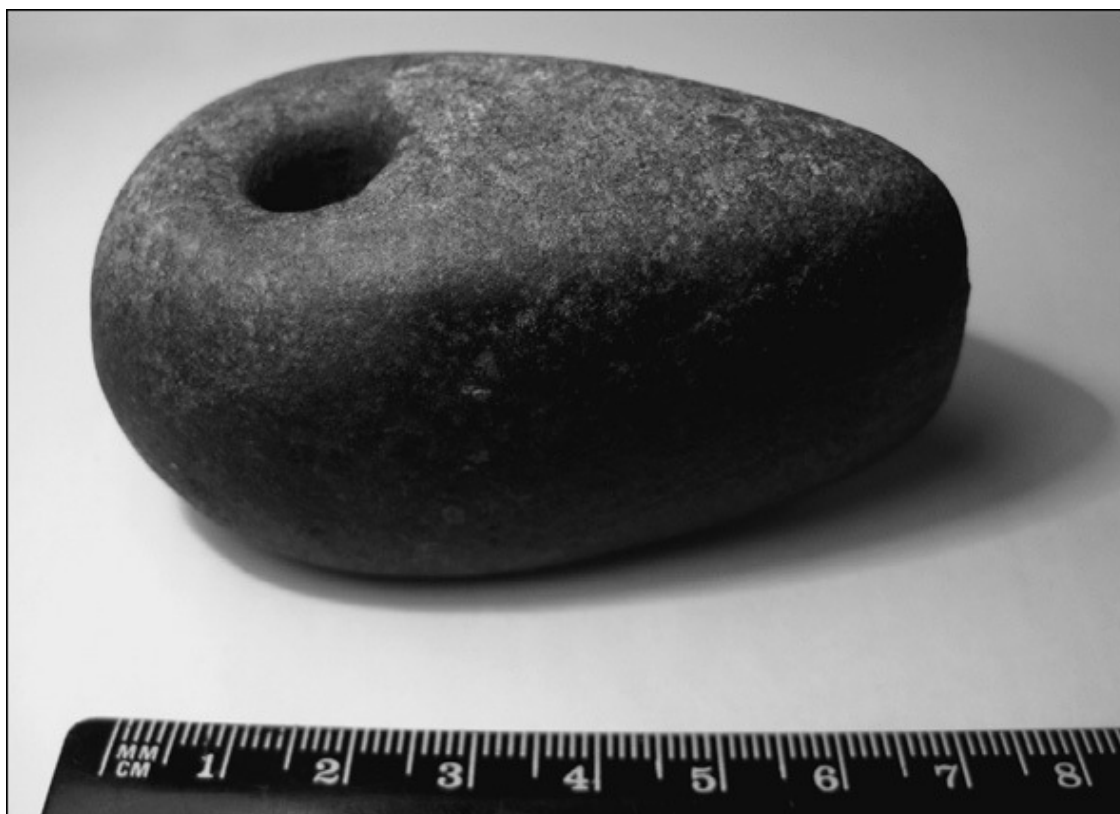
Топор. Катакомбная культура

К востоку и северо-востоку, в Среднем Поволжье, в степном Приуралье, в Центральной Азии жили племена срубной культуры. Позднее они продвигались в разных направлениях – на юг в земли современных Киргизии и Туркмении, на запад вплоть до Дуная. Название связано с местной особенностью одного из вариантов культуры, открытого первым, – устраивать умершим подкурганные срубы. «Срубные» племена были в основном скотоводами, с чрезвычайно развитым бронзолитейным ремеслом. В них видят либо древнейших иранцев, либо даже общих предков всех ариев.