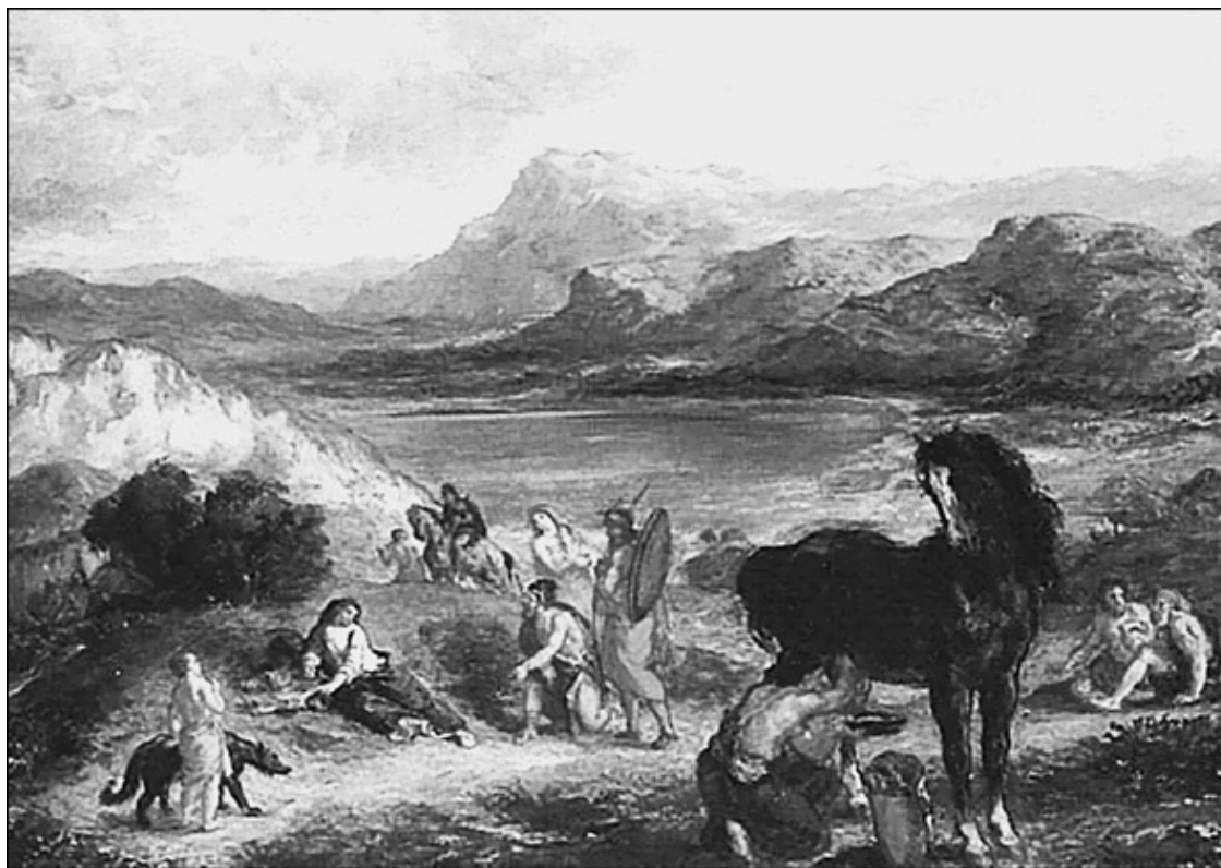
Овидий у скифов. Художник Ф.-В.-Э. Делакруа

Впрочем, будем справедливы – пафос творившего на кровавом изломе эпох Блока был отнюдь не в следовании исторической истине. Вдохновлявшая его идея, увы, знакома многим и из наших современников, в том числе, опять-таки к сожалению, намного менее одарённым. Десятки, если не сотни нынешних «мыслителей» готовы объявить свой народ хоть скифами, хоть фэнтезийными орками, да хоть кем! Лишь бы только «врагу» было «страшно». Только вот незадача – «врагу» абсолютно не страшны как фантастические, так и вполне реальные, но давно ушедшие со сцены истории народы. А вот историческое, да и нравственное сознание собственного народа такими экспериментами смутить очень даже возможно. «Скифы» Блока, «гунны» Брюсова в итоге, как известно, сокрушили вовсе не заграничную цивилизацию... Как бы то ни было, чем тешить фантазию историческими мифами, полезнее было бы заниматься устройством нынешней жизни – в реальной истории, в меняющемся мире.