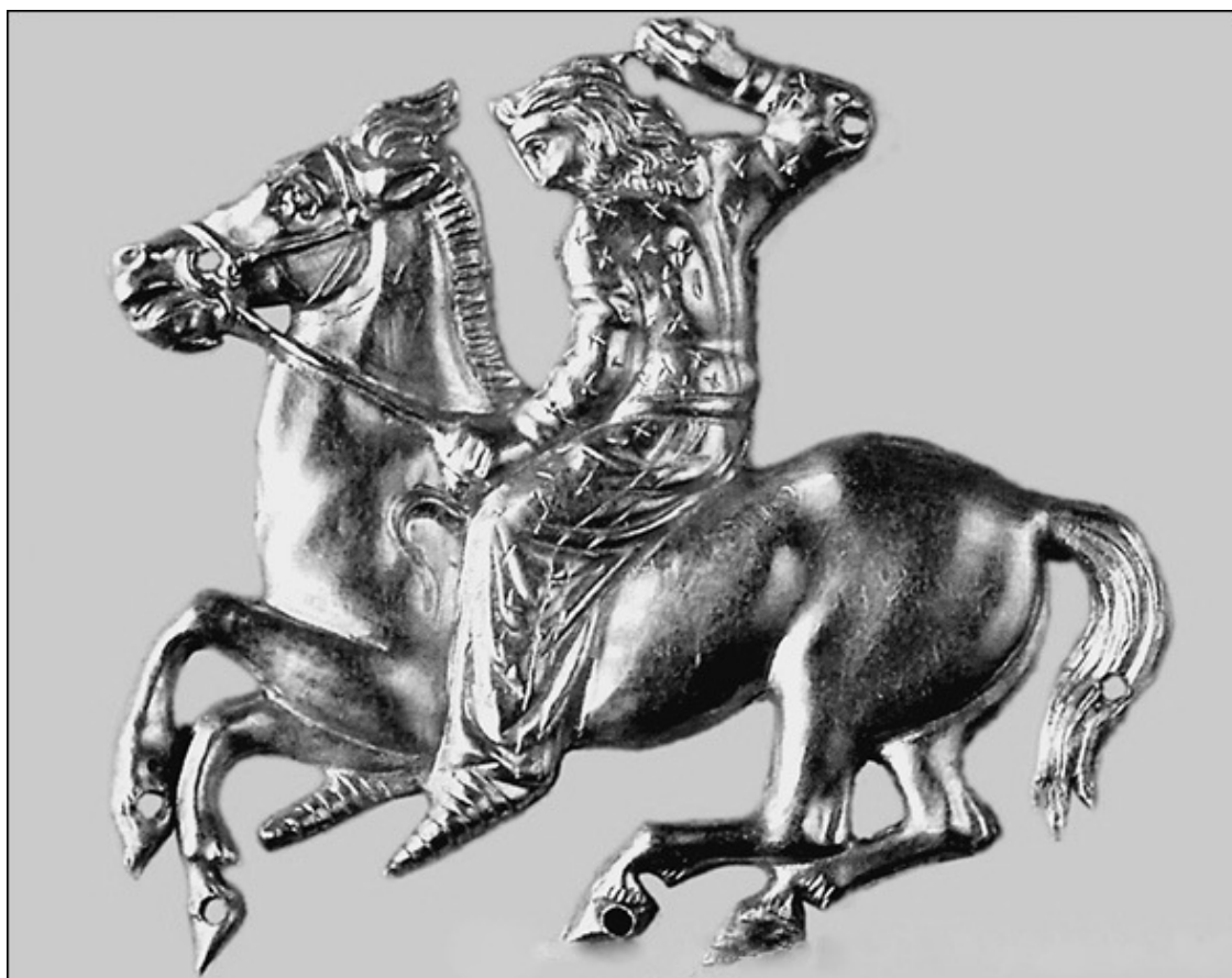
Золотая бляха с изображением конного скифа

Но включение предания о разделе народа на «палов и напов» и об их войне в основной скифский миф должно иметь какое-то объяснение. Его получают современные языковеды, истолковав названия «народов». Название «палы» означает, скорее всего, «воины, дружина», а «напы» – «простолюдины, община». Таким образом, братья «Пал» и «Нап» не более «историчны», чем Таргитай и его сыновья. Предание о них и их потомках несколько искусственно встроено в историю династии Колаксия. Повествует же оно о том же самом – о становлении иерархии в скифском обществе. Сначала рисуется идеальная картина равного участия «воинов» и «народа» в ратных подвигах и делах власти. Разделение на «народ» и «войско» отсутствует. Затем разделение появляется, а за ним приходит вражда, поскольку «народ» не желает уступать власть над собой «войску». В конечном счёте воины во главе с царским родом одерживают победу. Сокрушённый «народ» вынужден подчиниться их гегемонии. События, отражаемые этим преданием, к слову, действительно должны были произойти позднее складывания царской власти и кастового деления. Так что в последовательности событий скифское предание, известное Диодору, вполне справедливо.