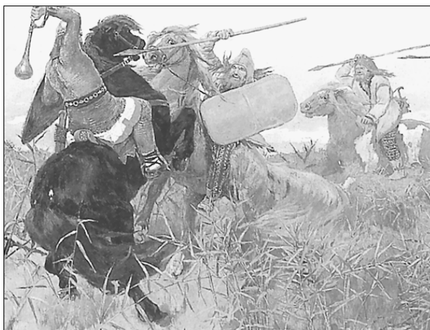
Бой скифов со славянами. Художник В.М. Васнецов

Кто же имел основания бояться скифов? Прежде всего, их соседи по Восточной Европе – фракийцы на севере Балкан, тавры в Крыму, а также многочисленные племена лесов Севера, среди которых и предки славян. Разрушительным потоком прошло некогда скифское нашествие по странам Передней Азии и Закавказья. Но при всей своей силе и «щитом» для Европы от нашествий с Востока скифы служить не могли, в отличие от позднейшей Руси. Первое же мощное вторжение – сарматское – сокрушило скифский «заслон», и оно-то как раз позднее обрушилось, пусть не всей мощью, на рубежи античной цивилизации.