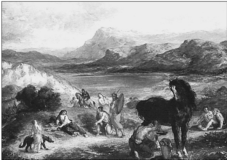
Овидий у скифов. Художник Ф.-В.-Э. Делакруа

Впрочем, будем справедливы – пафос творившего на кровавом изломе эпох Блока был отнюдь не в следовании исторической истине. Вдохновлявшая его идея, увы, знакома многим и из наших современников, в том числе, опять-таки к сожалению, намного менее одарённым. Десятки, если не сотни нынешних «мыслителей» готовы объявить свой народ хоть скифами, хоть фэнтезийными орками, да хоть кем! Лишь бы только «врагу» было «страшно». Только вот незадача – «врагу» абсолютно не страшны как фантастические, так и вполне реальные, но давно ушедшие со сцены исто-