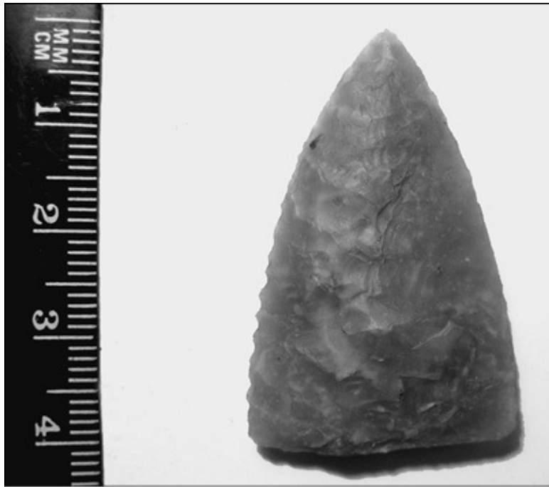
Наконечник копья. Срубная культура

В эту пору и начинается распад уже самой иранской общности. Отличия между её племенами в культуре, языке, даже в хозяйственных навыках становились всё глубже. Решающее значение для ослабления связей между разными ветвями иранцев имел переход северных степных племен к кочевому скотоводству. Осваивая непригодные для первобытного земледелия пространства, сначала как выгоны для скота,