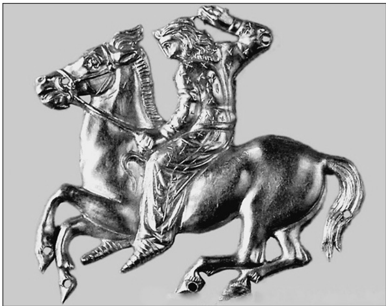
Золотая бляха с изображением конного скифа

и «войско» отсутствует. Затем разделение появляется, а за ним приходит вражда, поскольку «народ» не желает уступать власть над собой «войску». В конечном счёте воины во главе с царским родом одерживают победу. Сокрушённый «народ» вынужден подчиниться их гегемонии. События, отражаемые этим преданием, к слову, действительно должны были произойти позднее складывания царской власти и кастового деления. Так что в последовательности событий скифское предание, известное Диодору, вполне справедливо.