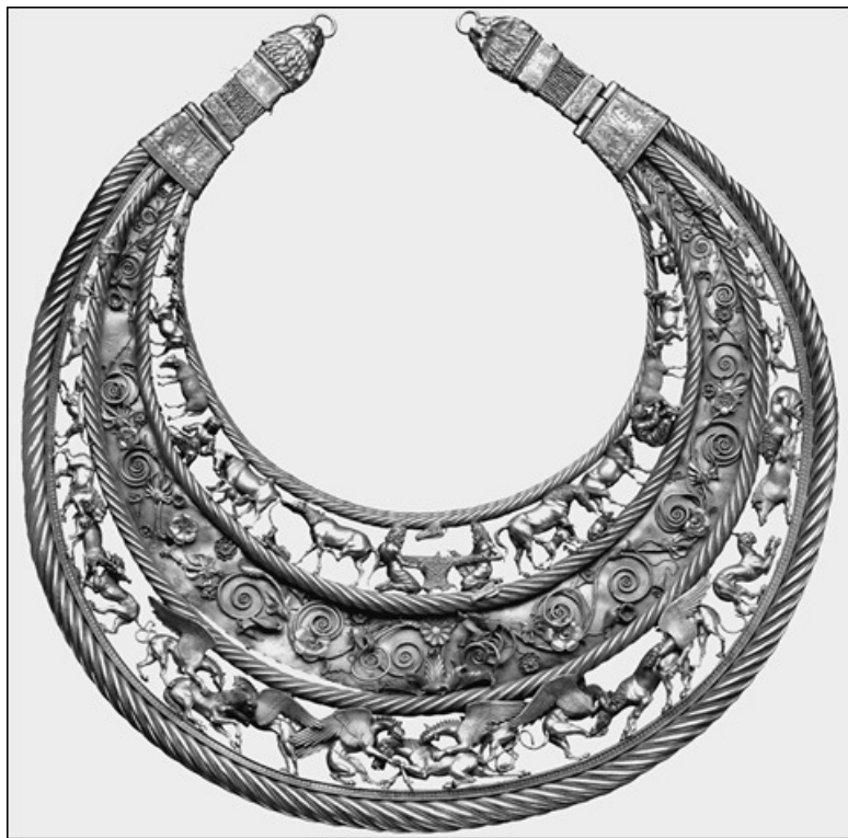
Золотая пектораль из кургана Толстая Могила

заны с историей общих предков всех или почти всех индоевропейских народов. О прародине индоевропейцев учёные спорят не один десяток лет – и новые методы науки скорее открывают в споре новые грани, чем разрешают его.