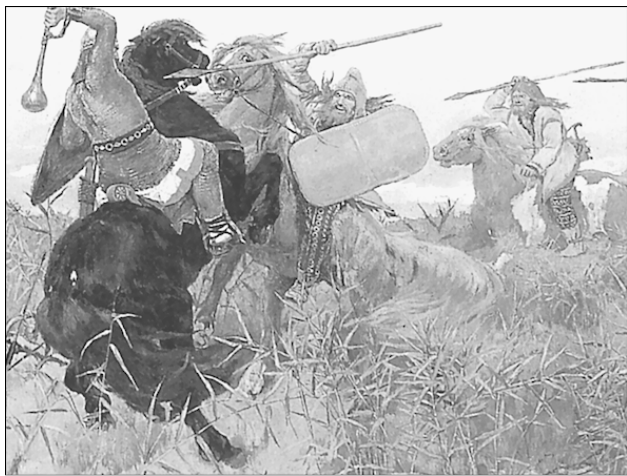
Бой скифов со славянами. Художник В.М. Васнецов

Кто же имел основания бояться скифов? Прежде всего, их соседи по Восточной Европе – фракийцы на севере Балкан, тавры в Крыму, а также многочисленные племена лесов Севера, среди которых и предки славян. Разрушительным потоком прошло некогда скифское нашествие по странам Передней Азии и Закавказья. Но при всей своей силе и «щитом» для Европы от нашествий с Востока скифы служить не могли, в отличие от позднейшей Руси. Первое же мощное вторжение – сарматское – сокрушило скифский «заслон», и оно-то как раз позднее обрушилось, пусть не всей мощью, на рубежи античной цивилизации.