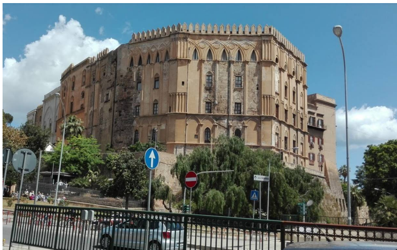
Рисунок 6 дворец Норманнов

Роберт и Роджер Отвили вписали свои имена в историю Италии, захватив Апулию, Калабрию и Сицилию.