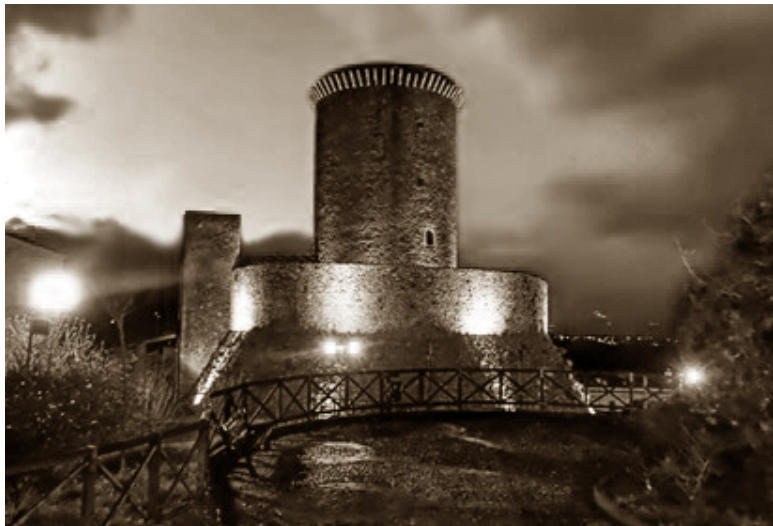
Рисунок 4 замок Монте Арджентано

Из своего замка в Сан-Марко-Арджентано он командовал бандой головорезов, терроризировал окрестности и сделался настоящим проклятием этих мест.