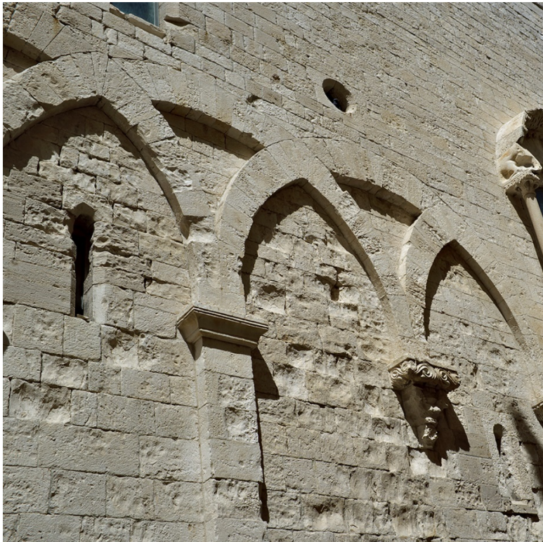
Рисунок 2 фрагмент фасада

Вот она – визитная карточка норманнских храмов