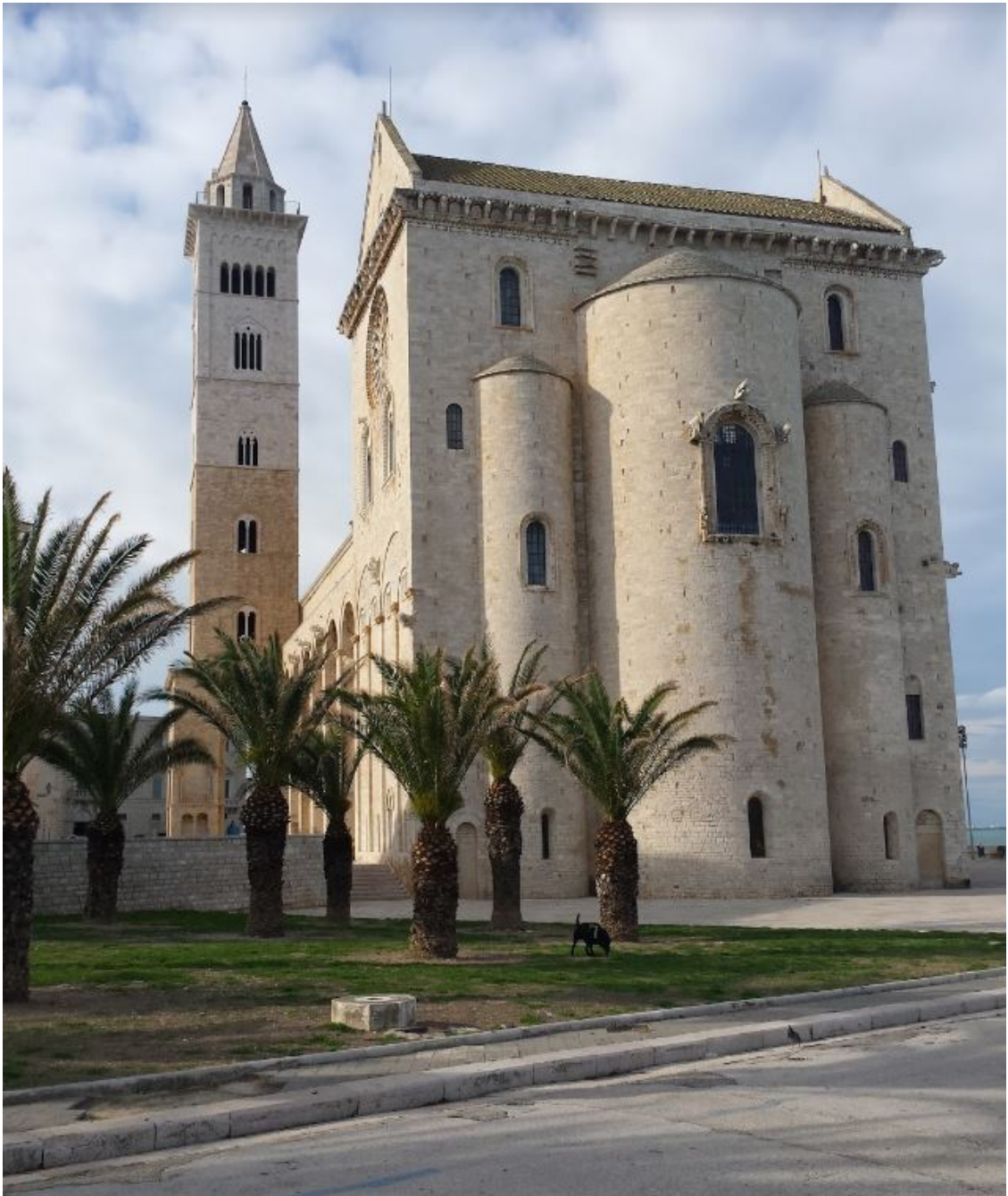
Рисунок 6 Трансепт собора

Лишь правильный круг розы, украшающей боковой фасад трансепта, убеждает в том, что никто нигде не ошибся.