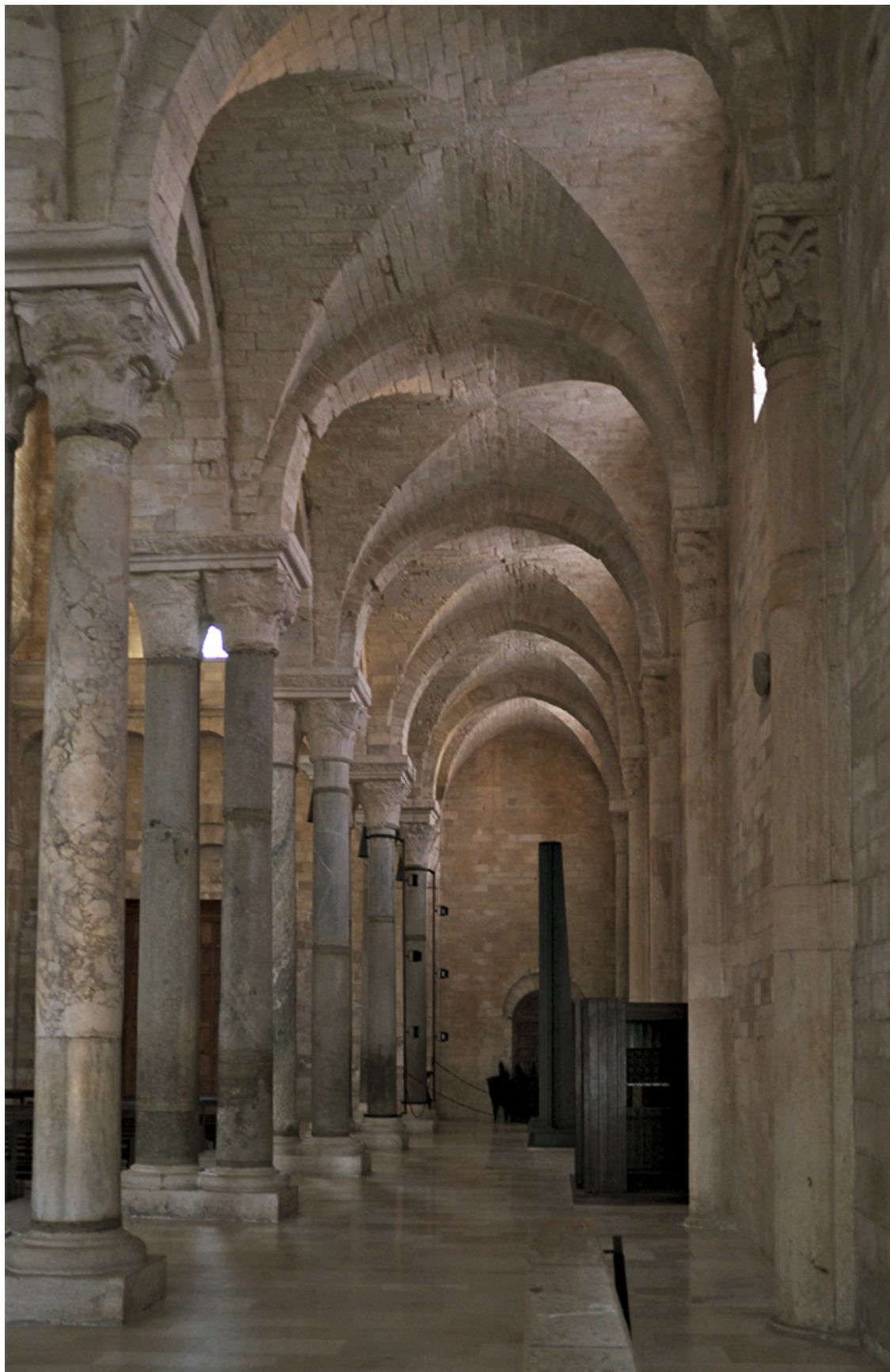
Рисунок 21 Боковой неф