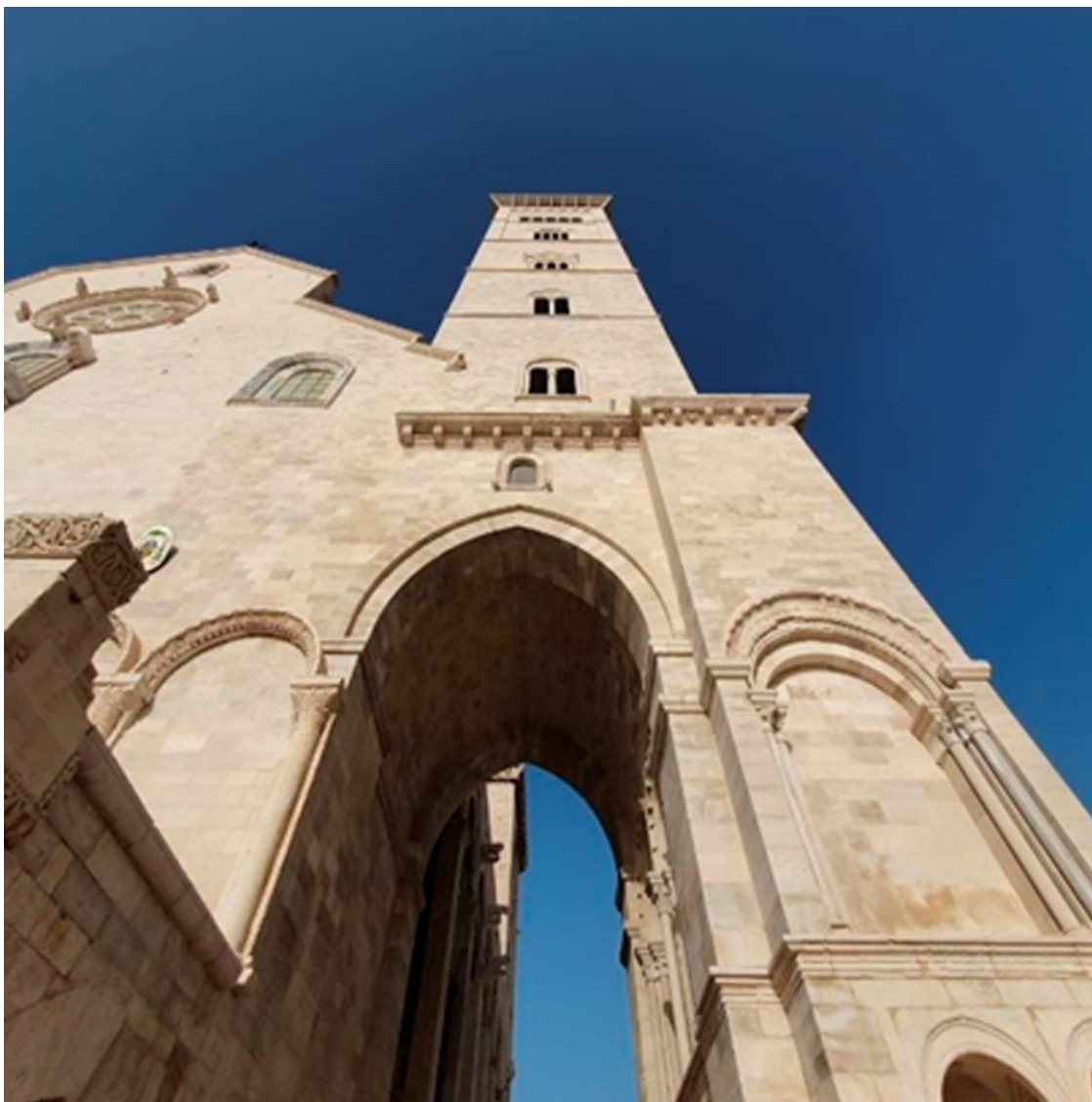
Рисунок 4 Колокольня Трани

Элемент интриги в картинку вносит высокая стрельчатая арка прохода под колокольной. Она так и манит сунуть туда любопытный нос и посмотреть, какие еще сюрпризы там спрятаны.