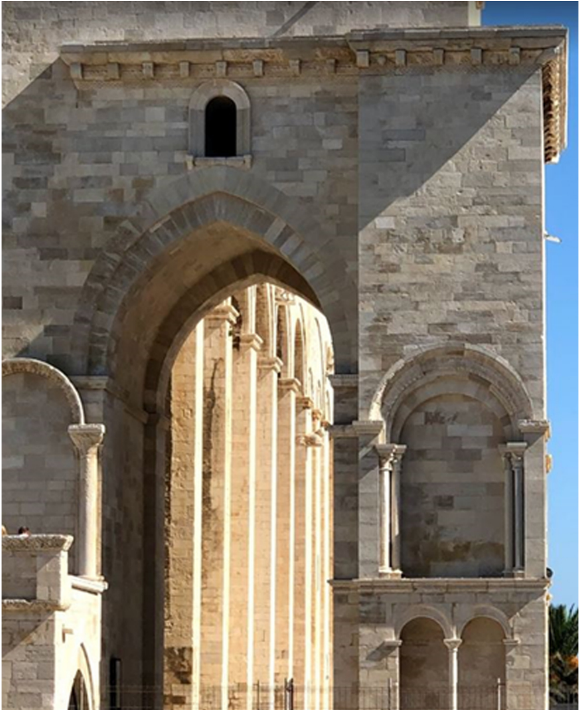
Рисунок 5 Арка нижнего яруса колокольни

Такие мощные пилоны скорее приличествуют готическому храму.