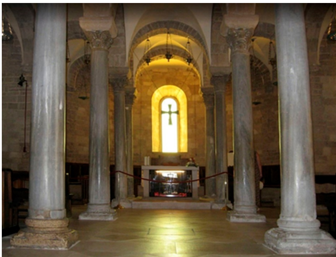
Рисунок 9 Нижний храм