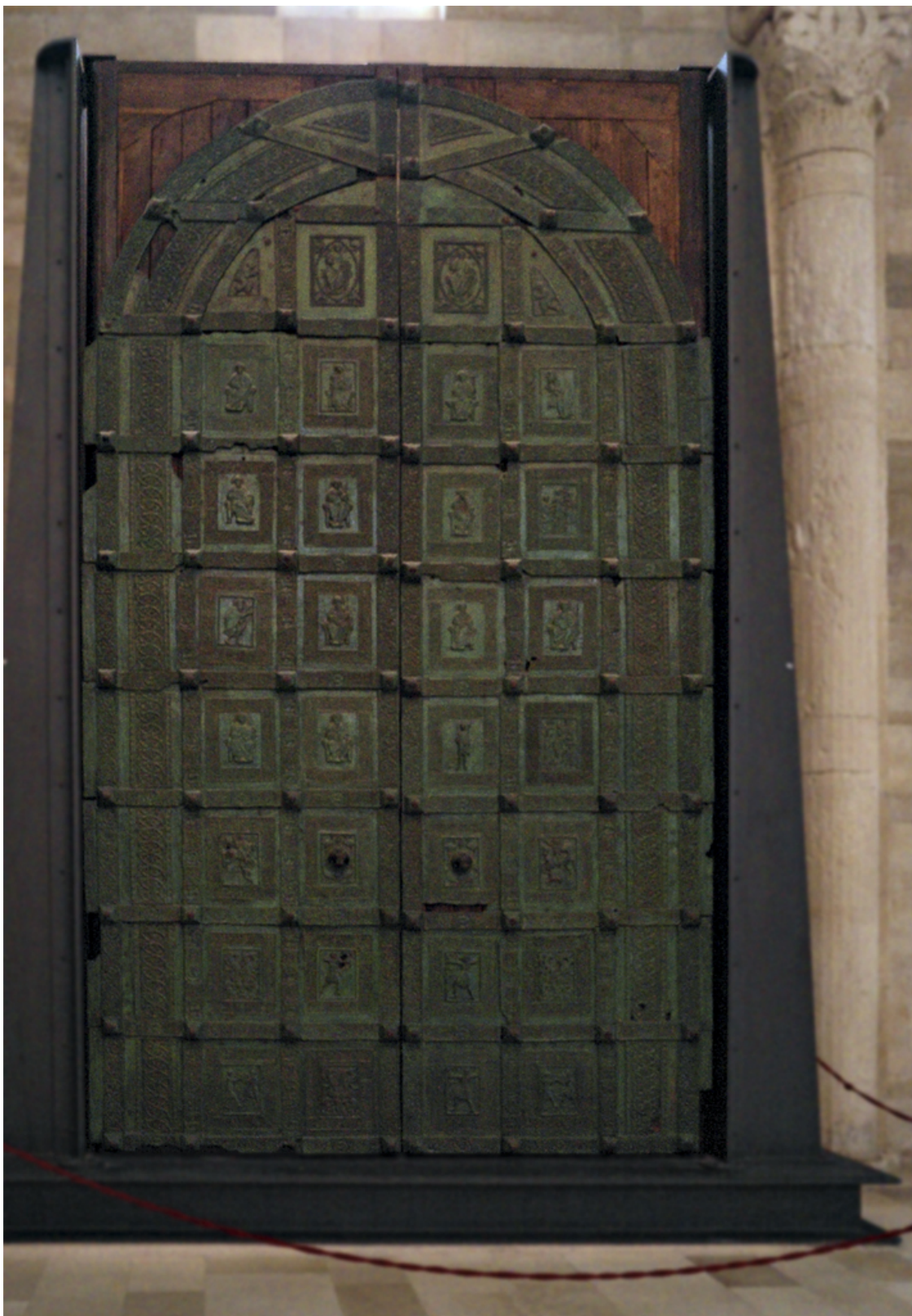
Рисунок 18 Оригинал бронзовых дверей собора.