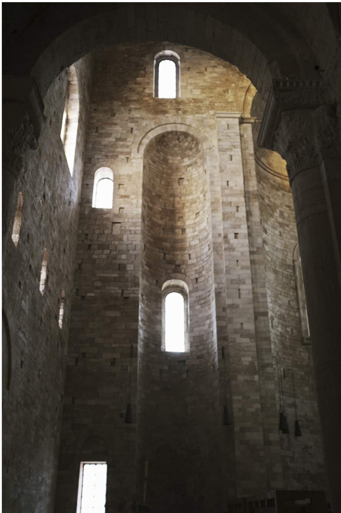
Рисунок 19 Алтарная часть бокового нефа

Восточную часть нефа завершает алтарная абсида, пропорции которой поражают. Абсид такой высоты я еще не встречала.