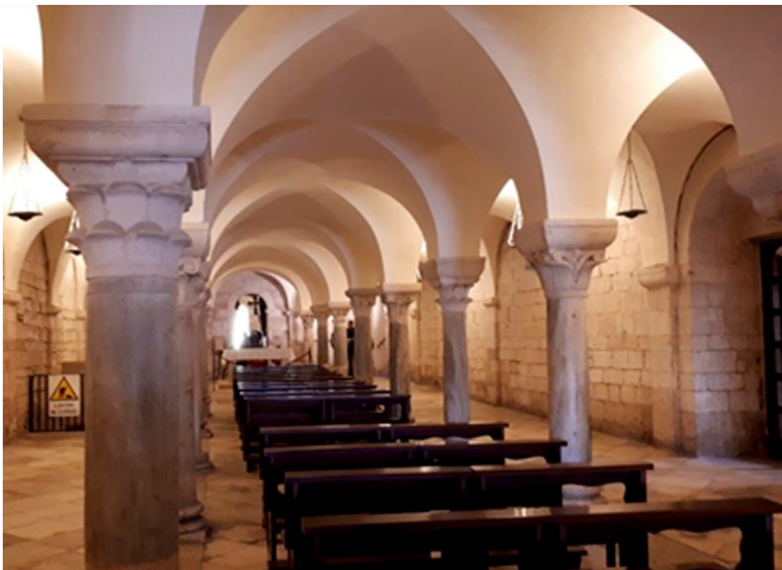
Рисунок 8 Нижний храм