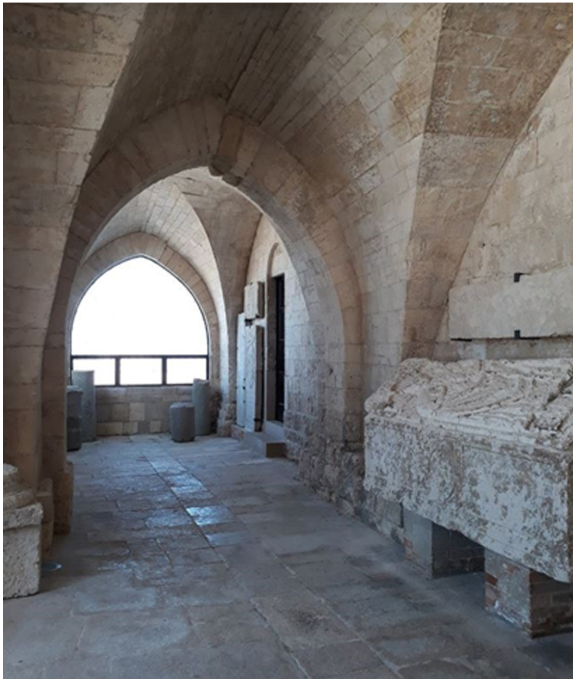
Рисунок 7 Входная галерея нижнего храма