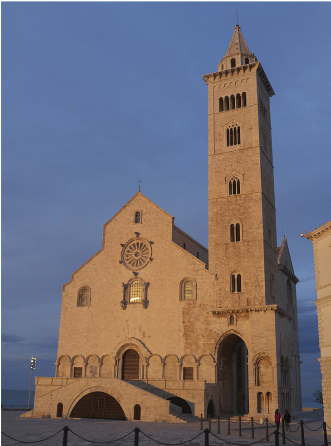
Рисунок 2 Кафедральный собор Трани (1056- 1186 гг.)