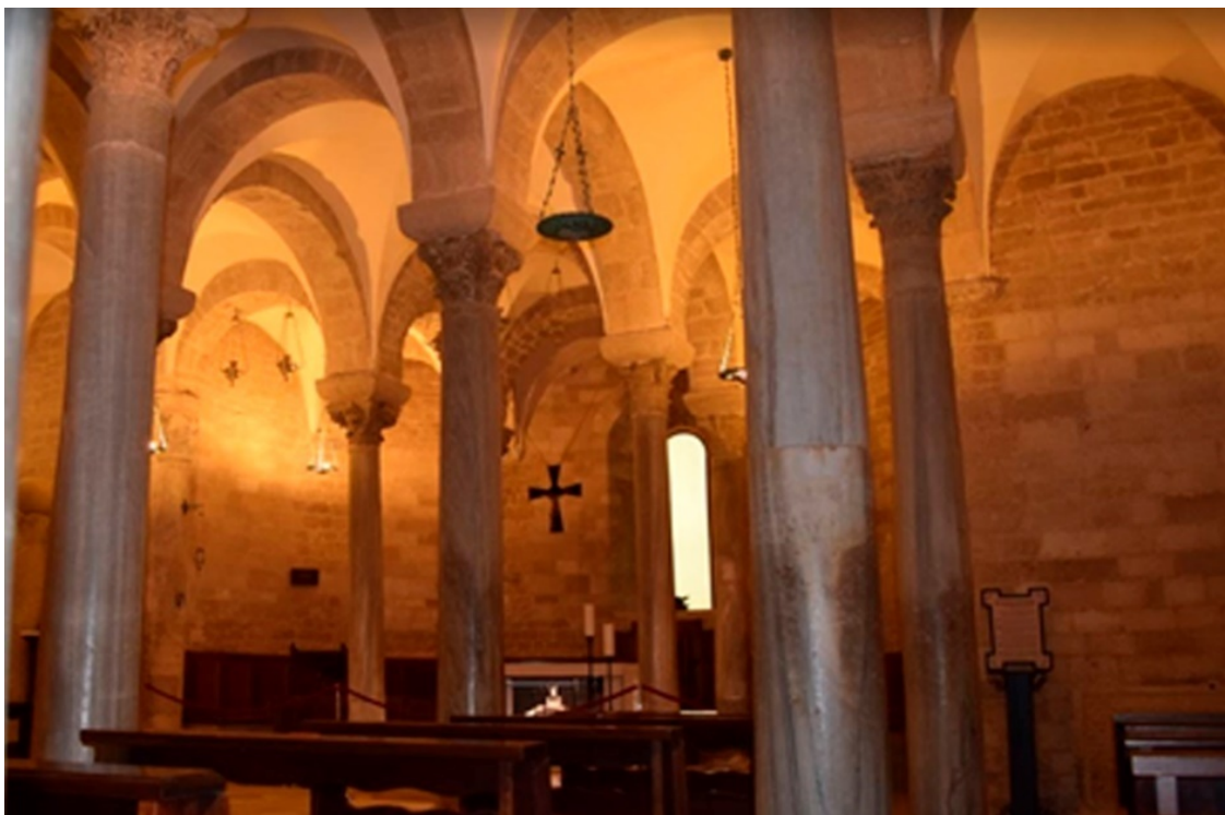
Рисунок 11 Нижний храм

В начале прошлого века английский журналист Генри Мортон посетил Трани: «...лес античных колонн, стоящих близко друг к другу, и ступени, ведущие в темный древний собор Святой Марии.