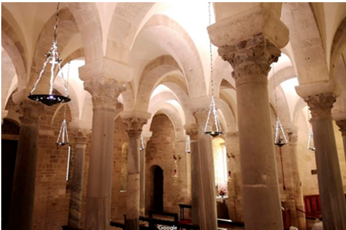
Рисунок 10 Нижний храм