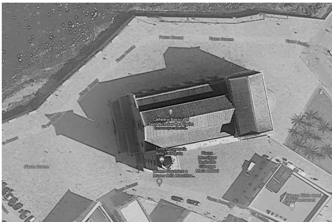
Рисунок 3 Собор в Трани

в Битонто, Руво, Трани и Барлетте единственные башни пристроены к храмам сбоку.