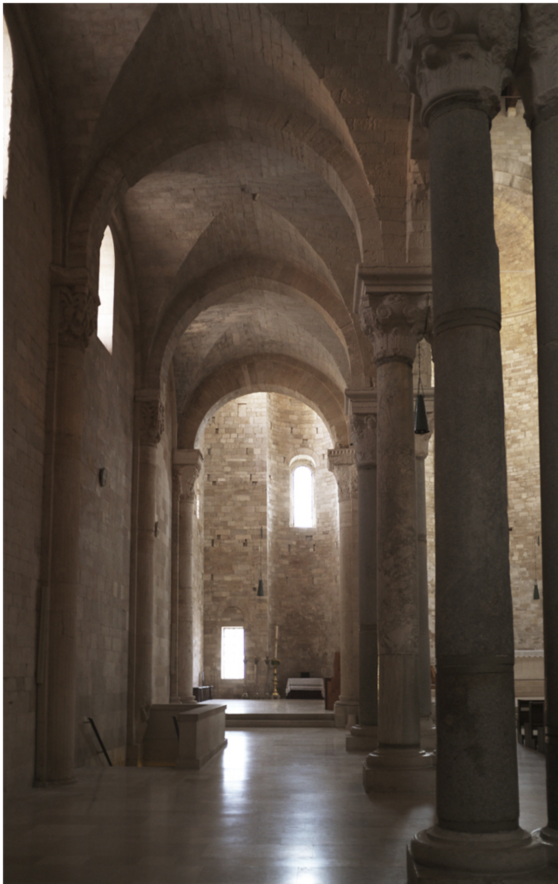
Рисунок 20 Боковой неф храма