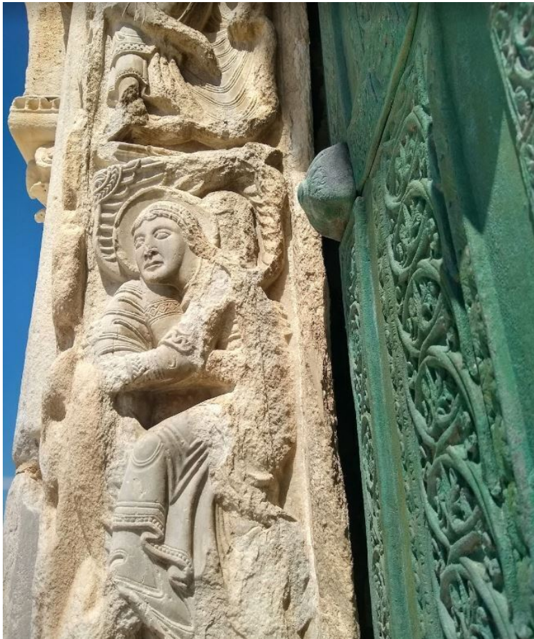
Рисунок 17 Двери собора Трани