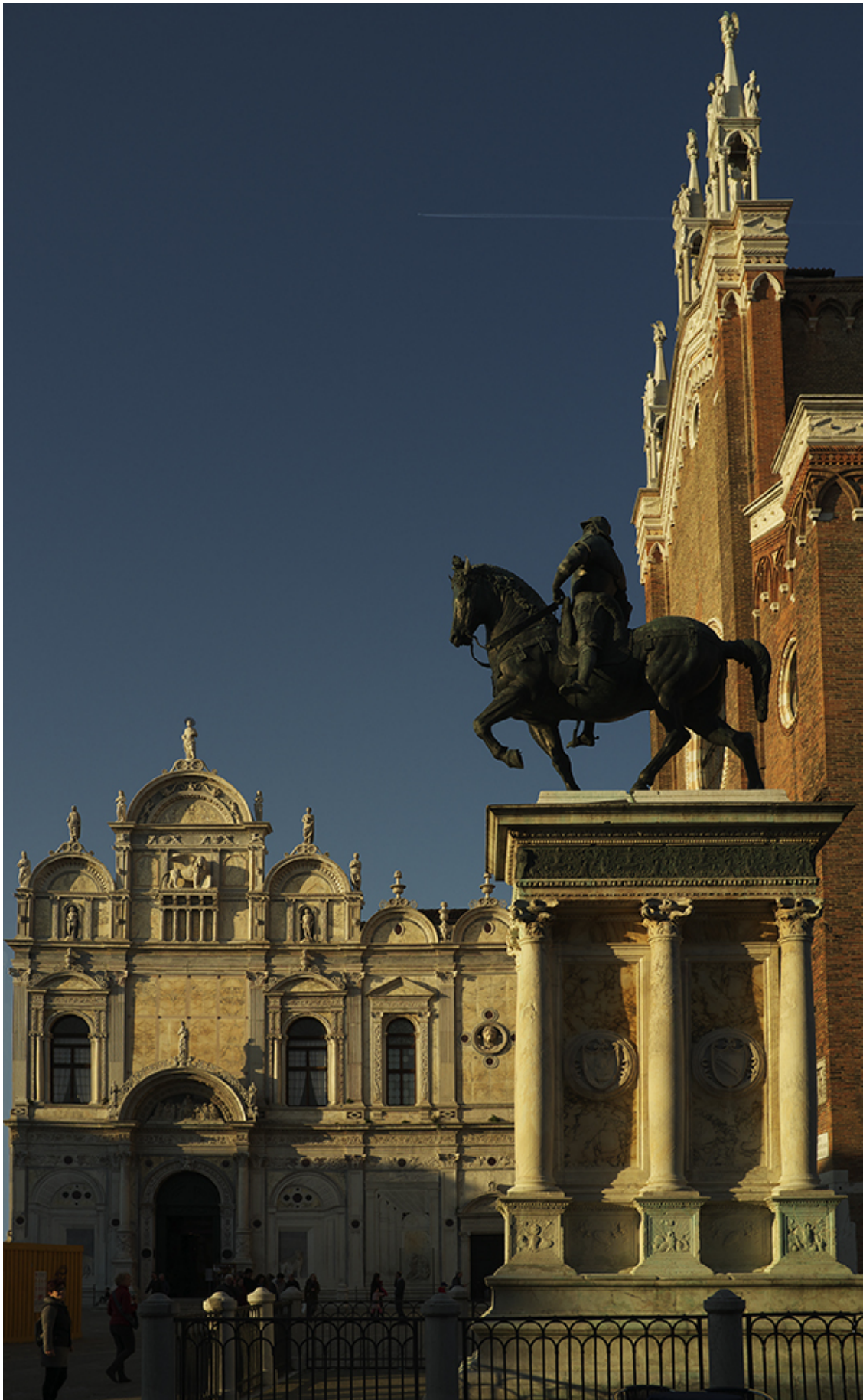
Рисунок 3 Памятник Коллеони в Венеции