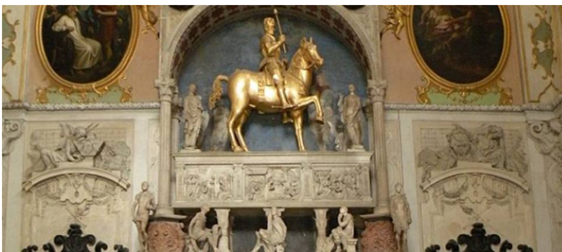
Рисунок 2 Деревянная конная статуя на надгробии Коллеони

Думаю, ни одному солдату в истории не было установлено два таких прекрасных памятника, как этот и знаменитая статуя работы Верроккьо в Венеции.»