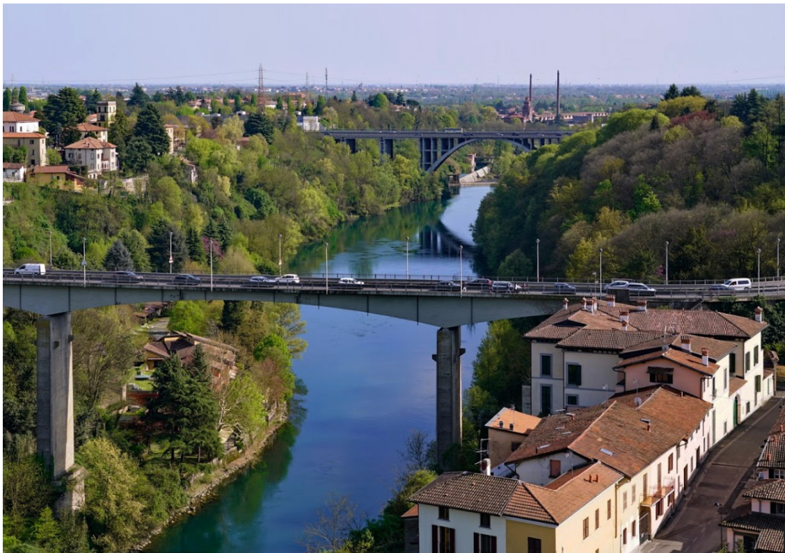
Рисунок 6 Река Адда

Семья Пухо переехала в обретенный замок. Там и рос его маленький наследник. До тех пор, пока Пухо не приютил двух своих кузенов из Бергамо, что-то не поделивших с тамошним руководством. Кузенам замок понравился. Причем настолько, что они решили, что Пухо