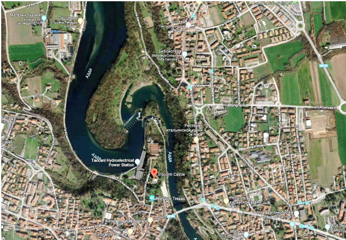
Рисунок 5 Замок Треццо