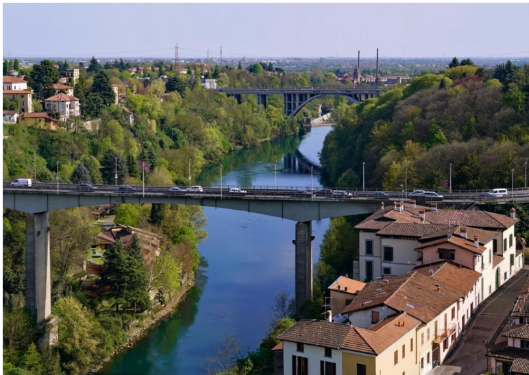
Рисунок 6 Река Адда