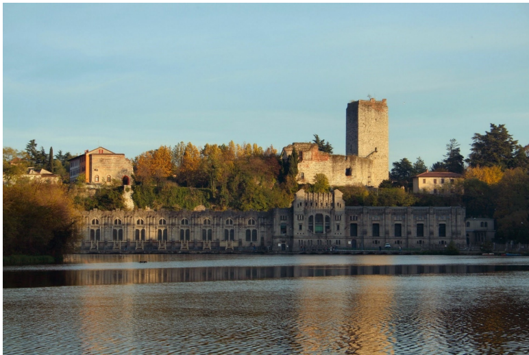
Рисунок 4 Замок Треццо

Соединенный с берегом трехъярусным мостом, замок Треццо стоял просто исключительно: в излучине реки Адды, на пути из Милана в Венецию и построен был по всем правилам военного искусства человеком, который знал в этом толк.