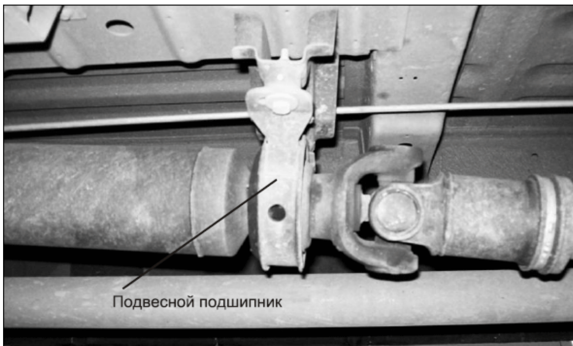
Рис. 1.3. Длинный карданный вал с подвесным подшипником

На большинстве современных автомобилей применяется переднеприводная схема установки агрегатов и узлов: двигатель расположен спереди поперек автомобиля, агрегаты и трансмиссия также расположены спереди. В этом случае трансмиссия передает крутящий момент передним колесам, которые одновременно являются ведущими и управляемыми. В результате такого расположения агрегатов можно существенно уменьшить их массу и высоту центра тяжести. Такими же преимуществами обладают автомобили с задним расположением двигателя и агрегатов трансмиссии, передающих крутящий момент задним ведущим колесам.