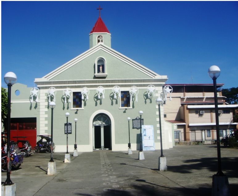
Церковь в Балере, современный вид