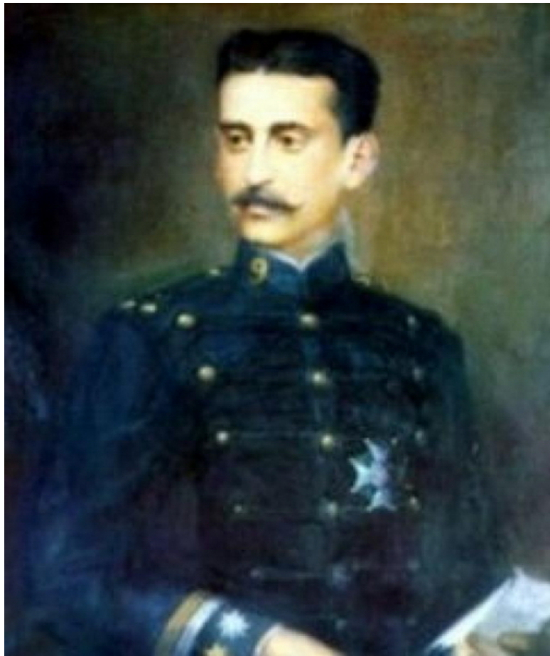
Капитан Лас Моренас