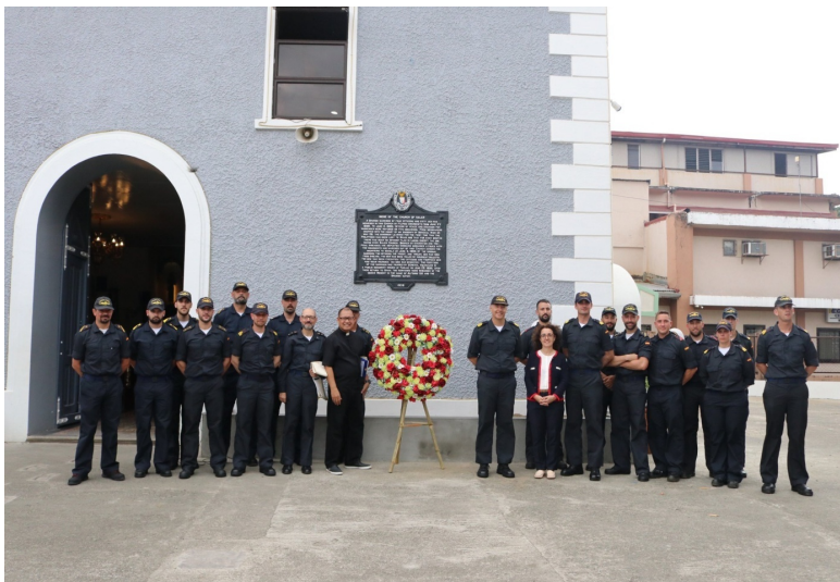
Члены экипажа фрегата “Méndez Nuñez” у церкви Балера