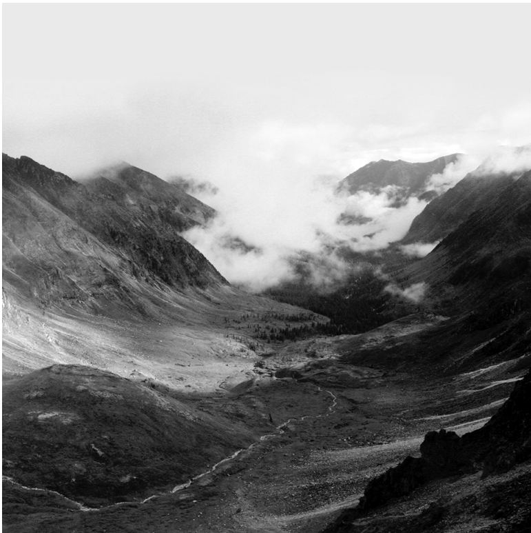
фото: Георгий Богословский, «Покой»

Кто может с уверенностью сказать, что он знает и понима-