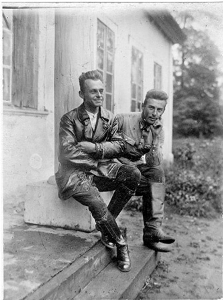
Витольд Пилецкий с другом в Сукурчах. Ок. 1930 го-