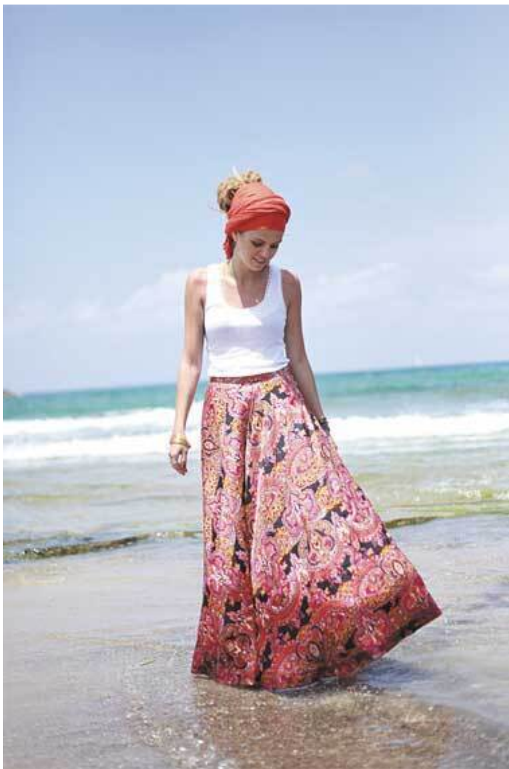
Винтажная юбка и тюрбан на дредах – идеальный прикид бизнесвумен