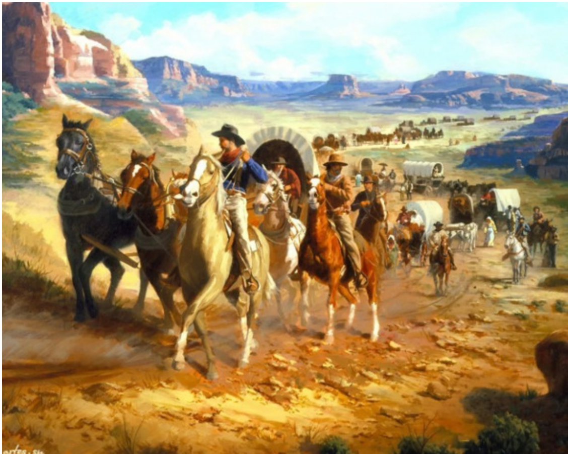
Переселенцы на Диком Западе