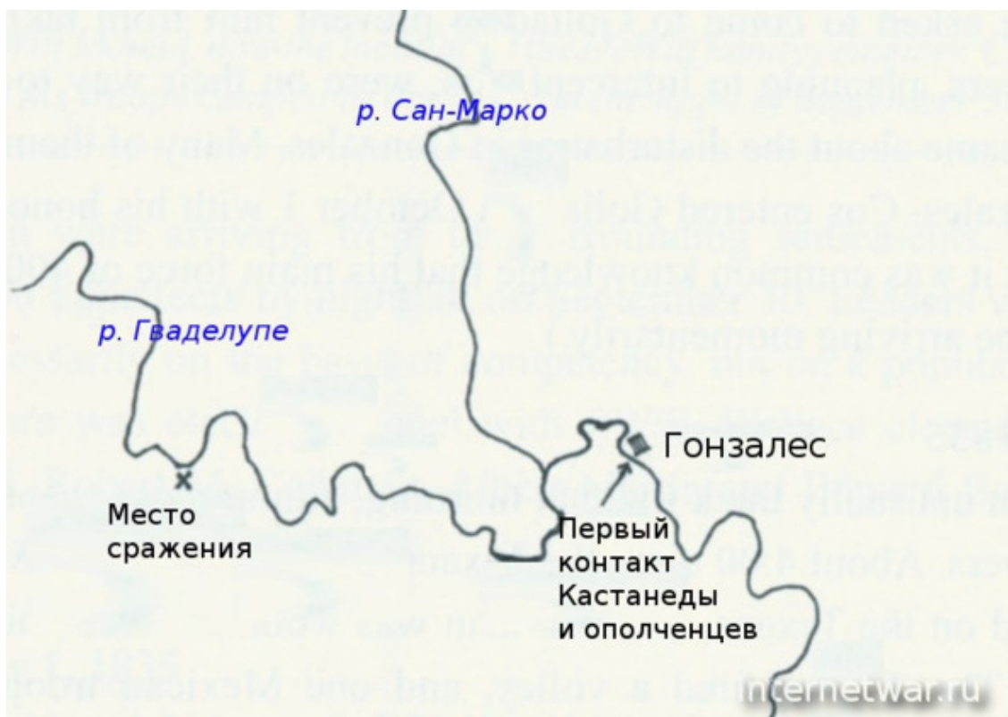
Карта окрестностей Гонзалеса

Для понимания дальнейшего важно учесть приказ, который Угартечеа отдал Кастанеде: по возможности избегать действия силой. Для чего в таком случае высылать целую сотню драгун? Только чтобы воздействовать на поселенцев эффектом массы? Скорее всего. Но на поселенцев прибывшие к городу 29 сентября 1835 года драгуны не произвели должного впечатления.