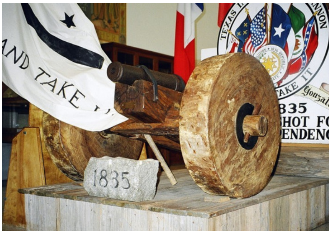
Маленькая пушка в мемориальном музее Гонзалеса

Причиной же сражения, ставшего первым за всю войну, была ма-а-аленькая пушка.