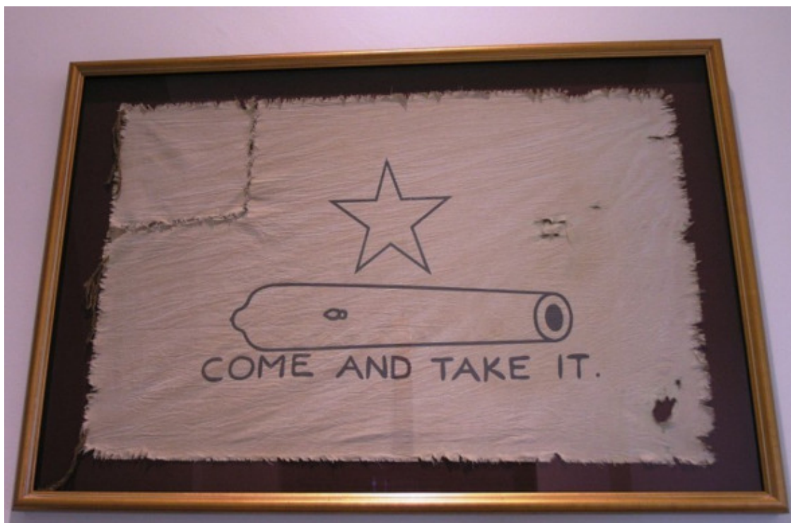
Реплика флага «Приди и возьми» на Капитолии штата Техас.

В общем, дело запахло жареным, и вечером 1 октября Кастанеда отошел от города и разбил новый лагерь в 11 км вверх по реке.