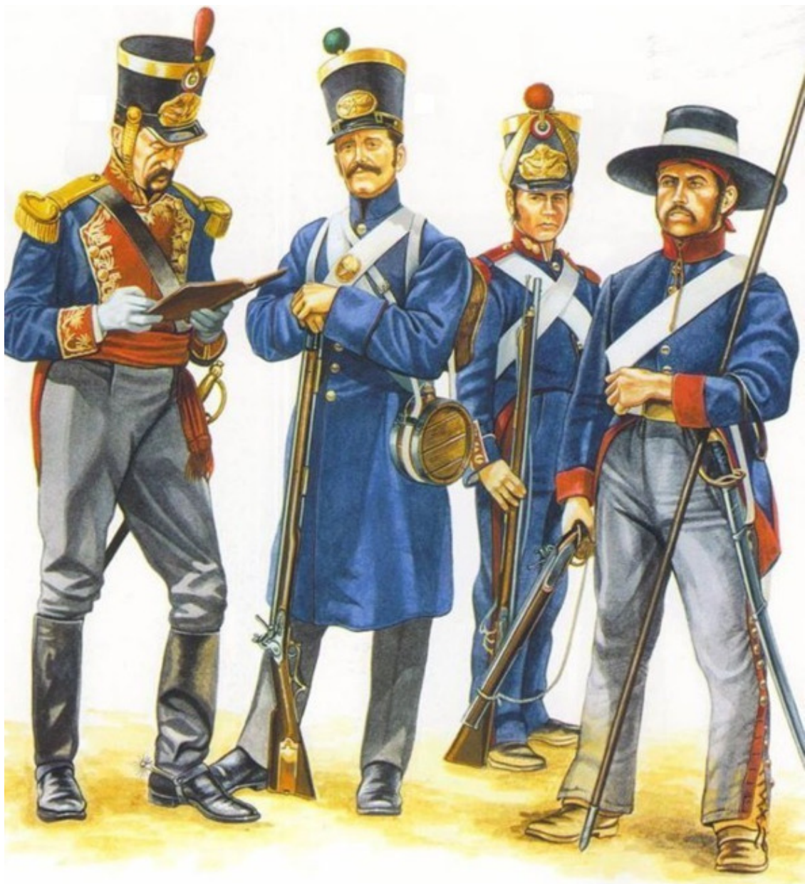
Мексиканская армия первой половины XIX века