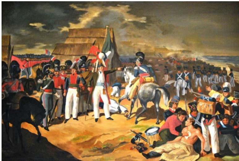
Победа Санта-Анны над испанским десантом в сентябре 1829 г.