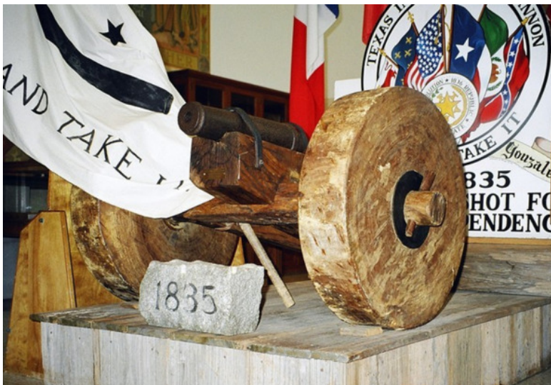
Маленькая пушка в мемориальном музее Гонзалеса