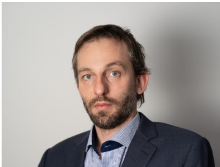
Александр Грищук (Россия, 2777) – квалифицирован как победитель Гран-При ФИДЕ 2019