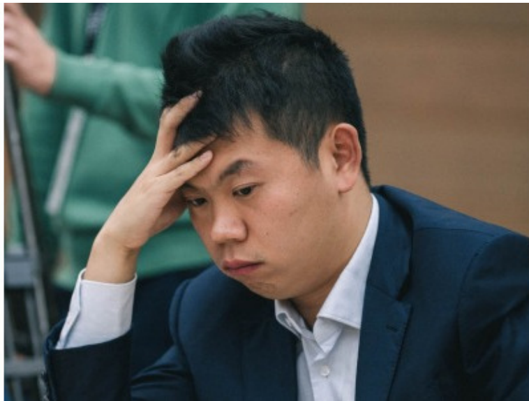
Ван Хао (CHN, 2758) – квалифицирован как победитель Большого швейцарского турнира ФИДЕ 2019