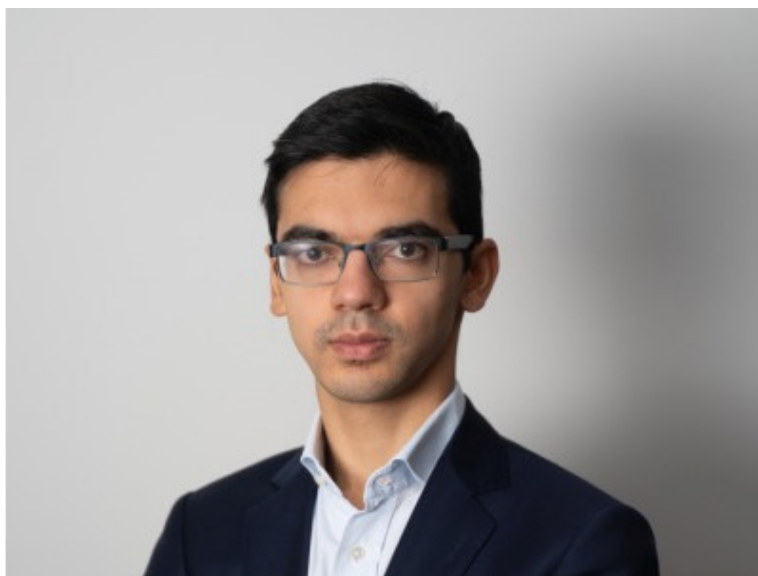
Аниш Гири (NED, 2763) – квалифицирован по рейтингу как игрок с наивысшим средним рейтингом за 12 рейтинговых периодов с февраля 2019 по январь 2020