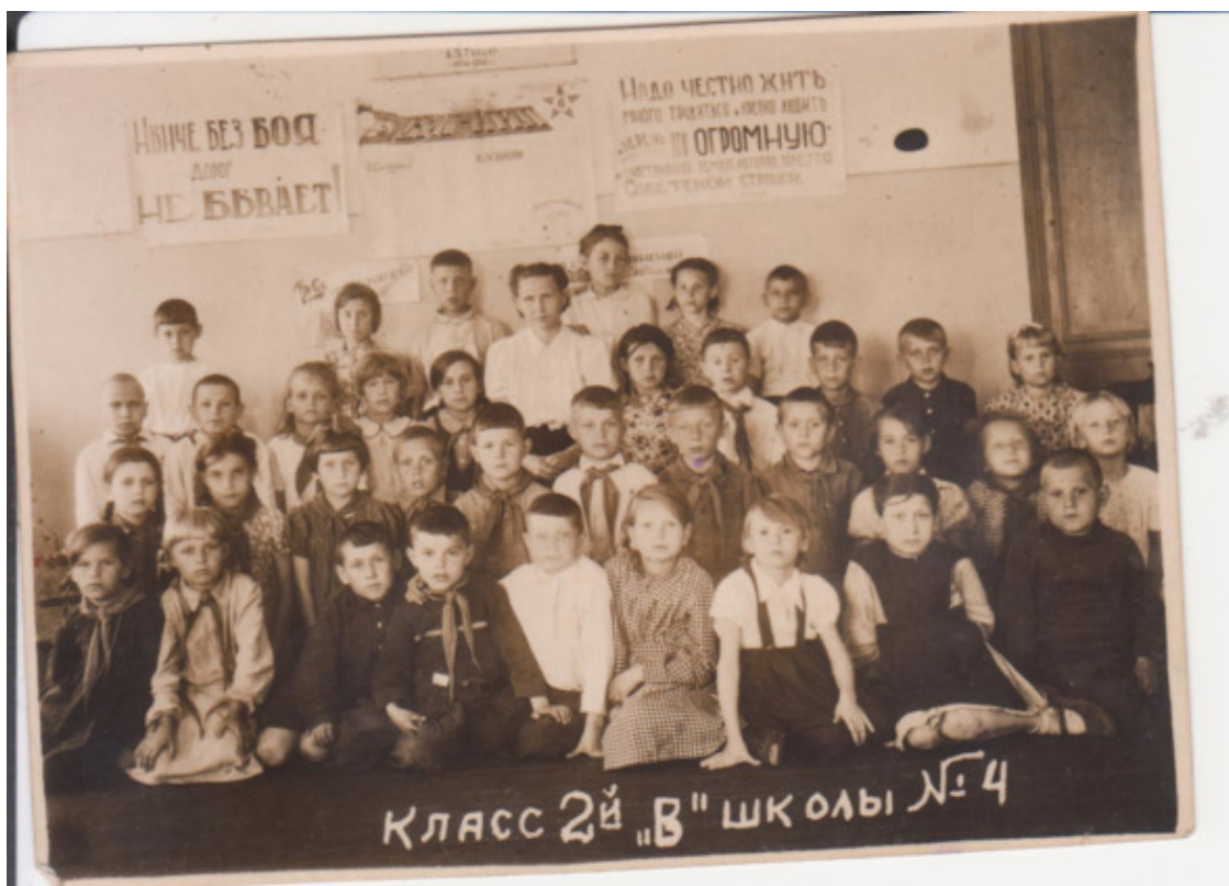
Школа №4 Тракторозаводского района Сталинграда. 1948 год.