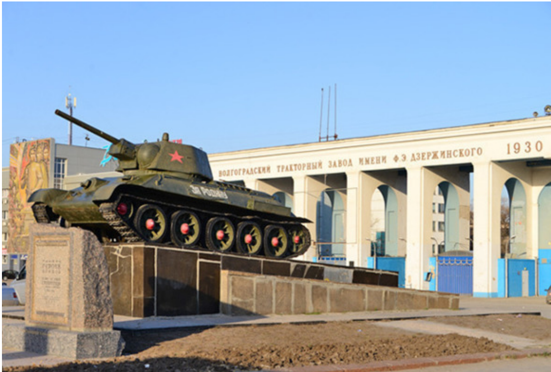
Сталинградский тракторный завод имени Ф. Э. Дзержинского.