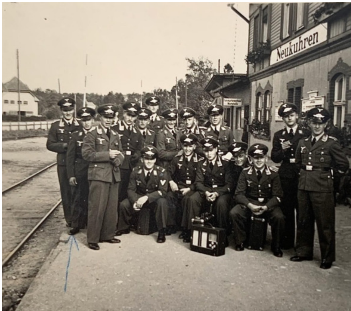
На перроне предвоенного Neukuhren.

С интернетом я знаком давно. И он в майский праздничный 75—й День Победы, как бы специально, подарил мне вот это фото. Я увеличил размеры этого фото, чтобы лучше были видны улыбающиеся лица будущих молодых офицеров Люфтваффе.