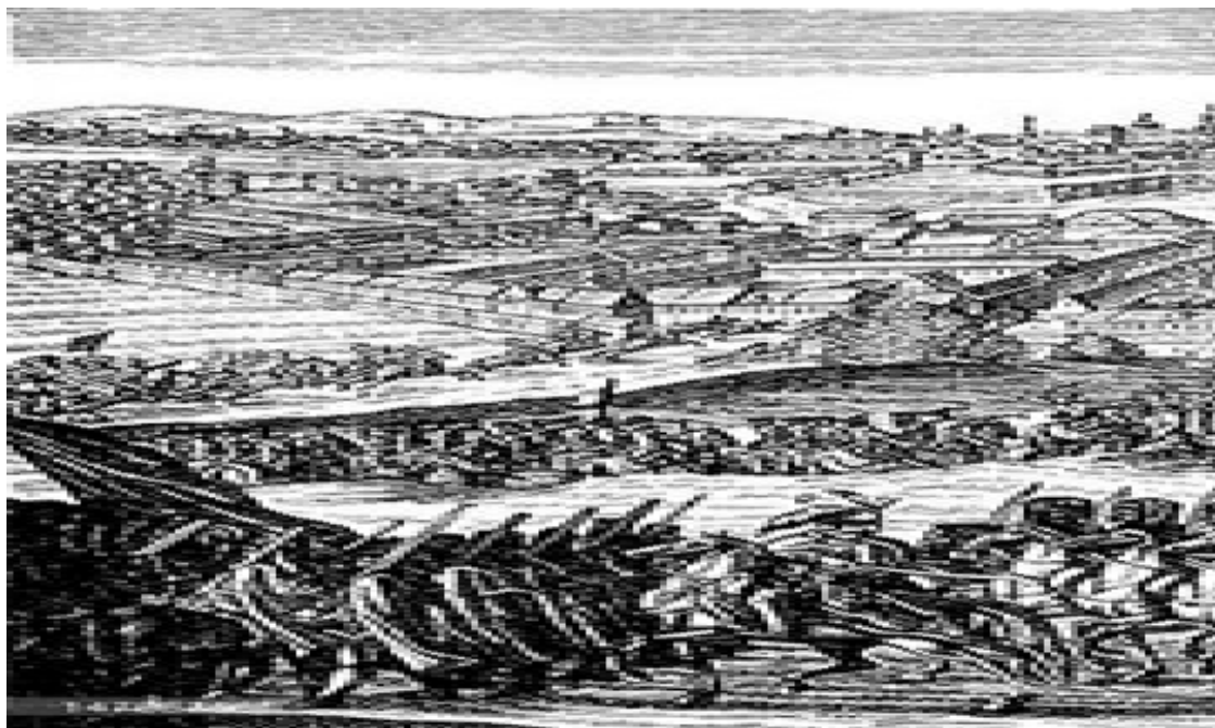
Взятие Берлина австрийскими войсками

Убедившись, что дорога на Берлин свободна, он быстро объявил боевую готовность своим солдатам и с неслыханной для тех лет скоростью выступил в поход. Казалось, Андраш Хадик перенял опыт своего главного врага, короля Фридриха: пехота Хадика проходила до 32 миль в день вместо 8 предписанных уставом, что, безусловно, было новаторским решением для того времени. В составе его корпуса было 2 тыс. кавалеристов: гусар, драгун и кирасиров, а также более 3 тыс. пехотинцев при поддержке 6 орудий.