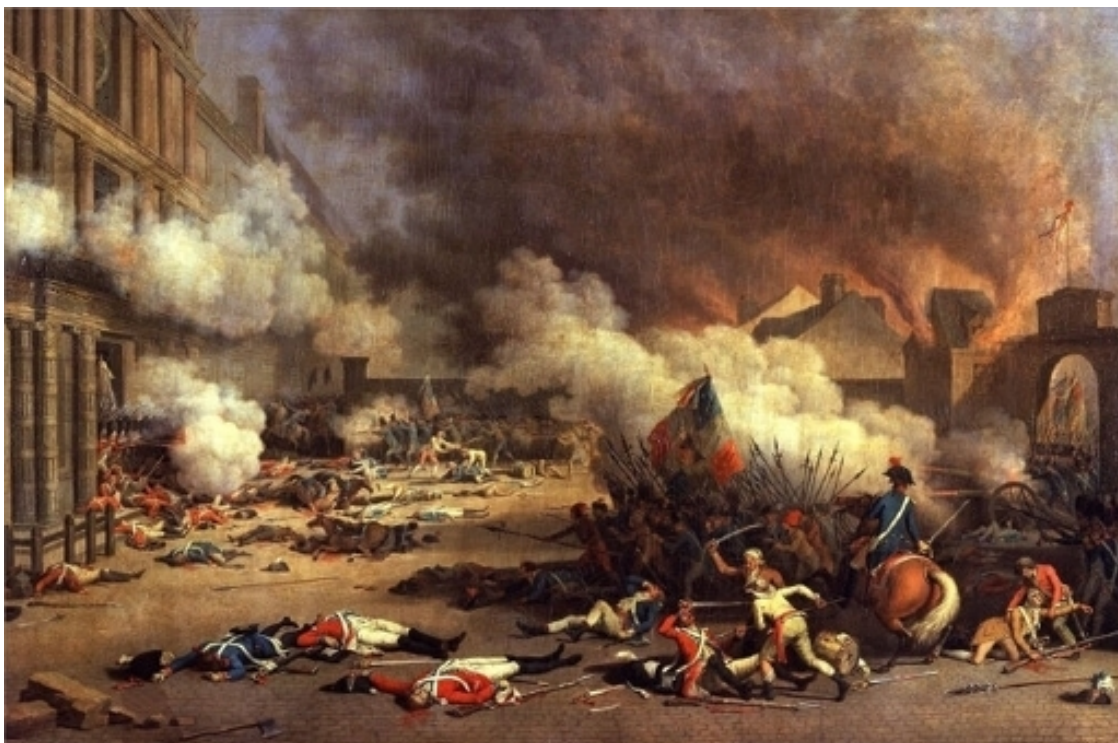
Бой в королевском дворе Тюильри