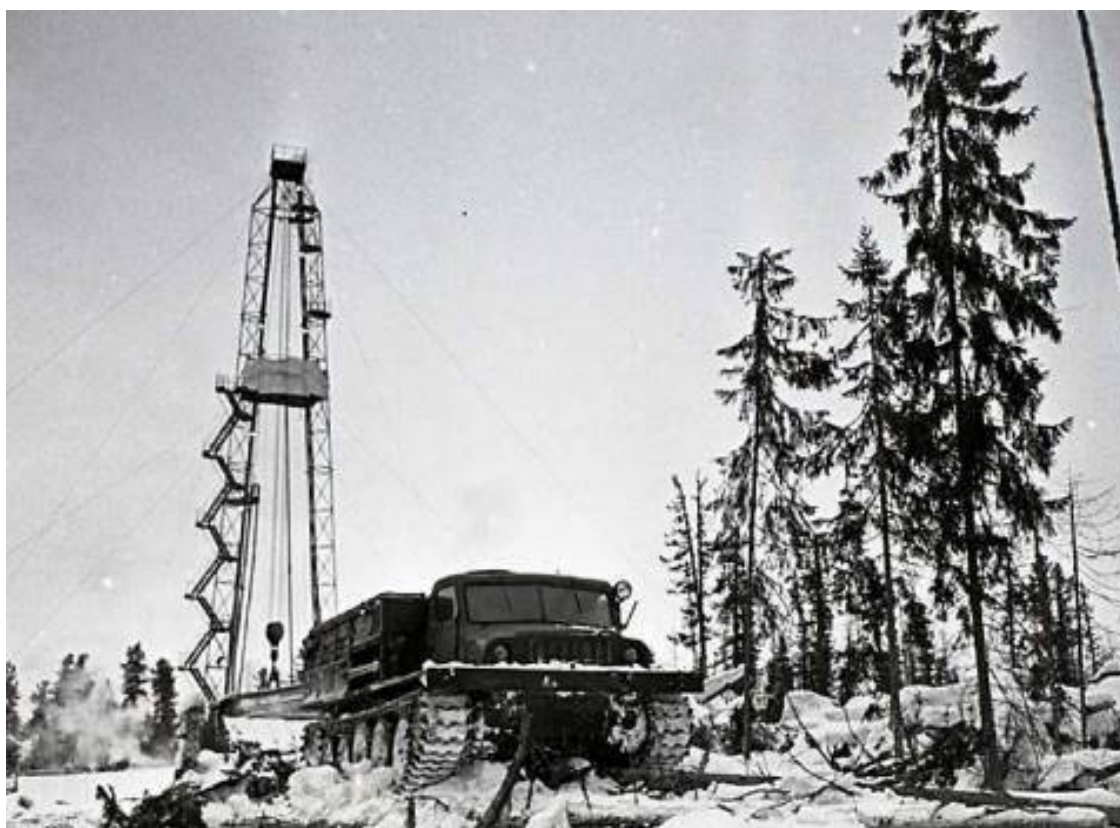
Начало большой нефти в Западной Сибири: буровая в тайге

А работы было через край. В середине 1960-х годов СССР начал реализовывать беспрецедентный мегапроект по освоению уникальных нефтяных и газовых месторождений Западной Сибири. По затратам добыча западносибирской нефти и газа забирала столько же средств как машиностроение, легкая, пищевая и рыбная промышленности вместе взятые... К решению проблем новых месторождений были привлечены более 50 НИИ. Большинство из них, как и ВНИИГИС, имело колоссальный опыт освоения, обустройства и обслуживания "второго Баку" – Волго-Уральской нефтегазоносной зоны.