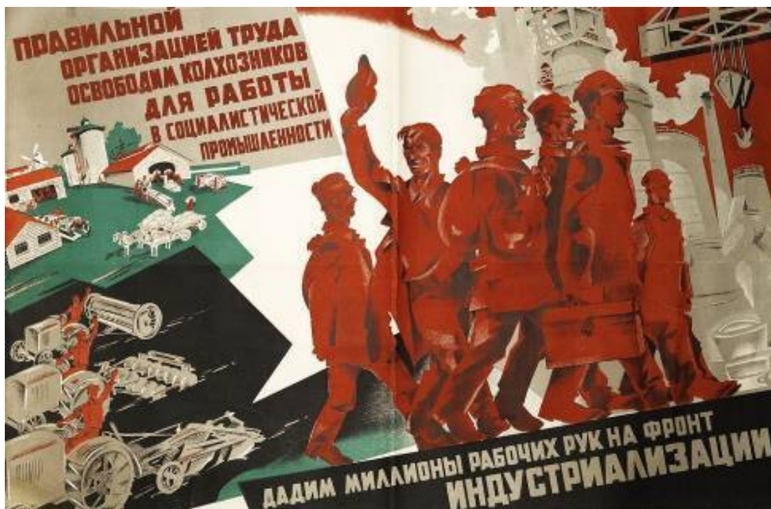
Плакат А. Радакова.

Задачи ударничества были определены в постановлении ЦК ВКП(б) от 28 апреля 1930 г.: «Основной целью ударного движения является, наряду с повышением интенсивности труда, всемерное улучшение всего процесса производства: лучшая организация труда, рационализация производства и управления, максимальное развитие изобретательства, внедрение культурных навыков в производстве».