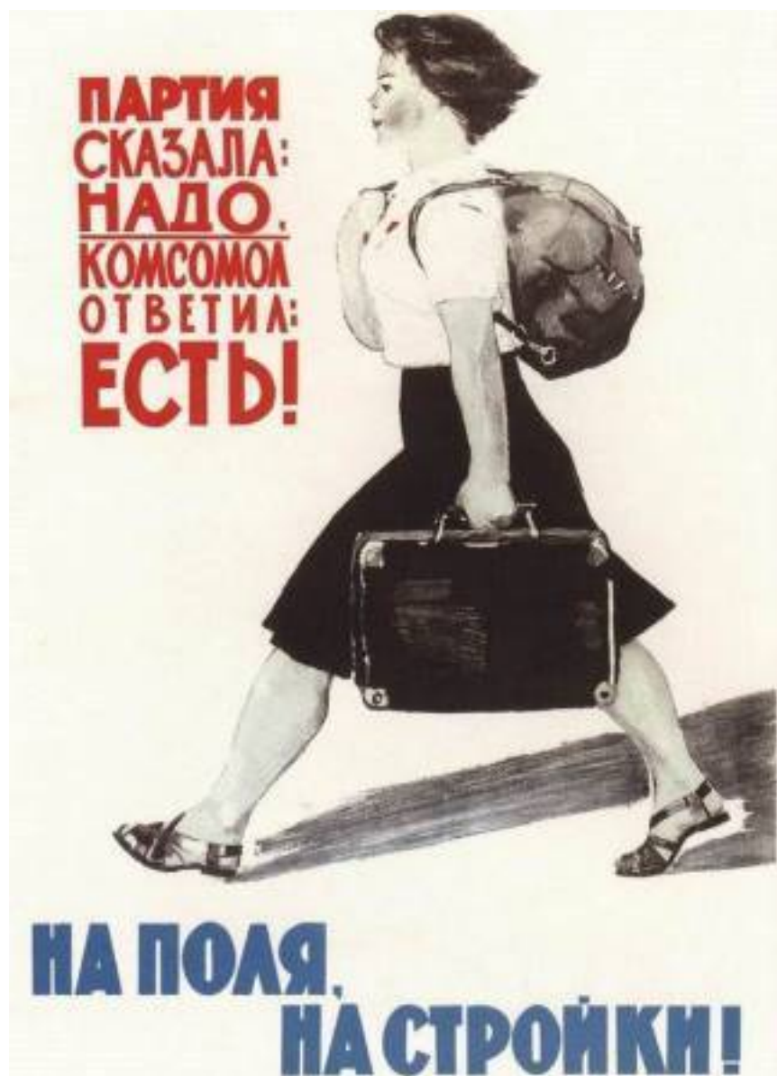
Плакат И. Большакова, В. Смирнова

Трудовой энтузиазм, подкрепленный мощной идеологической основой, не оставлял времени остановиться, оглядеться, задуматься. Как же – строим новый завод и новую жизнь, готовы терпеть временные неудобства, но работать столько, сколько надо, брать высокие обязательства к знаменательным датам и съездам партии и перевыполнять их. Трудовые будни отражали героические поступки. Стране нужны были КАМАЗы, чем больше, тем лучше. И она получала их. С каждым годом всё больше и больше. И это было главным: «КАМАЗ» спасал транспортную систему страны, а с ней и всю её экономику.