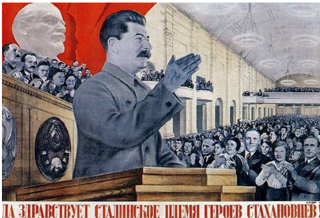
Г. Клуцис. Плакат «Да здравствует сталинское племя героев стахановцев!»

Как отмечалось в докладе, стахановцы – это новаторы в промышленности. А само стахановское движение ломает все старые взгляды на технику и людей, технические нормы, проектные мощности и производственные планы. Оно выражает новый подъем социалистического соревнования, открывает путь, на котором можно добиться высших показателей производительности труда, которые необходимы для перехода от социализма к коммунизму. Именно на том совещании Сталин произнес свою крылатую фразу: «Жить стало лучше, товарищи. Жить стало веселее».