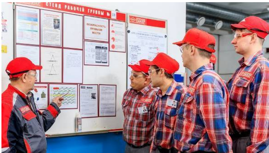
Совещание малой рабочей группы на производстве

– Те, люди, которым мы рекомендовали приехать на «Пакер» и посмотреть как достаточно твердо компания стоит на ногах, как внедряет современные организационные инновации, возвращаясь восклицали: «Да, а чего же вы хотите? Там и собственник и руководитель в одном лице. В этом и весь успех». А мы неизменно отвечали: конечно, это так, но для этого нужно ещё активно и грамотно использовать весь личный менеджерский ресурс руководителя.