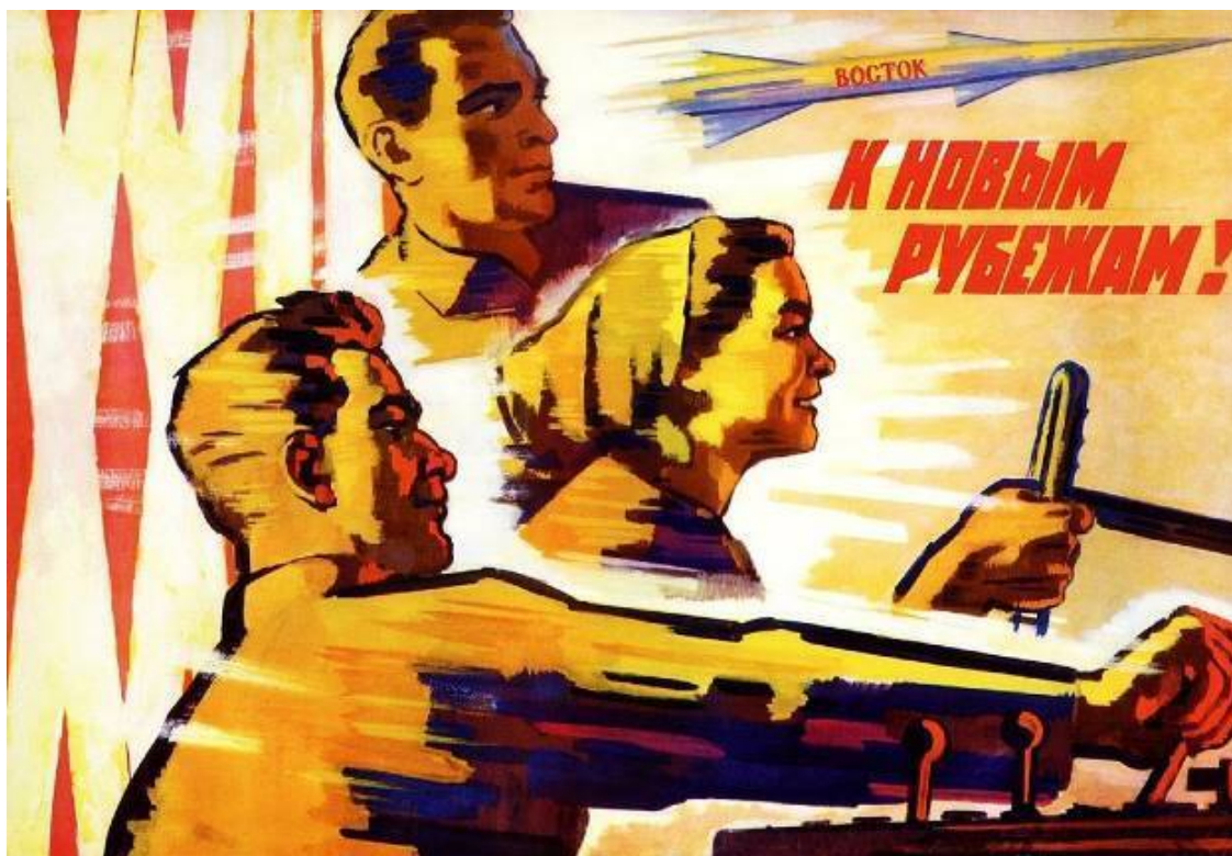
Плакат Е. Соловьева

По данным ВЦСПС на 1 января 1972 года в движении за коммунистическое отношение к труду по индивидуальным социалистическим обязательствам было вовлечено почти 42.5 миллиона человек. По сути – каждый второй работающий! Свыше 106 тысяч предприятий и организаций, более 767 тысяч цехов, участков, отделений, отделов, почти два миллиона бригад в промышленности, строительстве, на транспорте, в сельском хозяйстве, торговле и так далее боролись за звание коллективов коммунистического труда.