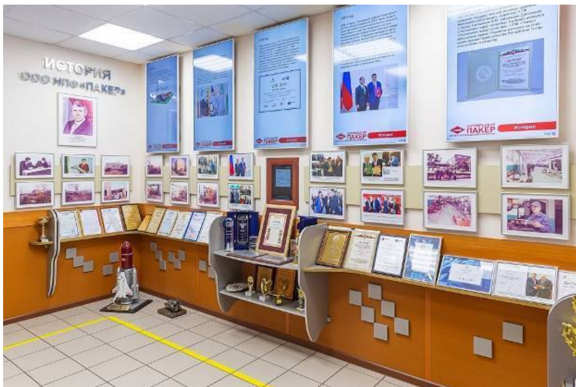
Музей НПФ «Пакер»