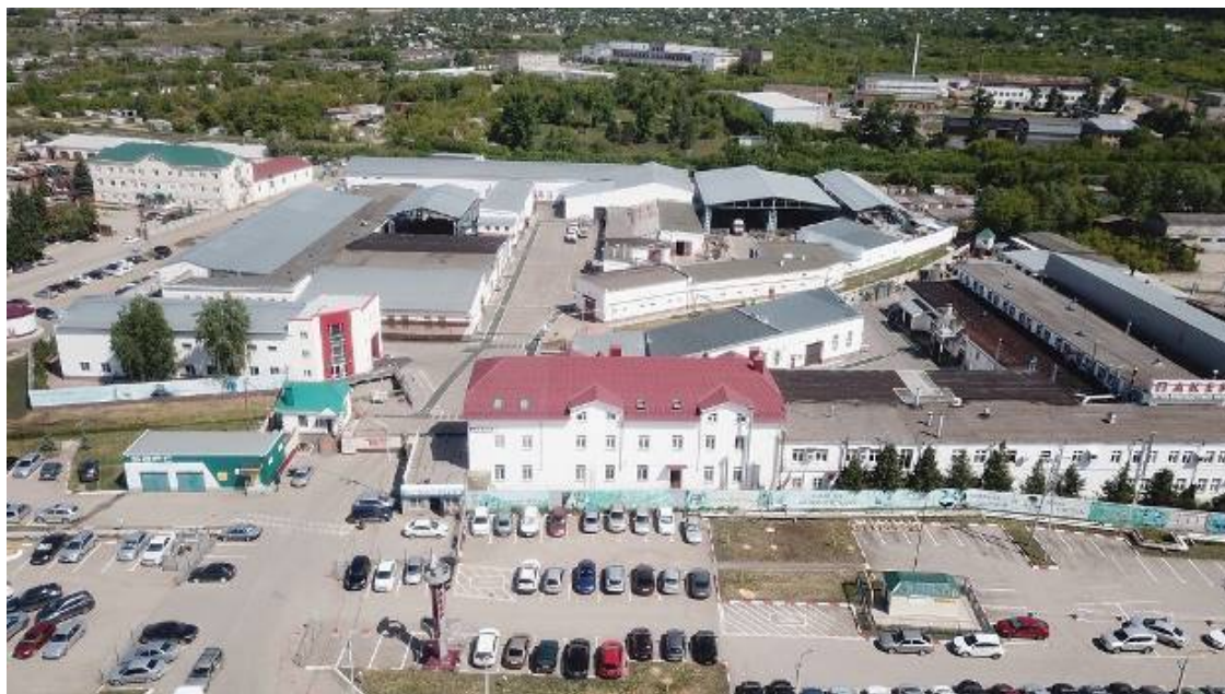
НПФ «Пакер» с высоты птичьего полета