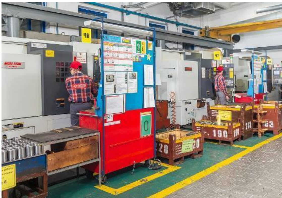
Рабочее место оператора станка с ЧПУ

Точку отсчета этому сотрудничеству положил оценочный аудит, за которым последовали три обучающих корпоративных семинара и восемь консультативных сессий в рамках проекта развития производственной системы компании. Этот проект охватил такие базовые инструменты бережливого производства как Упорядочение/5S – систему организации и рационализации рабочего места; TPM – систему всеобщего производительного обслуживания оборудования и Бережливый офис – современную управленческую технологию для офисных работников.