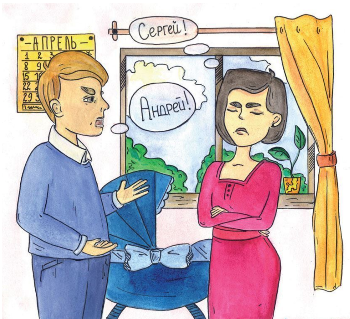
Рисунок Дарьи Астраханцевой

Потом работник ЗАГСа объяснил, что если мама и папа не придумают имя, то его дадут в органе опеки и попечительства нашей администрации.