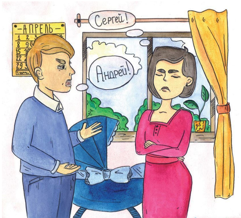
Рисунок Дарьи Астраханцевой