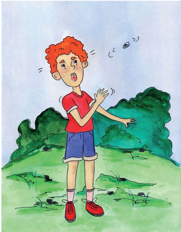
Рисунок Дарьи Астраханцевой