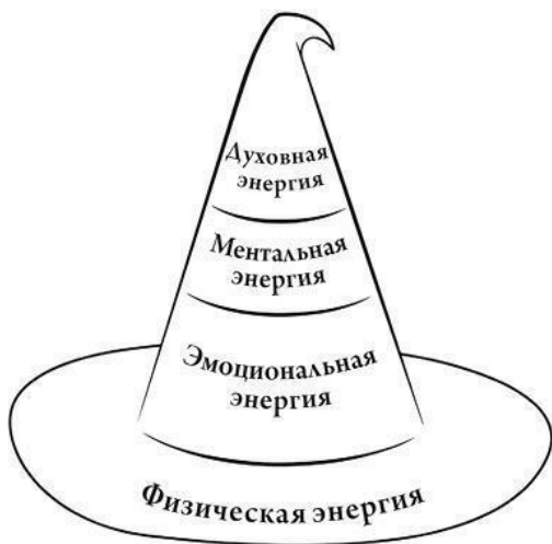
Рис. 1. Шляпа ведьмы: иерархически организованные типы человеческой энергии

ем, были впервые рассмотрены психологом Абрахамом Маслоу, который разработал пирамиду, изображающую иерархию человеческих потребностей 9 . Чтобы она стала более узнаваемой для единомышленников, возьмем вместо пирамиды шляпу ведьмы (рис. 1).