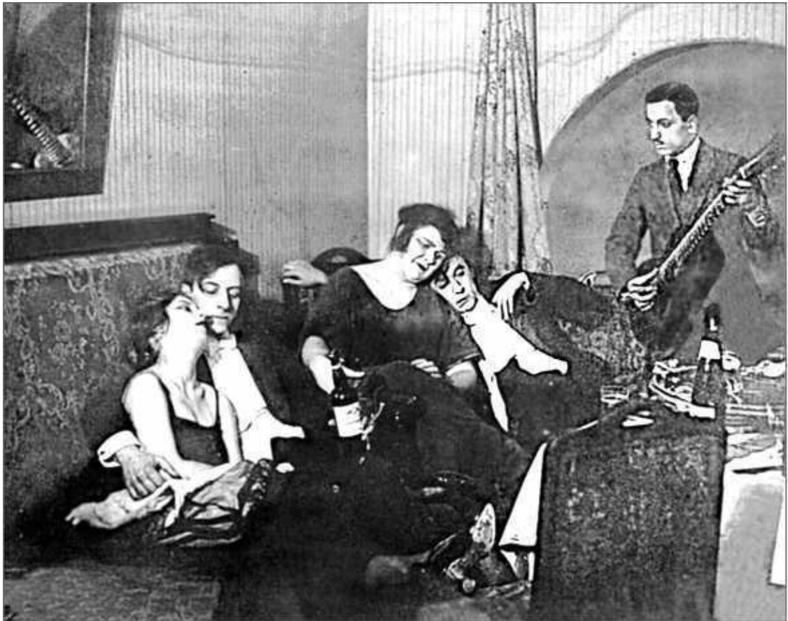
Посетители в отдельном кабинете ночного ресторана (гостиница «Европейская»). Ленинград, 1924 г.

были весьма существенными – от роскошного борделя на Потемкинской улице с дорогими (до 25 руб.) девицами до вертепов Сенного рынка, где можно купить потасканную и переболевшую сифилисом проститутку за 30 копеек 40 . Впрочем, под давлением общественного мнения публичные дома постепенно закрывались, и в начале XX в. их осталось всего 32. Потребители вынуждены были искать доступных женщин в ресторанах, трактирах или просто на улицах.