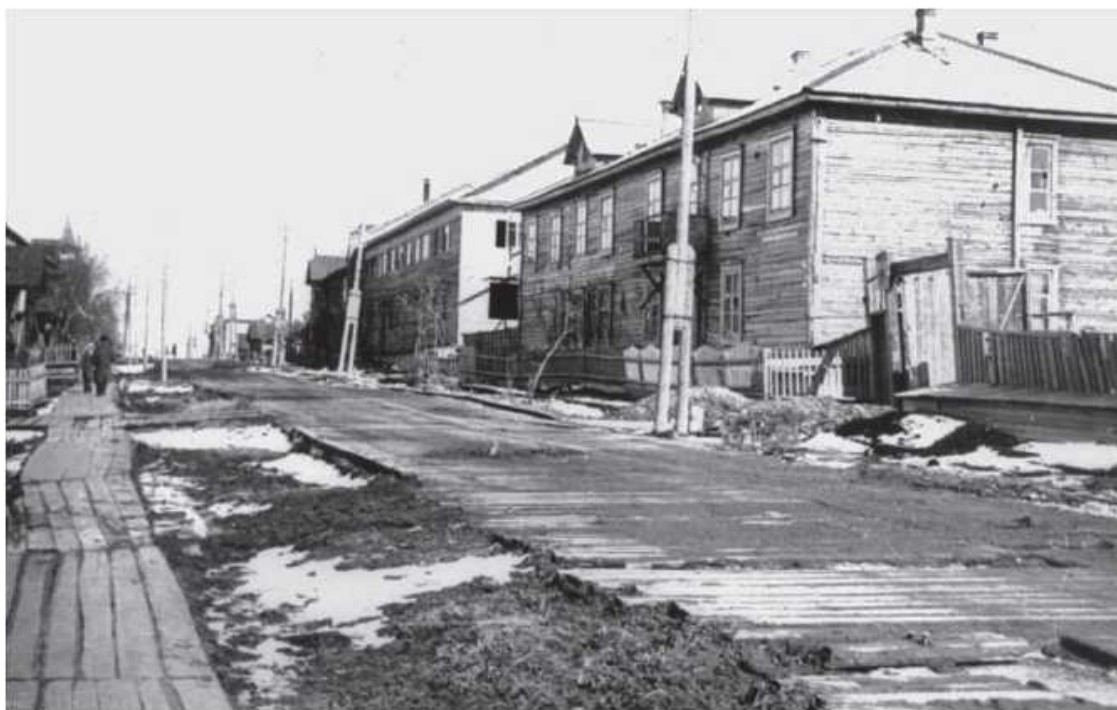
Улица Ленина до 1-й школы

С трудом отбившись от энтузиазма селян и с сожалением поглядывая на здоровенные бутылки с самогоном, международная делегация благополучно отбыла в Тюмень.