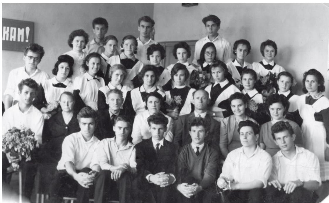
10-й класс, автор – в третьем ряду крайний слева

Нам было по пятнадцать, мы были юны, стройны, красивы, полны сил и веры: читали Евтушенко, читали Вознесенского, переписывали «Пилигримов» Бродского. Мало знали, еще