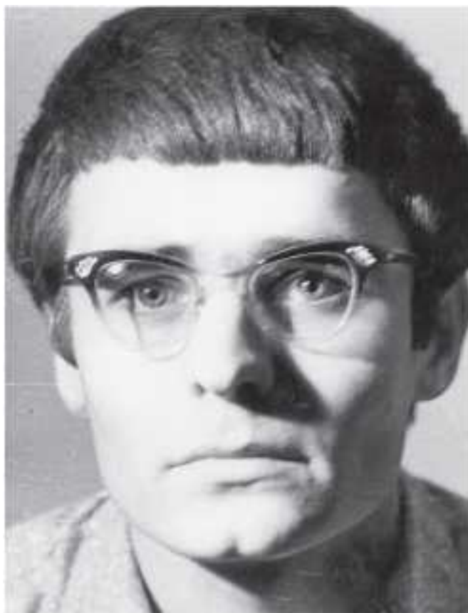
КГУ, физфак, 2-й курс, 1964 год