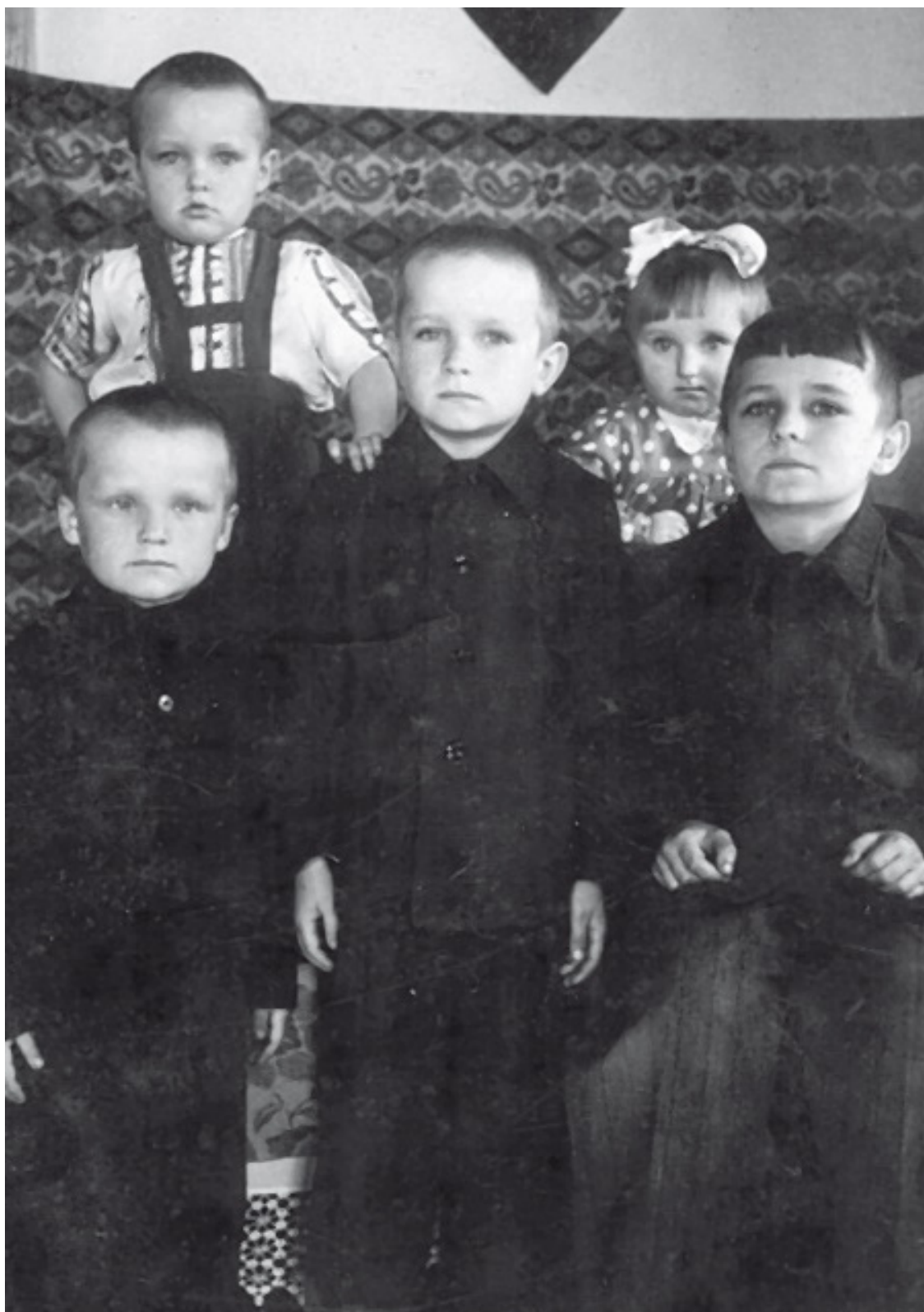
А вот и мы, все пятеро