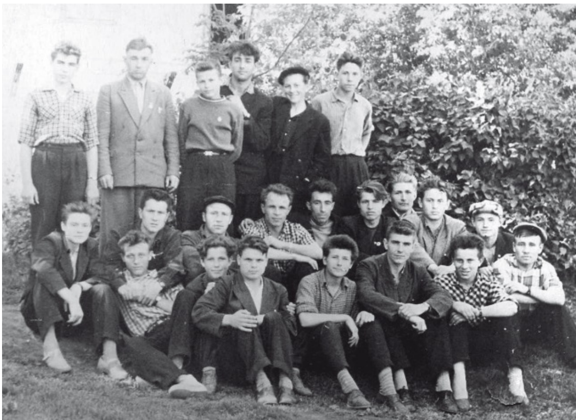
Усольский техникум, в парке

На вечера отдыха в актовом зале или, как их правильно назвать, на танцы приходилось лезть через окно туалета: ребята в красных повязках фильтровали клиентов. Играл джазовый оркестр КАИ – авиационного института.