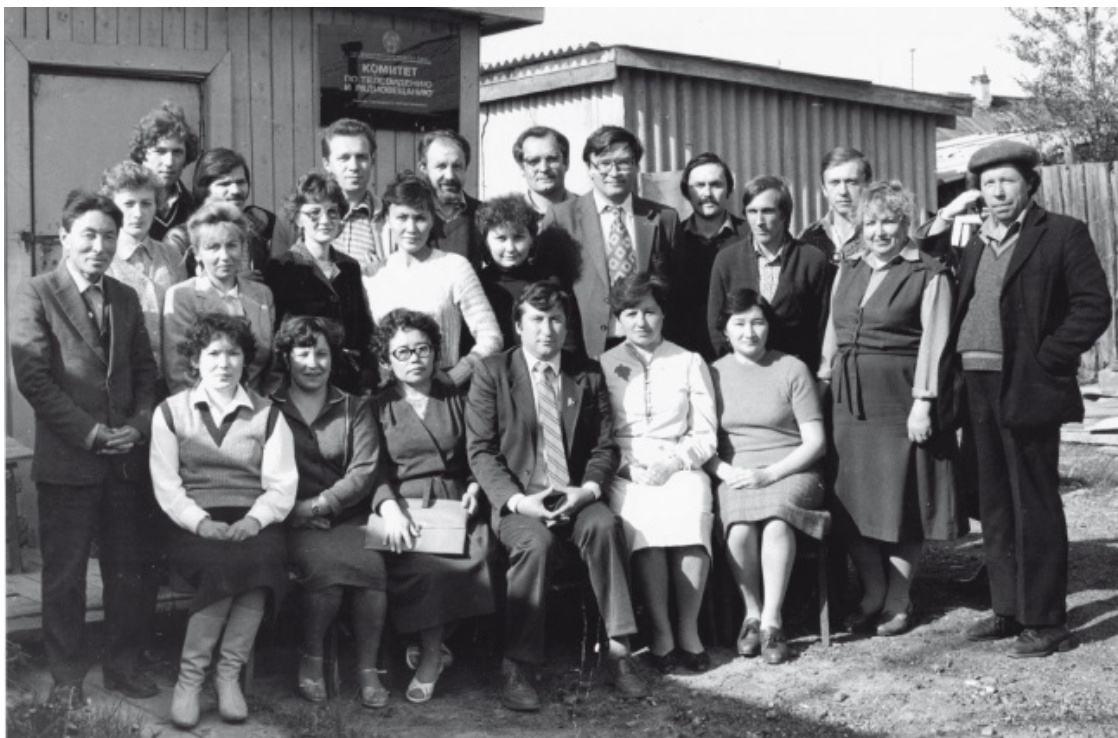
Лето 86-го, коллективный снимок

В столице округа Салехарде были исключительно деревянные строения, преимущественно бараки 501-й стройки, и первая кирпичная пятиэтажка, где разместились все власти: и города, и округа, – появилась только в 1975 году. Автомобили на улицах можно было пересчитать по пальцам, по домам развозили воду на лошадях, по-моему, даже телефоны были трехзначными, и девушки-связистки соединяли клиентов «вручную». В списке телефонов окрисполкома значился «конный двор».