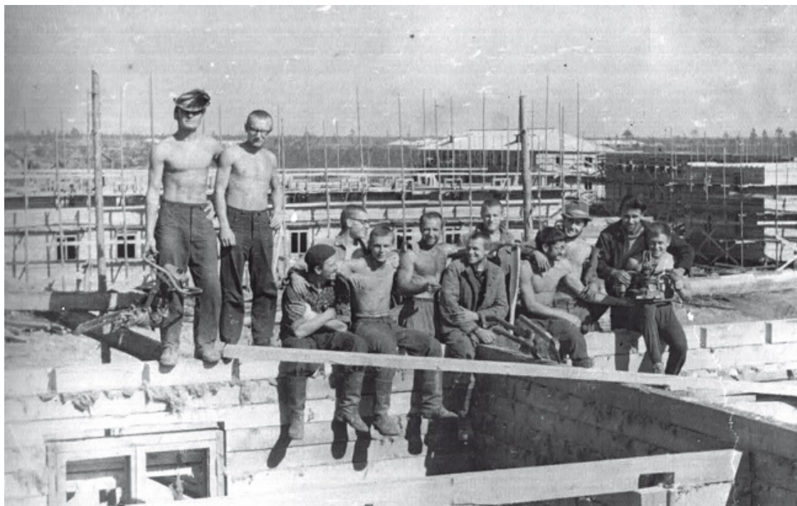
Стройотряд, автор – крайний слева