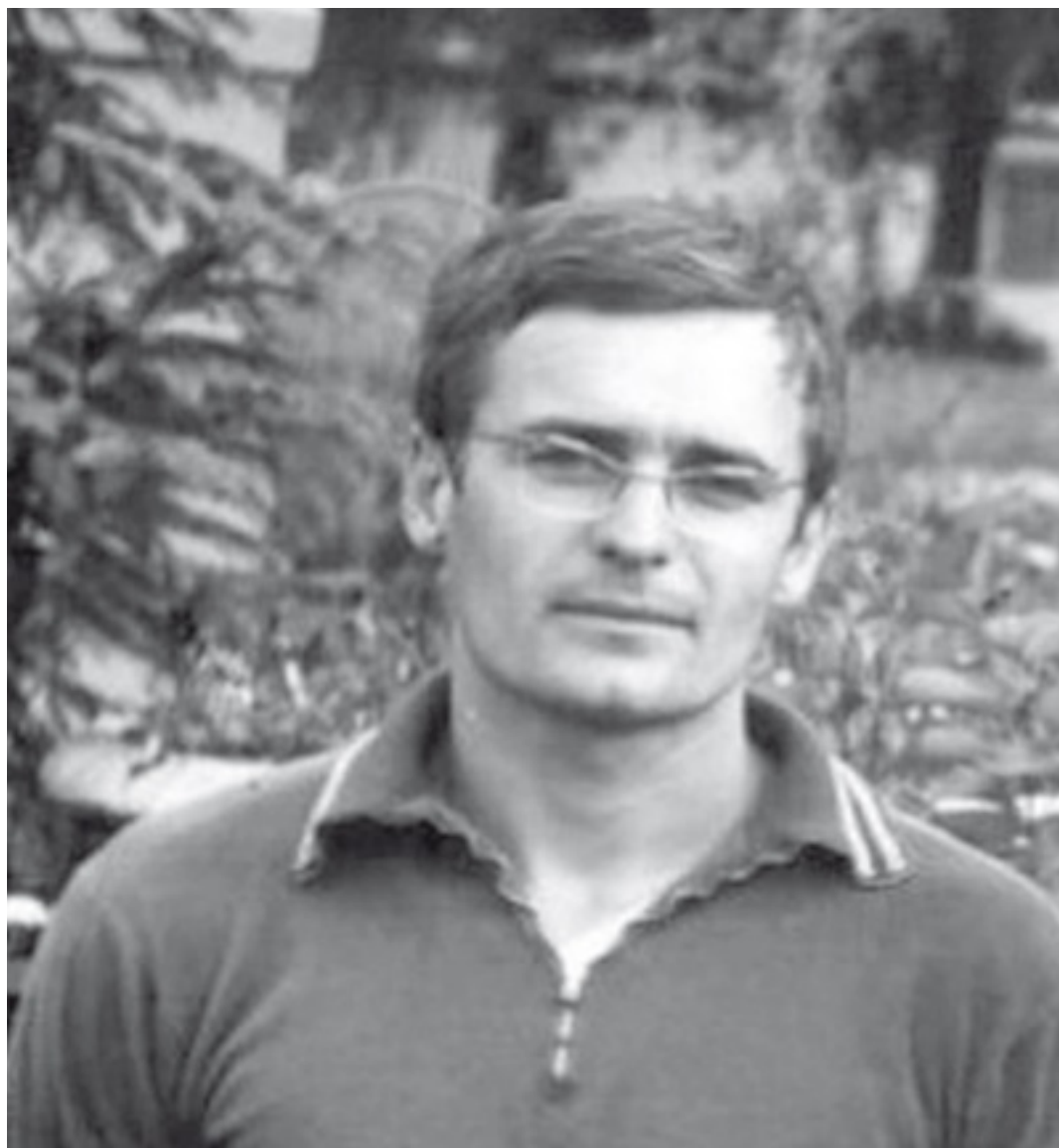
Волейбол в парке, 1968 г.

Утром я проснулся знаменитым. За завтраком начали подтягиваться делегаты из корпусов: «Политрук! Сказочку!! Вечером!!!»