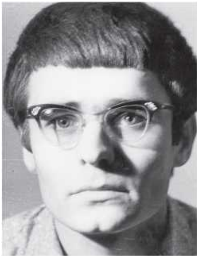
КГУ, физфак, 2-й курс, 1964 год