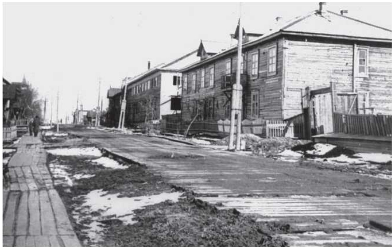
Улица Ленина до 1-й школы