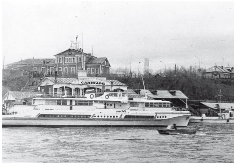
Салехардская старая пристань