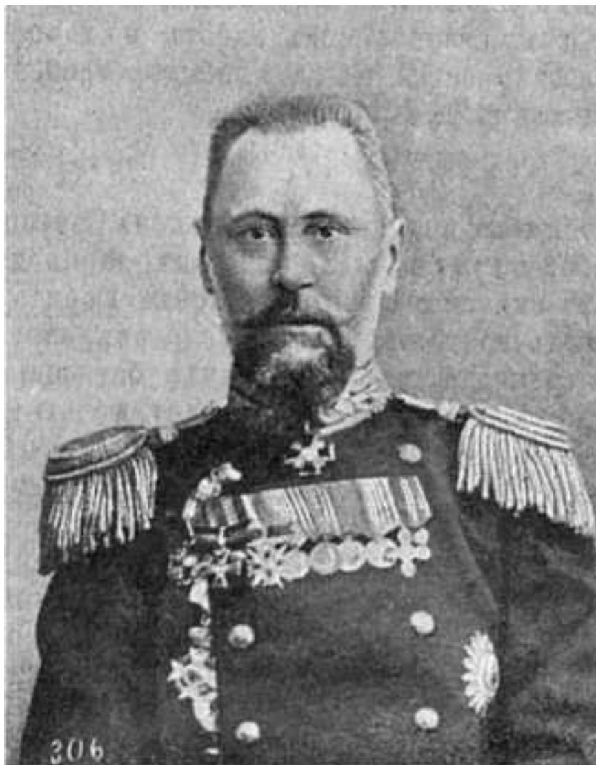
Командир эскадренного броненосца «Князь Потёмкин-Таврический» капитан I ранга Евгений Николаевич Голиков

Чашу терпения голодной и замордованной команды переполнила весть о том, что их будут кормить на обед борщом из червивого мяса. Матросы отказываются от некачественного борща. Взбешенный командир строит команду на палубе и приказывает всем есть борщ! Чтобы не доводить дела до крайнего обострения наиболее сознательные матросы-большевики во главе с Григорием Вакуленчуком выходят из строя и говорят, что согласны есть борщ. Они считают, что время восстания на броненосце еще не пришло и его надо устроить на всем флоте одновременно, причем несколько позднее. За матросами-большевиками соглашаются есть борщ и все остальные. Инцидент, кажется, исчерпан, но командир корабля внезапно для всех решает жестоко покарать, не желавших обедать матросов. Он приказывает отделить часть команды для публичного массового расстрела здесь же на палубе. Матрос Вакуленчук пытается предотвратить расправу, но разъяренный старший офицер смертельно ранит матроса из револьвера.