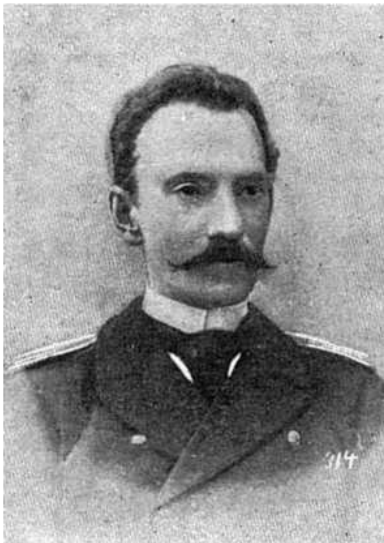
Ипполит Иванович Гиляровский

По поведению матросов и по действиям самого Вакуленчука он понял, что Вакуленчук и есть тот самый вожак команды, которого они с командиром искали. Старший офицер прицелился и выстрелил. Григорий упал на палубу, смертельно раненный. Падая, он крикнул подбежавшим матросам: «В Одессу! К рабочим!» Многие из матросов слышали этот призыв любимого товарища. Выстрел в Вакуленчука на какой-то миг вызвал среди матросов замешательство. На это и рассчитывал Гиляровский... «Гиляровского за борт!» – крикнул кто-то. Матросы устремились туда, откуда раздался выстрел. Но Гиляровского за башней не оказалось. Он скрылся. На палубу с винтовкой в руках (но без патронов) выбежал Матюшенко. Голиков вместе с артиллеристским офицером Неупокоевым преградили ему путь. «Брось винтовку!» «Никогда, пока я жив!» «Брось оружие, приказываю!» «Убирайся вон, броненосец теперь наш!» Сказав это, Матюшенко швырнул в Голикова штык, а затем изо всех сил замахнулся на командира прикладом, но тот сумел увернуться.