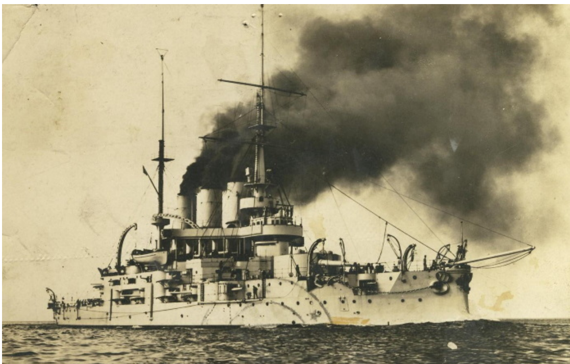
Эскадренного броненосца «Князь Потёмкин-Таврический»

История восстания на эскадренном броненосце «Потемкин», в «классическом» изложении многочисленных книг, публикаций и учебников в общих чертах выглядит следующим образом.