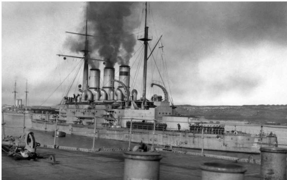
Эскадренного броненосца «Князь Потёмкин-Таврический»

Разумеется, служба в российском императорском флоте никогда раем не была. Как и на каждом флоте случалось всякое. Бывали и преступления, и несчастные случаи. Офицеры тоже были далеко не ангелами, могли и под суд отдать и по морде съездить. И хотя к началу XX века телесные наказания были уже далеко в прошлом, все же нерадивых матросов иногда били. Сказывалась и кастовость кадрового офицерства, которое было практически полностью дворянское и, в силу этого, не имевшее ничего общего с низшими социальными слоями. Все это так. Но доподлинно известно и то, что офицеры били матросов весьма редко, и это в самой офицерской среде рукоприкладство презиралось, а потому не было типичным. Если кто и бил матросов, так это сверхсрочники-кондуктора, да и то, сомневаюсь, что кто-то из них поднял бы руку на знающего свое дело старослужащего матроса. Если кондуктора и давали подзатыльники, то исключительно бестолковым новобранцам, чтобы учились шустрее. Но так было всегда, в том числе и в советское время. Командир отделения и по шее даст, и пожалеет, и на путь истинный наставит. Что касается «Потемкина», то, несмотря на все обвинения в адрес командования корабля, я нигде и никогда не встречал упоминания в воспоминаниях потемкинцев о конкретных случаях избияния матросов офицерами корабля. Ругали, это было. А слышали ли вы, как поносили нерадивых матросов на советских кораблях, да и на сегодняшних российских? Так что из-за этого всякий раз устраивать мятежи?