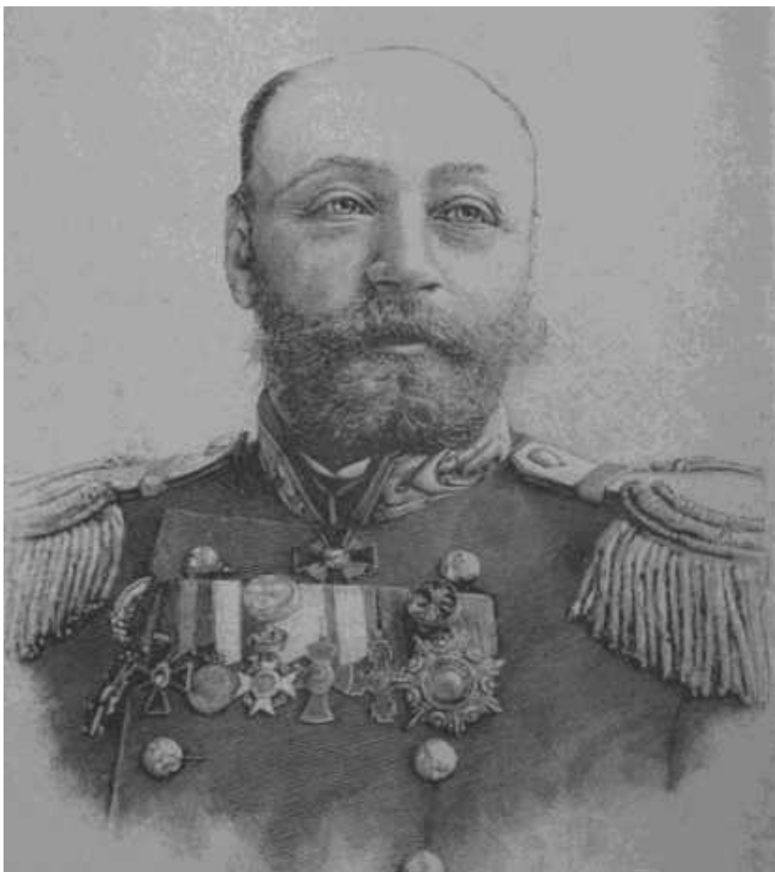
Александр Христианович Кригер

Накануне событий на «Потемкине» командующий Черноморским флотом вице-адмирала Г.П. Чухнин отбыл в Петербурге, куда на обсуждение новой судостроительной программы, оставив за себя старшего флагмана вицеадмирала Кригера. В числе последних распоряжений перед отъездом Чухнин отдал приказ командиру броненосца «Потемкин» выйти в отдельное плавание в Тендровский залив для выполнения артиллерийских стрельб главным калибром.