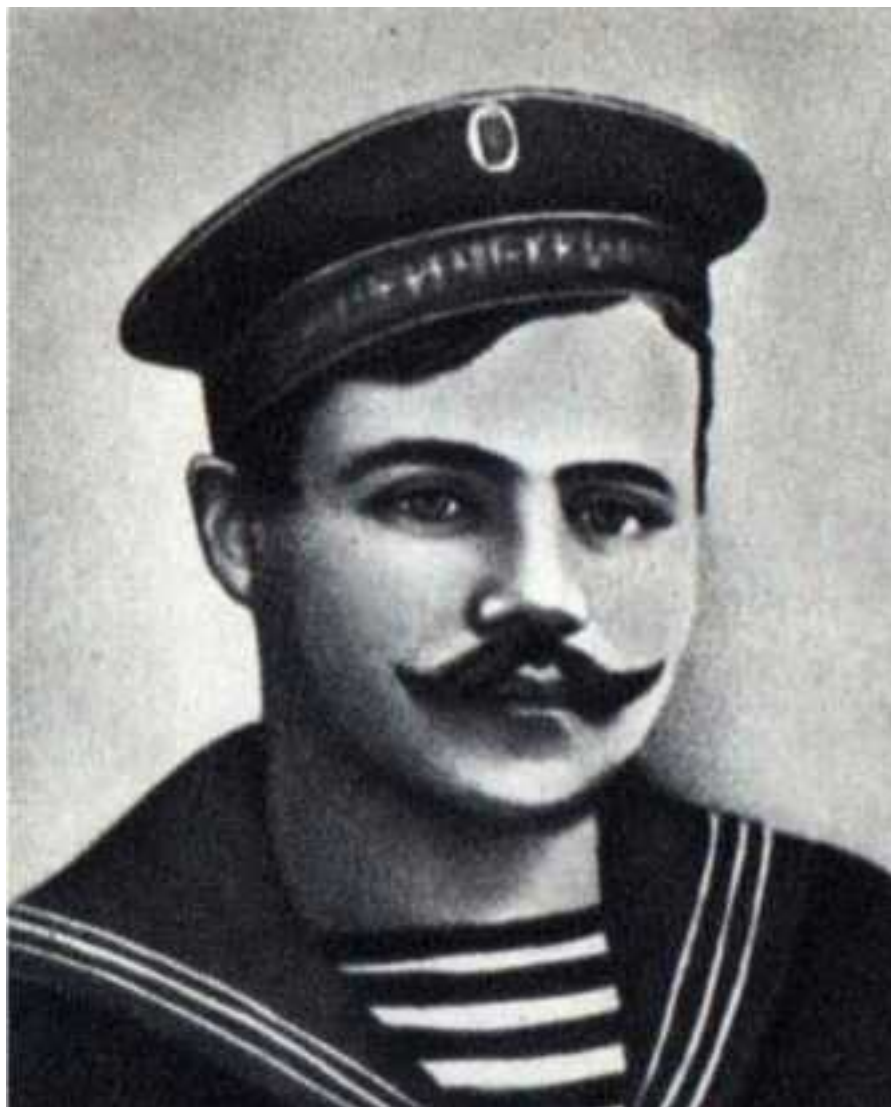
Григорий Никитич Вакуленчук

Значение восстания на "Потемкине" высоко оценил в ряде своих работ В.И. Ленин, как первое восстание против царского режима целой воинской части в полном составе. Именно В.И. Ленин и дал характеристику мятежному "Потемкину", как "непобежденной территории революции".