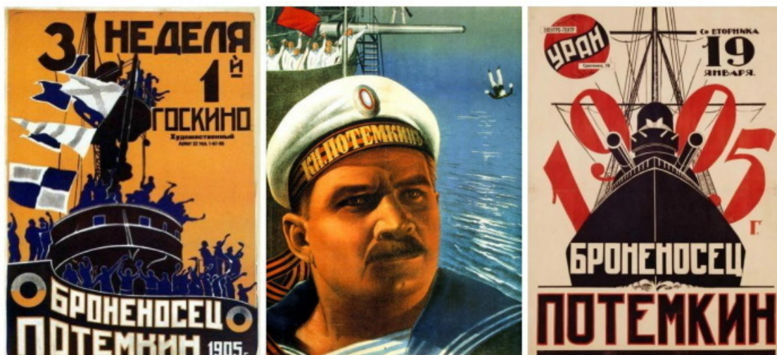
Афиши фильма «Броненосец Потёмкин»

Кто из нас не слышал о восстании на эскадренном броненосце Черноморского флота "Князь Потемкин – Таврический"! Кто не помнит знаменитый фильм Сергея Эйзенштейна, ставший не только классикой мирового кинематографа, но и гимном всем революциям мира. А потому совсем не случайно, что и само восстание на броненосце "Потемкин", с момента которого уже минуло сто лет, мы вольно или невольно, но воспринимаем именно через знаменитый фильм.