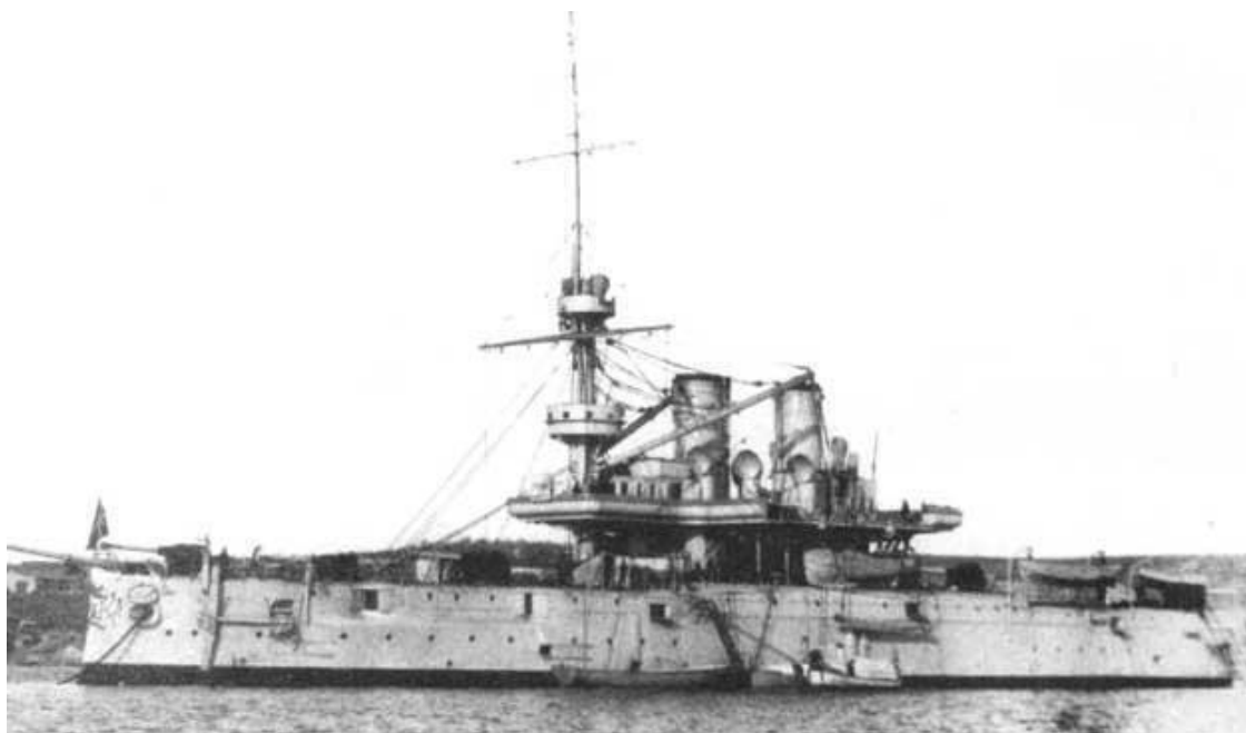
Броненосец «Георгий Победоносец»

Столетний ветеран, к этому времени уже почти не вставал с кровати и пользовался слуховым аппаратом, однако сохранил известную трезвость ума. Когда наши ребята подарили ему традиционную флотскую тельняшку, спели пару революционных песен и сплясали «яблочко» прямо в палате, растроганный старик начал нам рассказывать о восстании на "Потемкине".