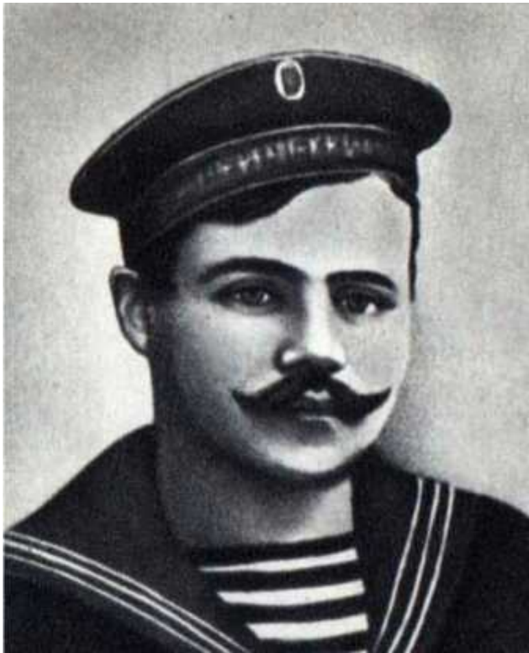
Григорий Никитич Вакуленчук