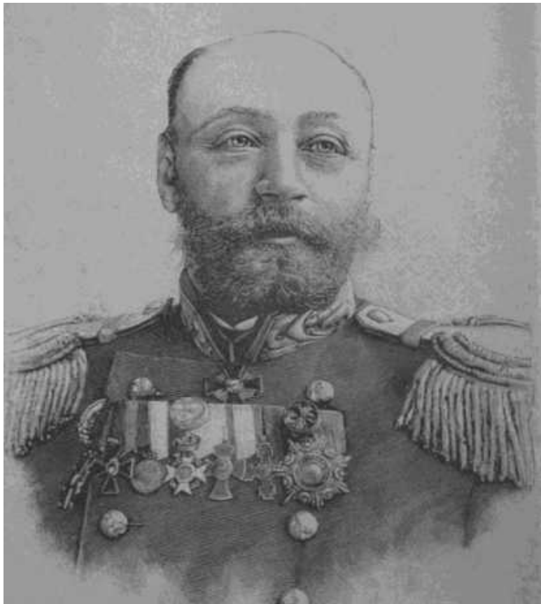
Александр Христианович Кригер

В воскресенье 12 июня 1905 года новейший эскадренный броненосец Черноморского флота «Князь Потемкин-Таври-