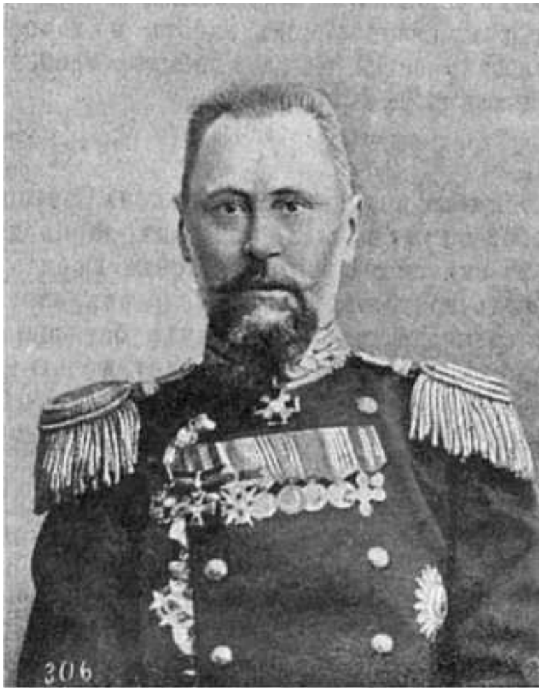
Командир эскадренного броненосца «Князь Потём-