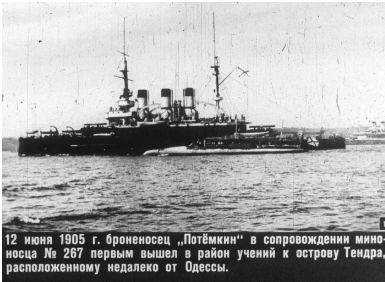
12 июня 1905 г. броненосец „Потёмкин“ в сопровождении миноносца № 267 первым вышел в район учений к острову Тендра, расположенному недалеко от Одессы.