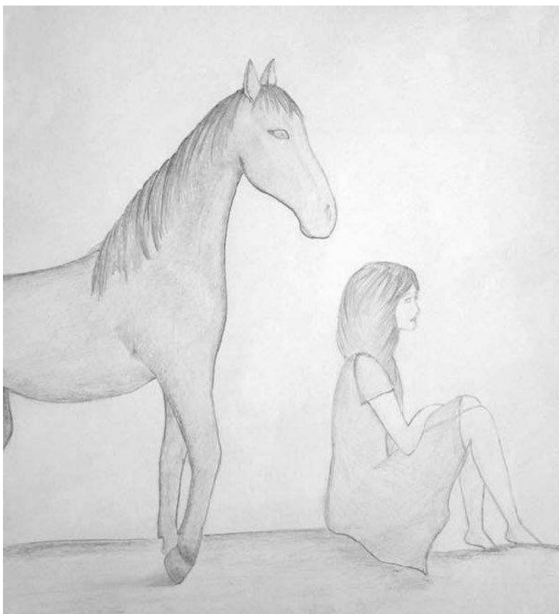
Рис. 1. «Нинель и Малышка»