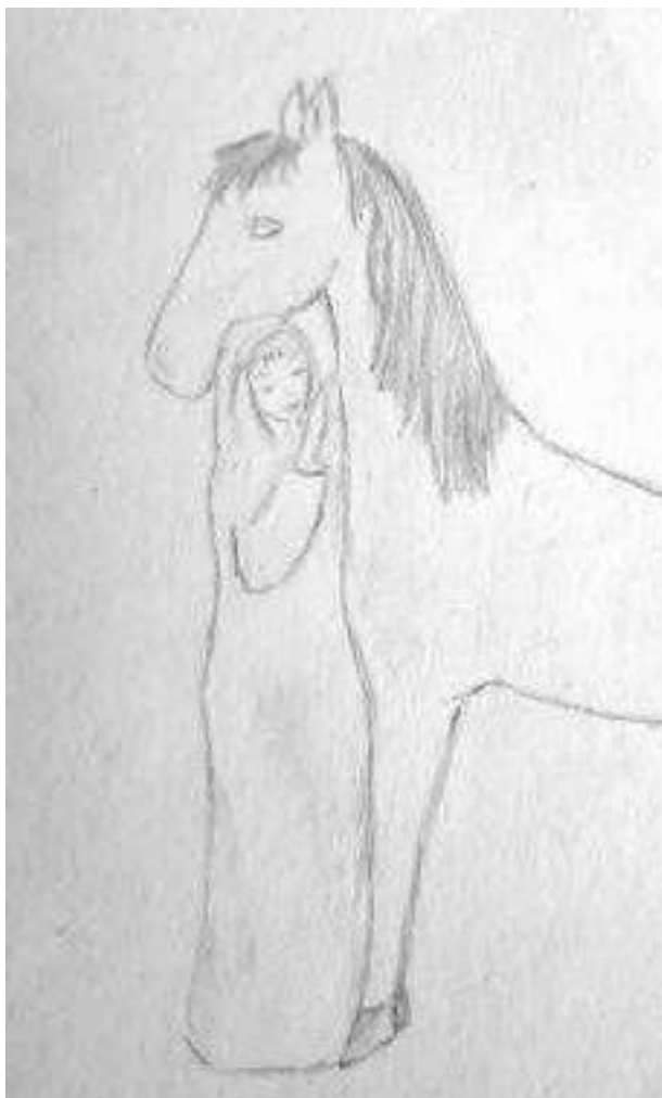
Рис. 3. «Малышка и Нинель»

Пробежав касанием руки вдоль лошади, Нинель сходу нашла нужный приступок, подвела к нему лошадь и легким скользящим движением уже привычно перебросила ногу на нее.