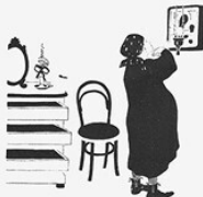
1. ДО РОЖДЕНИЯ. Еще до рождения Над тобой нависает молния Кресты, Голгофа.