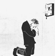
10. ГОРЕ. Горе у тебя казнь, Плачь перед иконой. Смиренье жизни осеняет.