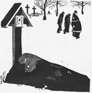
12. ПОСЛЕ СМЕРТИ. И над твоим могилкой другие в наказание Совершают магические заклинания. Вот клан чистая работа.