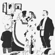
9. РАДОСТЬ. Случится у тебя радость, или веселье, Носовые ноздри Все со крестом, со попом, со молитвою.