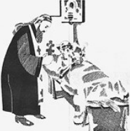
11. СМЕРТЬ. И умереть не даст словобой До конца — поп и монах До ручки зарабатывают.