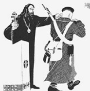
8. СЛУЖБА. И тут поп: «Ходи веселый, хохло!» За царя, за веру православную.