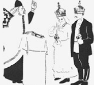
6. ВЕНЧАНИЕ. Тут тебе, как барону. Не мой корону Для герцога. И ты, мол, сам с усами.