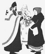
3. ПРИЧАСТИЕ. Без всякого твоего участия Получай, дьявольская душа, причастие. Качалось.