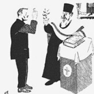
7. ПРИСЯГА. Чтоб не быть опасным баром, Присягай государю. Перед крестом и евангелием — для страха.