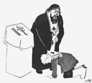
5. ИСПОВЕДЬ. Хван на исповедь, Приучился исповедать И такому смиренному.