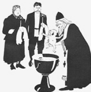
2. ИРЕШЕНИЕ. Только родился, а поп «дьявольскую душу» бук в кладушку Дьявола, начинаются.