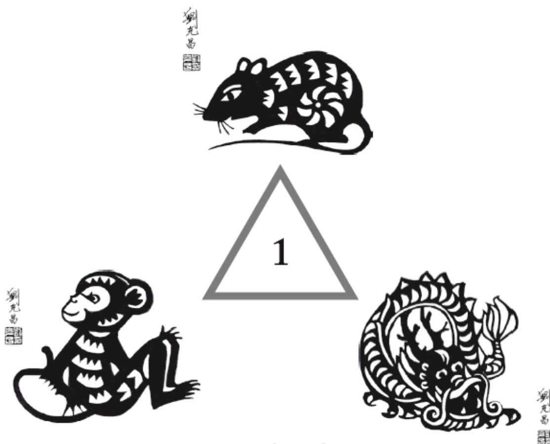
Треугольник родства для Крысы

Крыса входит в первый треугольник родства – группу позитивных людей, называемых деятелями . Крыса, Дракон и Обезьяна – это знаки, ориентированные на производительность и прогресс; они отличаются предприимчивостью и новаторством. Это самостоятельные первопроходцы, которые предпочитают инициировать действия, расчищать путь, устраняя неопределенность и колебания, двигаться вперед. Полные динамичной энергии и амбиций, они проявляют беспокойство и вспыльчивость, когда встречаются препятствия или вынуждены бездействовать. Это трио – плавильный котел идей. Из них получится хорошая команда: у них много общего в подходе к делам и в способе мышления.