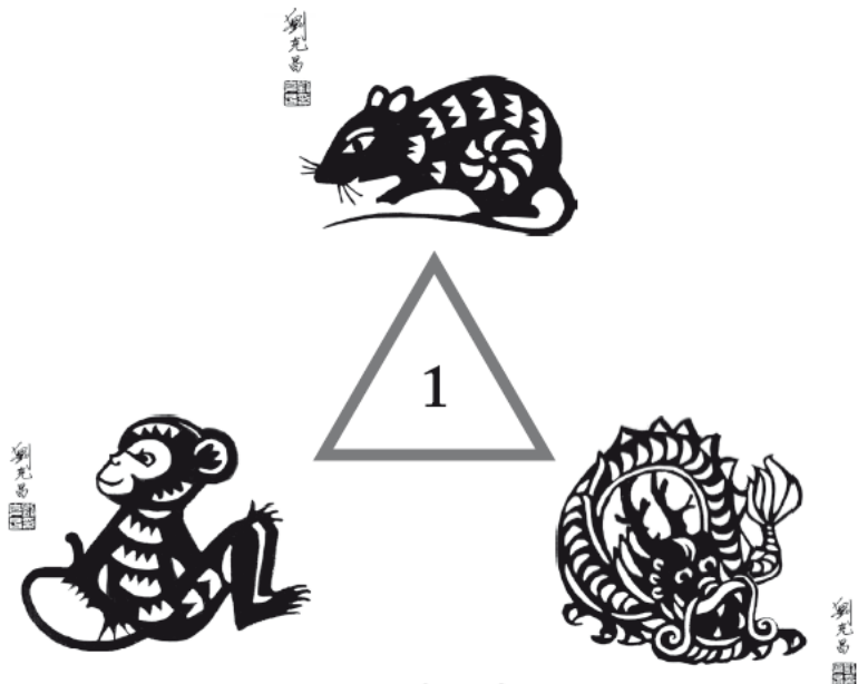
Треугольник родства для Крысы

Самые серьезные межличностные конфликты ожидают Крысу во взаимоотношениях с людьми знака Лошади – как по году рождения, так и по асценденту. В круге конфликта Крыса и Лошадь разнесены на 180 градусов и, таким образом, представляют собой полные противоположности. Направление Крысы указывает на север, а Лошади – на юг. Крыса олицетворяет зиму, Лошадь – лето. Фиксированный элемент Крысы – вода, а Лошади – огонь.