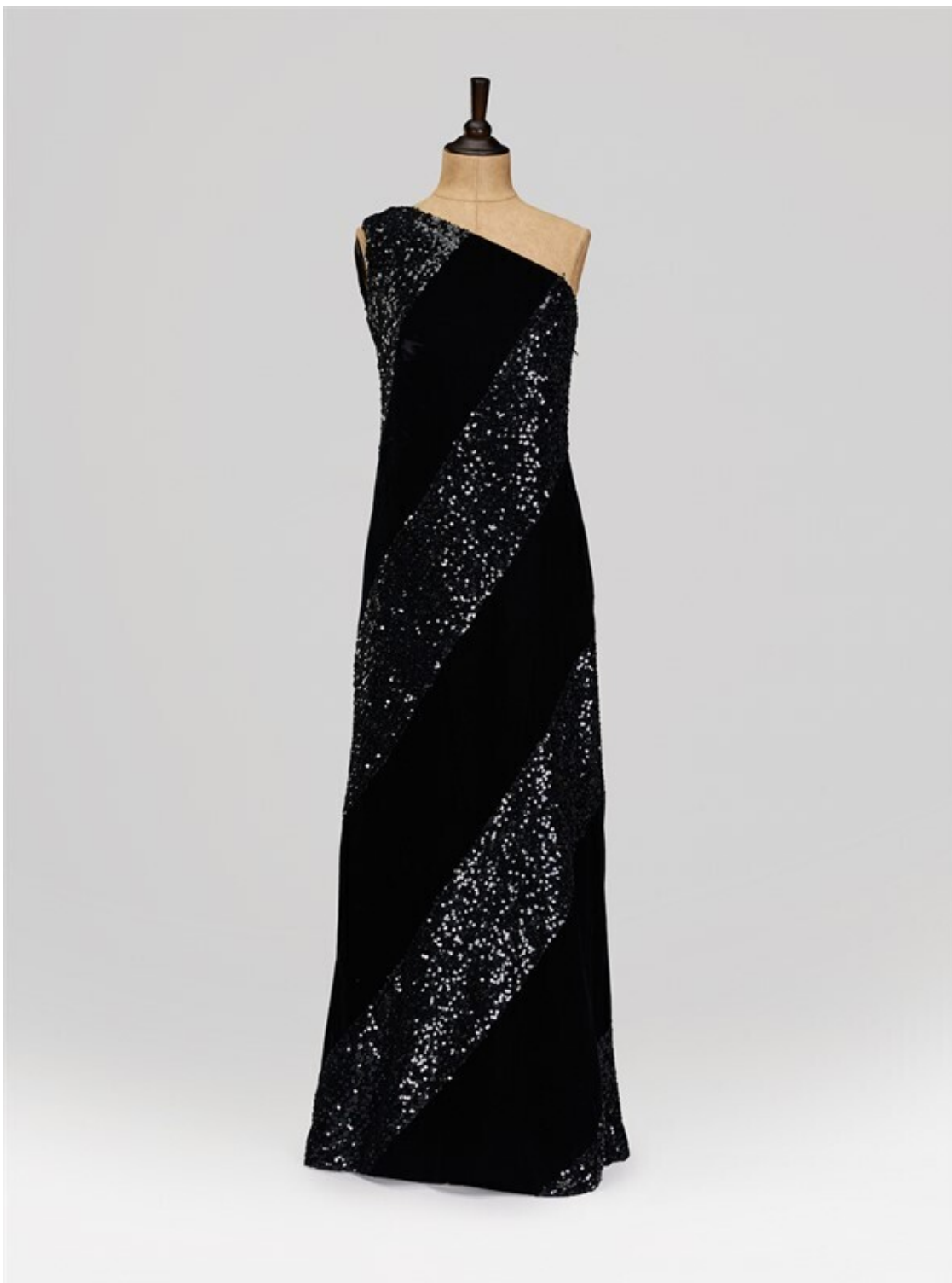
Вечернее платье Jacques Heim, 1969 год, Франция, из Фонда Александра Васильева

Засев на длительный карантин, люди наконец-то задумались: а для кого же мы одеваемся? Значит, все-таки не для себя, для других, для выхода в город? На что я отвечу так: это индивидуальный выбор каждого. Мне хватает тех двух пар брюк, двух пар обуви, свитера и