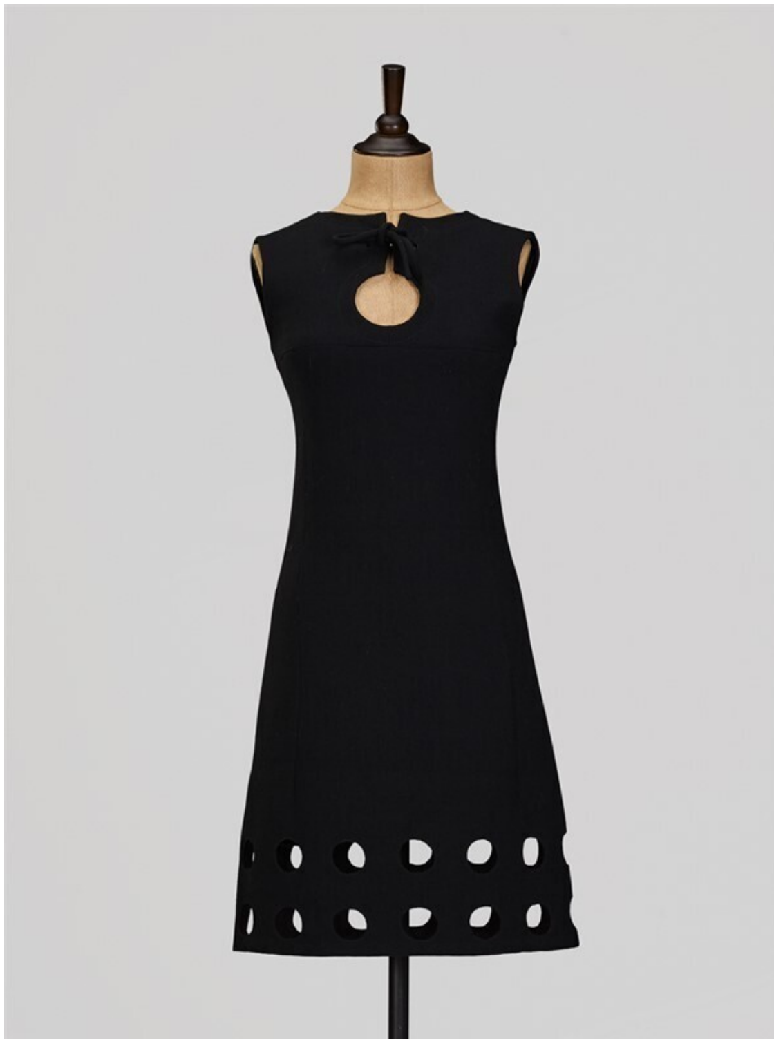
Платье Pierre Cardin, 1965 год, Франция, из Фонда Александра Васильева

К работе над этой книгой я приступил в мае 2020 года в условиях мировой эпидемии нового, доселе неизвестного планете, вируса. Я только вернулся домой после лечения, в больнице мне поставили диагноз двусторонняя пневмония. Один из тестов дал положительный результат на COVID-19, четыре были отрицательными. Впрочем, это ничего не значит. После-