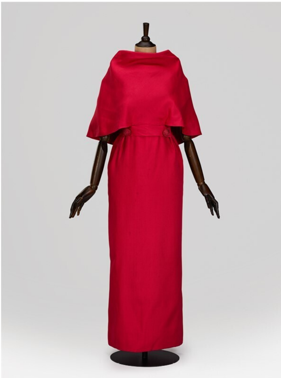
Вечернее платье Pierre Cardin, 1962 год, Франция, из Фонда Александра Васильева

Мода двух последних десятилетий была блестящей, яркой и гламурной. Но все переменится. Почему? Во-первых, потому что будущее всех массовых мероприятий совершенно неясно. Ведь шик, блеск, красоту неинтересно показывать самому себе в темном коридоре