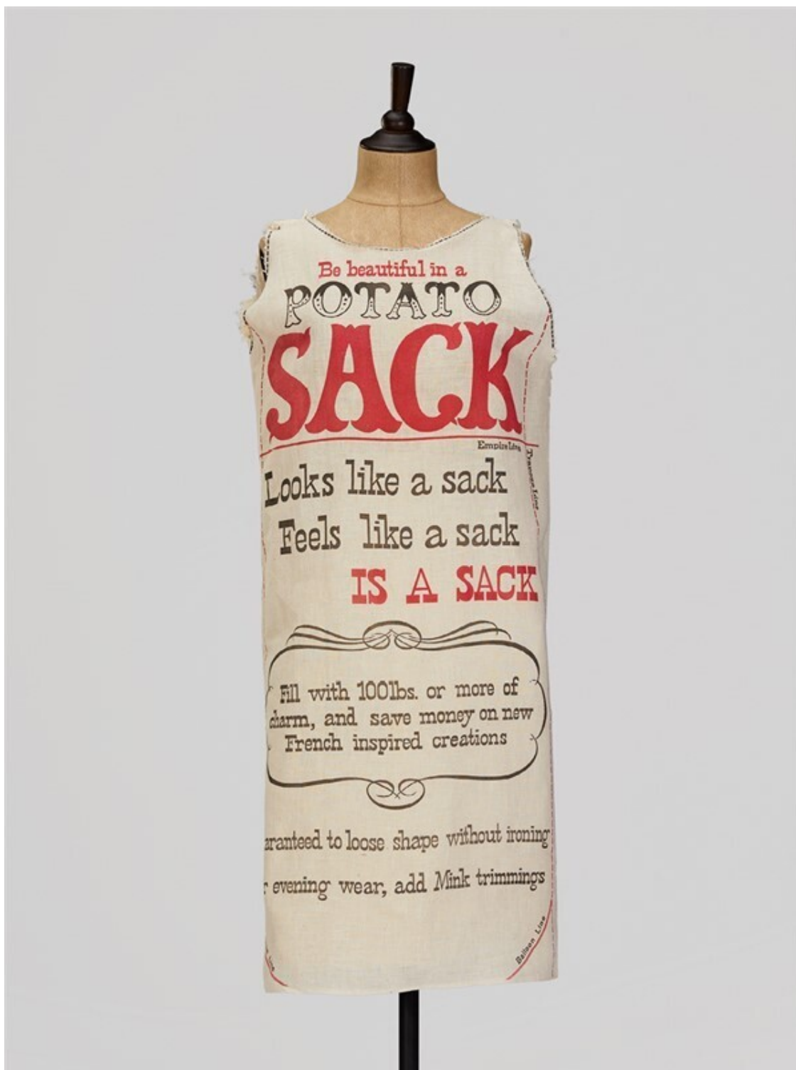
Платье «Мешок из-под картошки», 1965 год, США, из Фонда Александра Васильева

В последние двадцать лет мир охватила настоящая брендомания. Состоятельные покупатели из разных стран, в том числе России, Казахстана, Украины, Японии, Китая и Кореи, сломя голову гонялись за одеждой самых известных домов моды. В нашей стране это началось