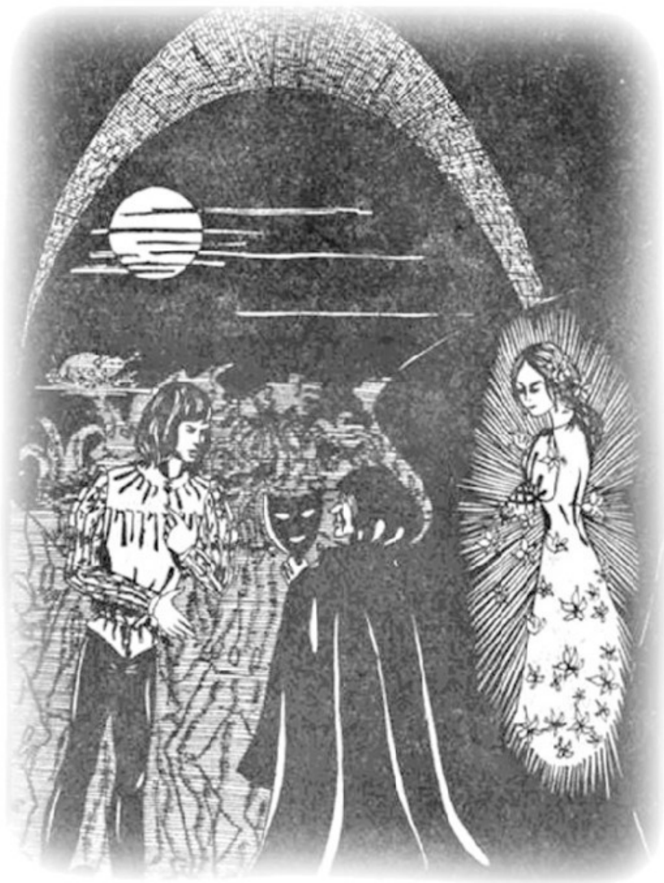
Рис. Н. Уляшиной