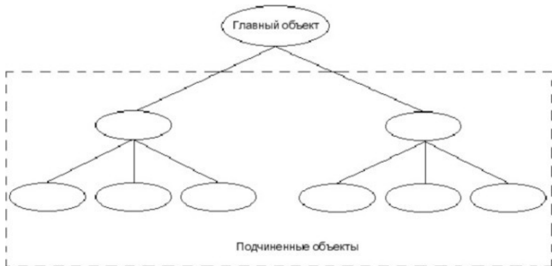
Рис. 18.1. Схема базы данных иерархического типа

Иерархическая модель организована в виде дерева с главными и подчиненными объектами. Смотри Рисунок 2 [1]. Примером иерархической СУБД является Information Management System (IMS) фирмы IBM.