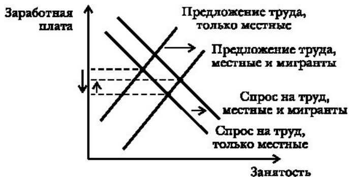
РИС. 2.2. И снова «экономическая теория на салфетке». Почему рост миграции не всегда ведет к падению уровня заработной платы

чие места – преимущественно для работников с низкой квалификацией. Как показано на рис. 2.2, сдвиг кривой спроса на труд ведет к росту заработной платы и, возможно, таким образом компенсирует сдвиг кривой предложения труда, оставляя уровень заработной платы и безработицы без изменений.