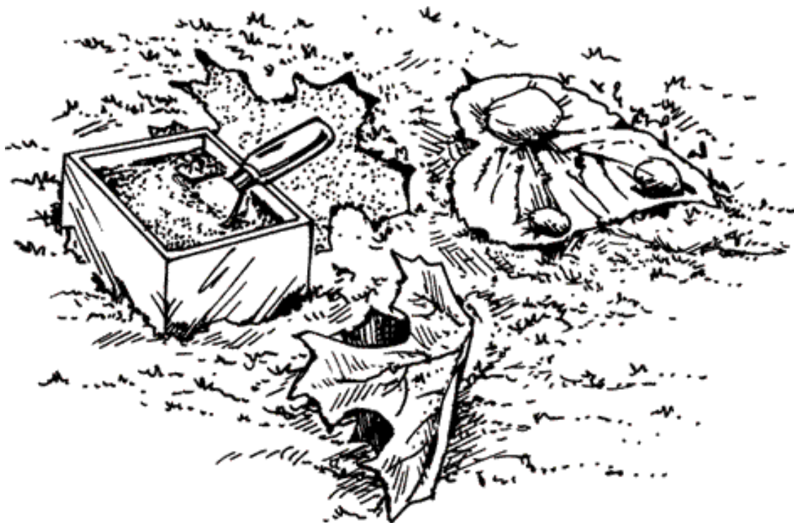
Рисунок 6. «Печать» листьев

Из чего только не делают дорожки садоводы с фантазией! Даже из подручного материала можно создать уникальный декор – например, садовую дорожку из пластиковых бутылок. Для этого бутылку обрезают наполовину и вкапывают дном вверх в землю на уровне поверхности земли.