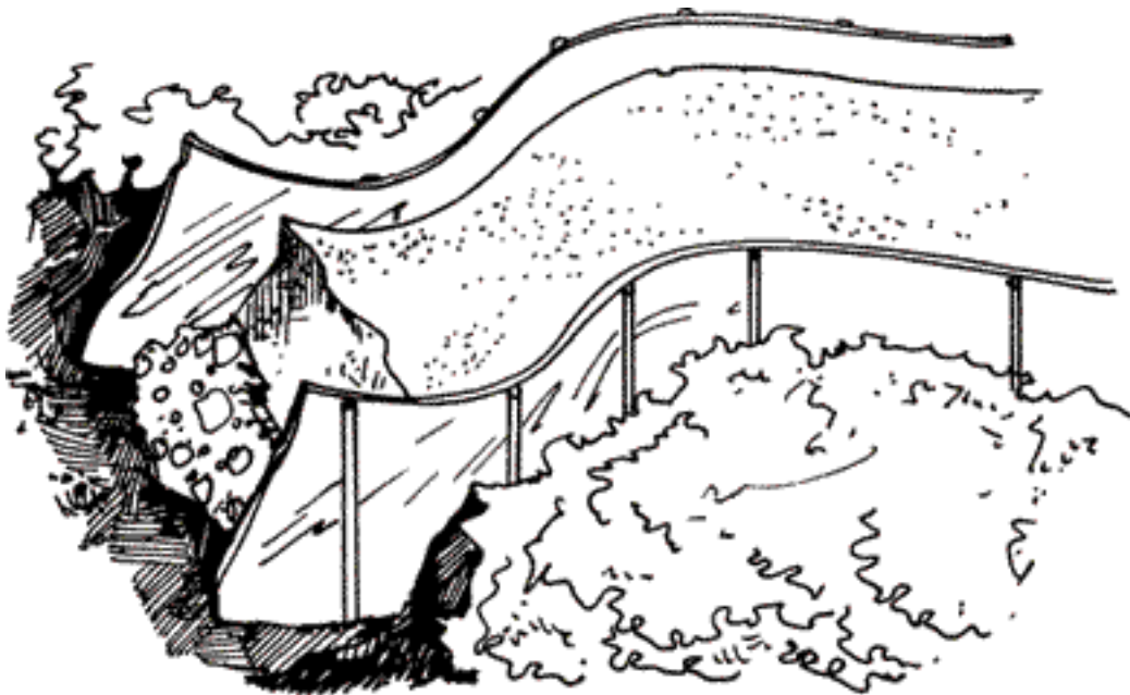
Рисунок 3. Металлическая опалубка

Вместо деревянной опалубки можно соорудить металлическую. Она состоит из пластин с присоединенными к ним кольщиками. Такие пластины гибкие и хорошо держат форму, они могут использоваться не только для создания изгибов дорожки, но и для сооружения прямых участков. Опалубку удаляют сразу после того, как затвердеет бетон (рис. 3).