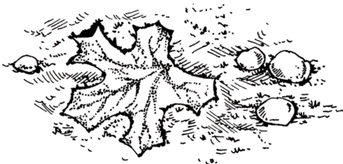
Рисунок 7. Отпечаток листа

После этого нужно дать бетонной смеси высохнуть, но следить за тем, чтобы бетон не высыхал слишком быстро, иначе он потрескается. Если стоит сухая и жаркая погода, пространство вокруг листьев надо время от времени поливать водой. Через 2–3 дня листья растений можно убрать (рис. 7).