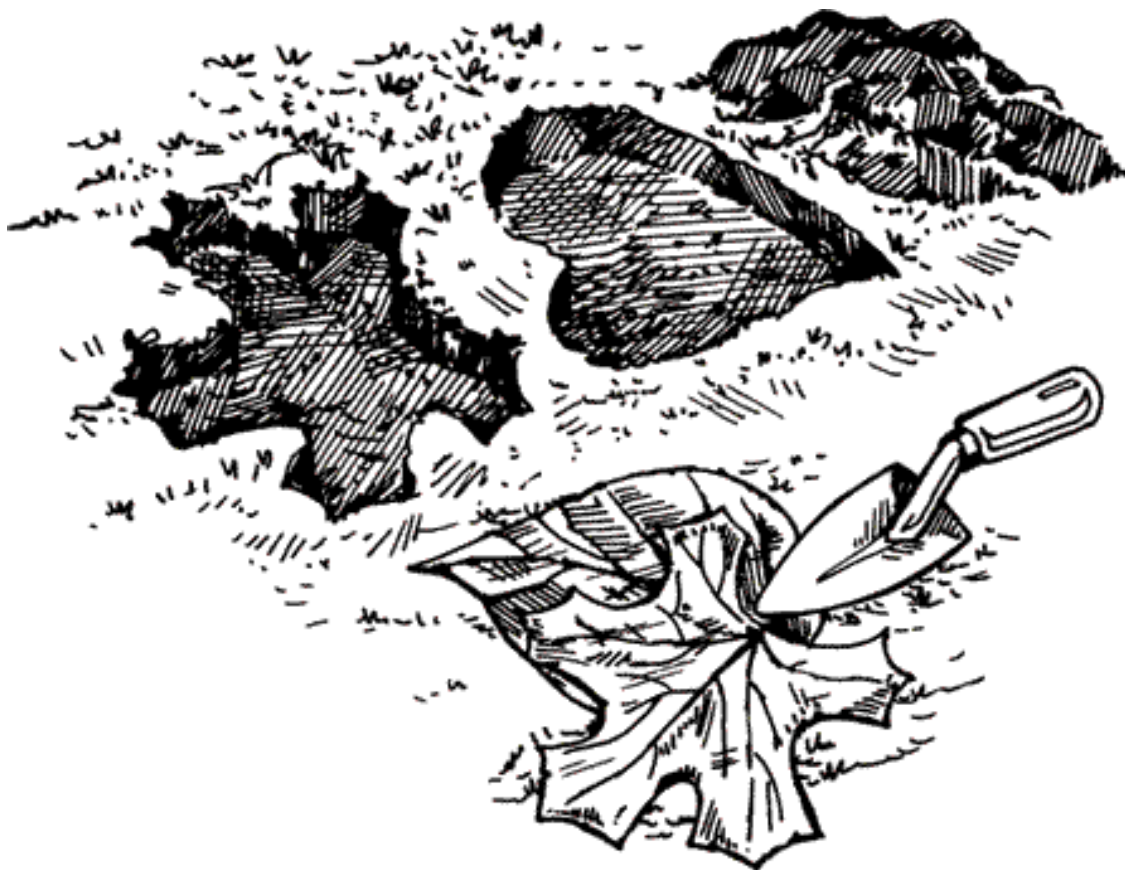
Рисунок 5. Подготовка поверхности почвы

Далее выложить в подготовленные углубления при помощи шпателя бетонную смесь, после чего к ней надо аккуратно приложить лист растения рельефной стороной вниз. Необходимо выбирать листья, несколько большие по размеру, чем подготовленные углубления. Для того чтобы узор прожилок лучше отпечатался на бетоне, можно поверх листьев положить какой-либо груз – например, камень или кирпич. Делать это нужно осторожно, так как груз может оставить отпечаток на еще не застывшем бетоне (рис. 6).