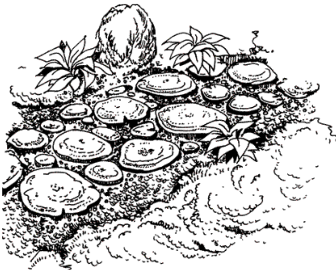
Рисунок 1. Деревянная дорожка

Часто встречаются на садовых участках и деревянные дорожки . Как правило, они сооружаются из стволов старых спиленных деревьев. Сначала для сооружения такой дорожки следует подготовить основу: выкопать канаву глубиной 20 см, насыпать в нее слой смеси гравия и песка толщиной 5 см, а затем выровнять его. После этого поверх подготовленной основы можно укладывать поперечные спилы стволов. Спилы должны иметь толщину примерно 15 см (рис. 1). Поверхность спилов нужно обработать наждачной бумагой с крупным зернением, затем уложить их на подготовленное основание. Спилы вдавливают в смесь песка и гравия, а пространство между ними засыпают этой же смесью до верха спилов, а затем выравнивают при помощи веника. Если некоторые спилы выступают, то нужно кувалдой заглубить их.