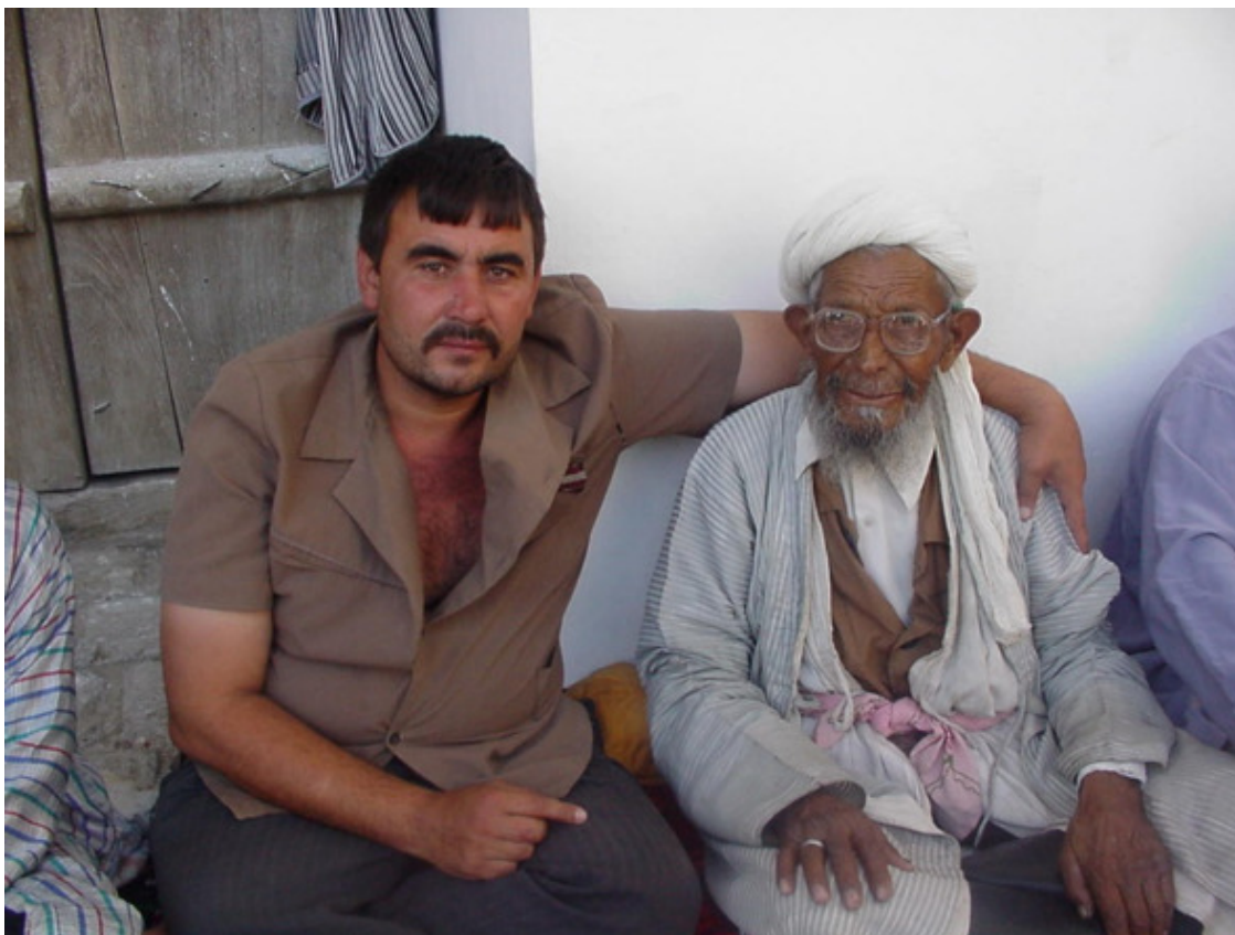
Среднеазиатские зарисовки.

Феруз – двадцатилетний парнишка из Узбекистана, приехал на заработки в Россию. Русского языка почти совсем не знает. В семи комнатной коммунальной квартире ютятся 57 земляков – гастарбайтеров. Словом, обычная картина.