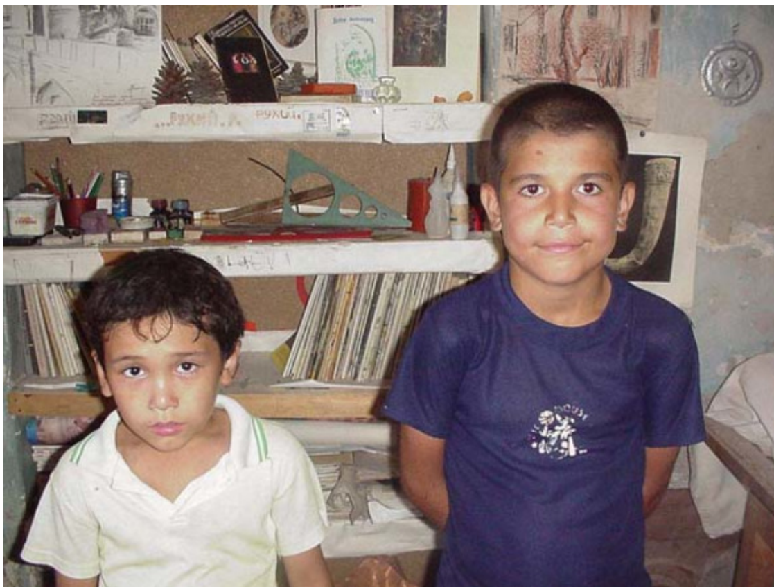
Среднеазиатские зарисовки.