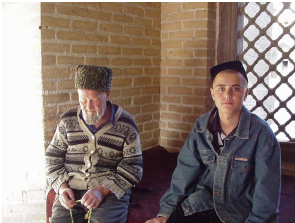
Среднеазиатские зарисовка.

Умед работал на вещевом рынке: таскал огромные тюки и баулы с нехитрым товаром.