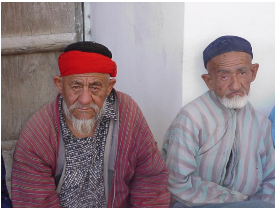
Среднеазиатские зарисовки.

– Говорите по-русски! – всякий раз возмущается Надя (моя коллега по цеху), застав меня за очередной беседой с земляками-гастарбайтерами, которые составляют чуть ли не треть штата работников нашей столовой.