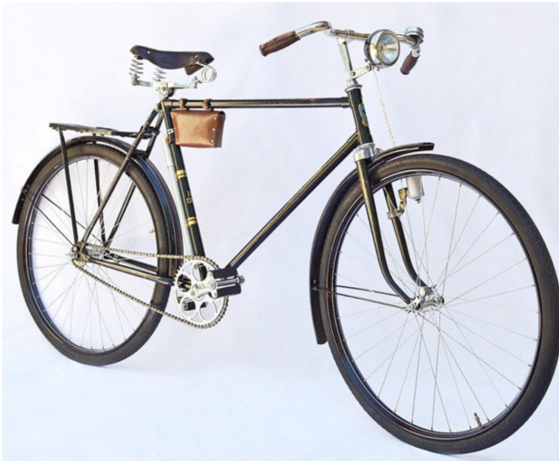
Велосипед советских времён.

Вероятно, у каждого из нас в детстве было заветное желание. Моей светлой и недостижимой мечтой был велосипед. Сначала – трёхколёсный, а чуть позже – в классе четвертом-пятом – настоящий, двухколёсный. Нет-нет, не «ПВЗ» 2 : тот был слишком «взрослым» для меня, да к тому же и чрезвычайно дорогим – пятьдесят два рубля. Об этом не могло быть и речи. Меня вполне устроил бы «Школьник» или – на худой конец – «Ласточка». Правда, последняя модель, считалась «дамской», ввиду отсутствия передней рамы, но с другой стороны, это даже было, скорее, её плюсом, поскольку избавляло нас – низкорослых юнцов – от мучительных попыток, запрокидывать ноги через высокую раму «взрослого» велосипеда. И по цене, второй тип «великов» был гораздо привлекательней – что-то, около 35 рублей. Однако и такая сумма, по тем временам, представлялась довольно внушительной для бюджета среднестатистической советской семьи.