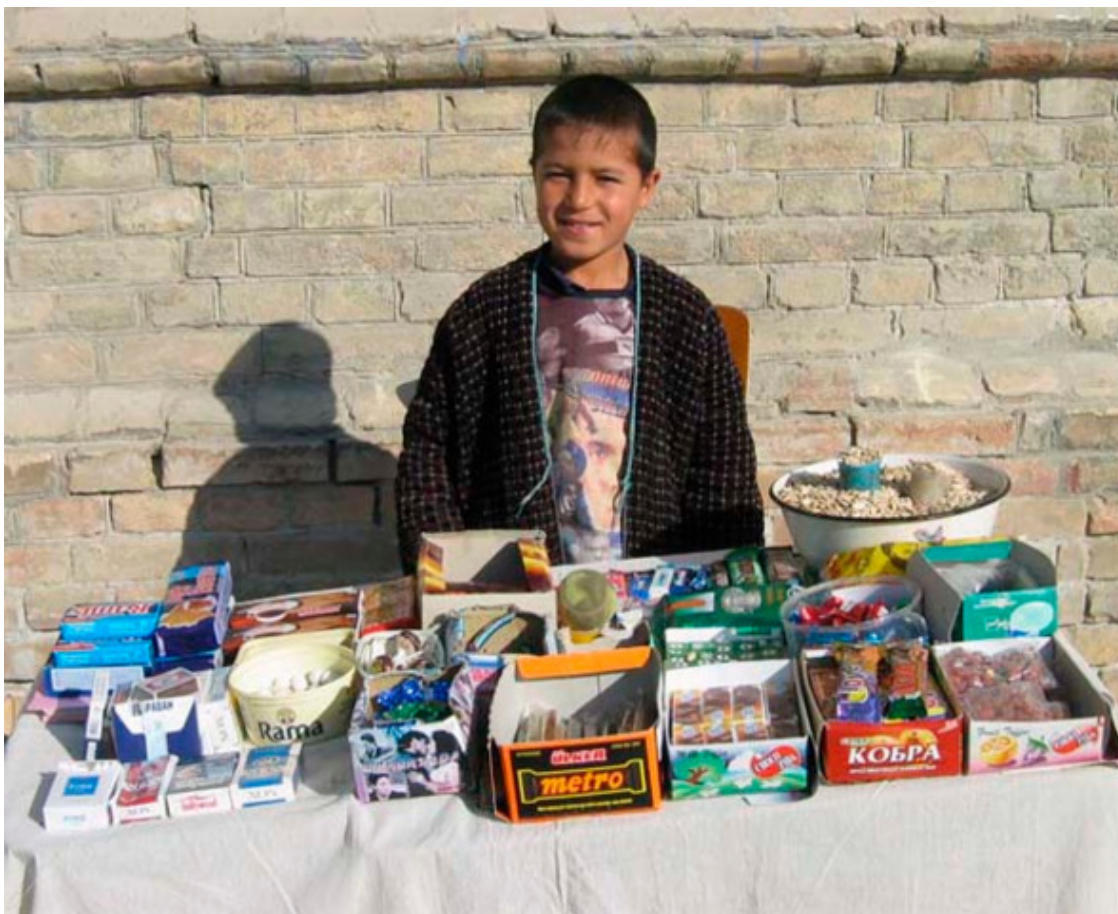
Среднеазиатские зарисовки.