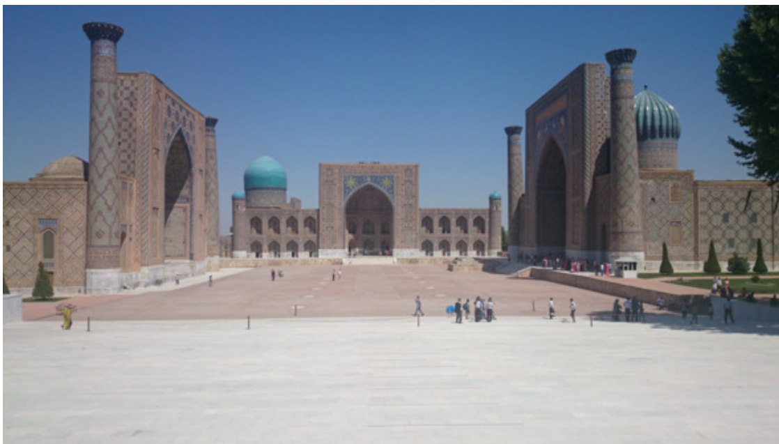
Самарканд, площадь Регистан. Фото автора, 2014 г