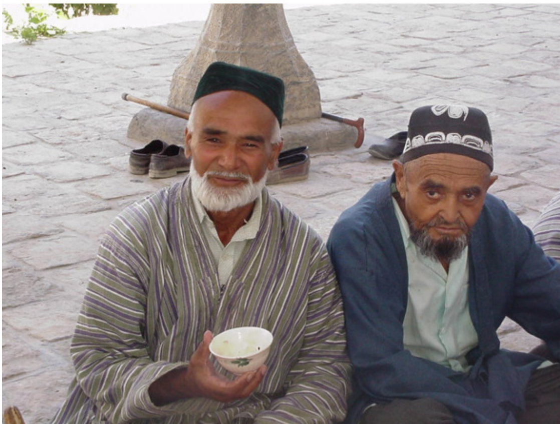
Среднеазиатские зарисовки.

Меня уже давно не удивляет тот факт, что чуть ли не половина штата пищеблока укомплектовано гастарбайтерами – выходцами из среднеазиатских республик. С трудом изъясняясь по-русски, они – тем не менее – за гроши готовы безропотно выполнять любую работу, за которую, кстати, не возьмется ни один нормальный россиянин. На что только не пойдешь от безысходности... Однако, пусть это останется на совести российского работодателя, алчного до денег.