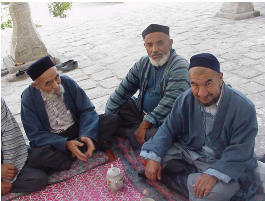
Среднеазиатские зарисовки.