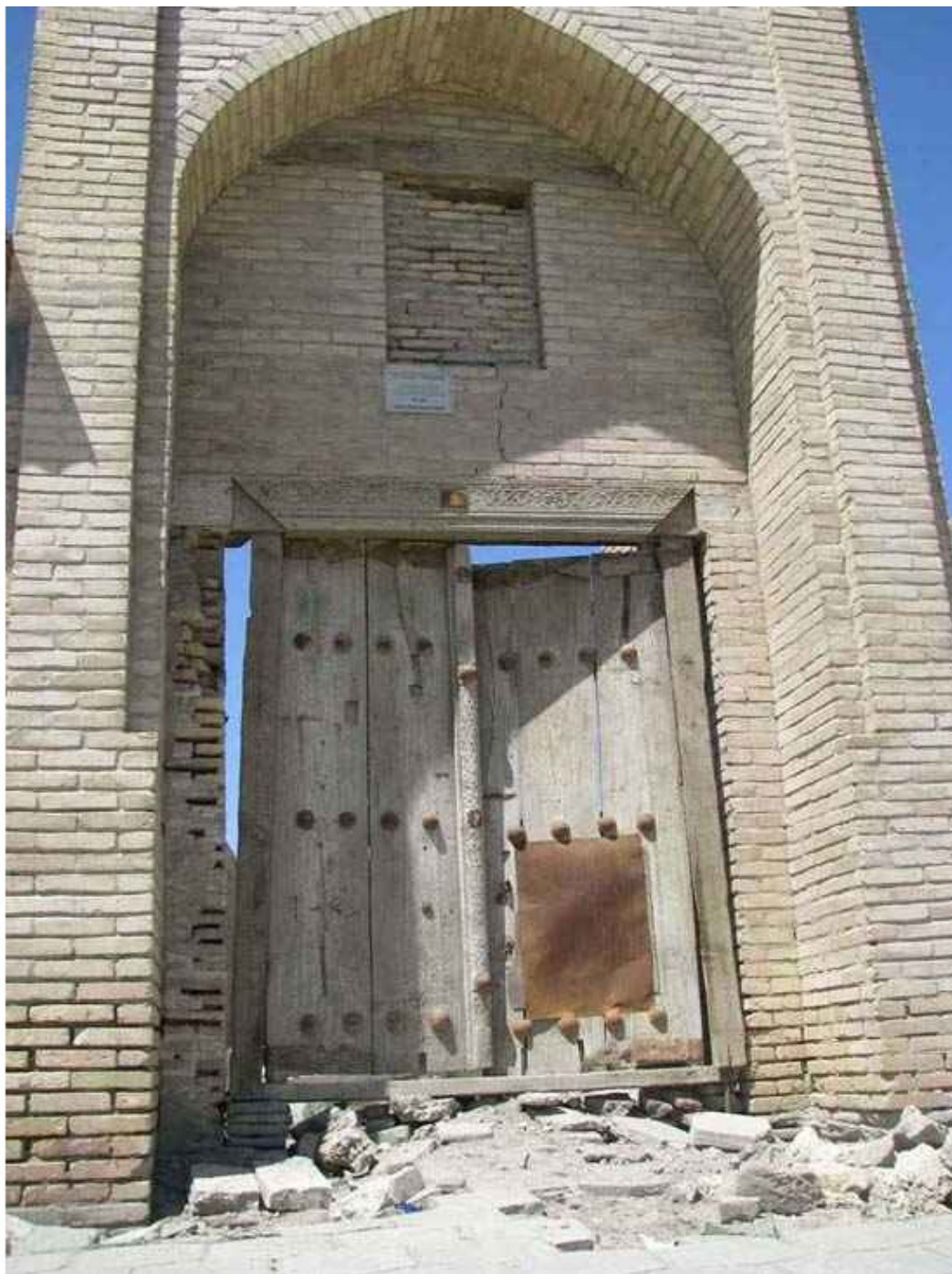
Врата в Историю...

Будучи, в очередной раз, в Бухаре, я находился в гостях у старшего брата, когда внезапно нашу беседу нарушил телефонный звонок. Звонил один из товарищей, который сообщил о том, что на днях скончалась тёща их общего знакомого.