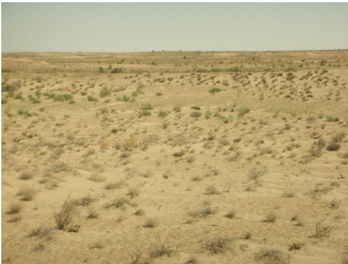
Плато Устюрт.

Взрыв лопнувшей камеры нарушил знойную тишину Устюрта, возвестив о нагрянувшей-таки беде.