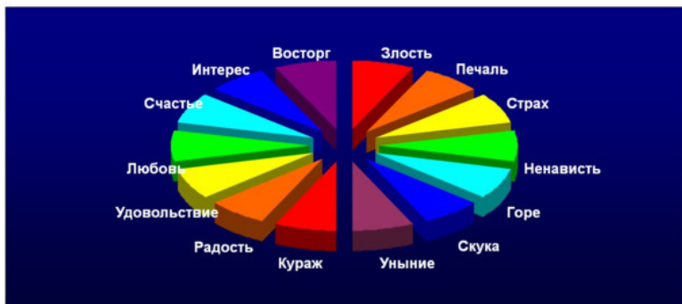
Диаграмма 1. Круг базовых эмоэнграмм по парам