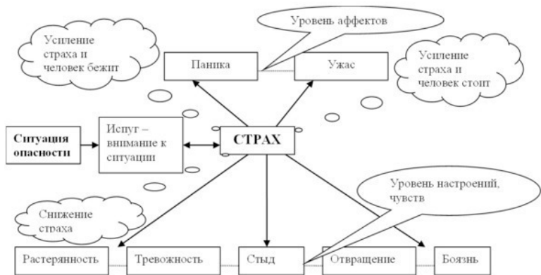
Диаграмма 2. Схема управления эмоцией страха