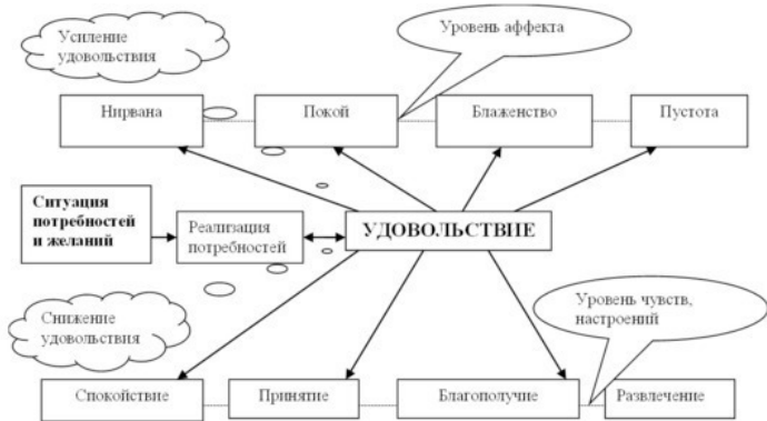
Диаграмма 3. Схема управления эмоцией удовольствия