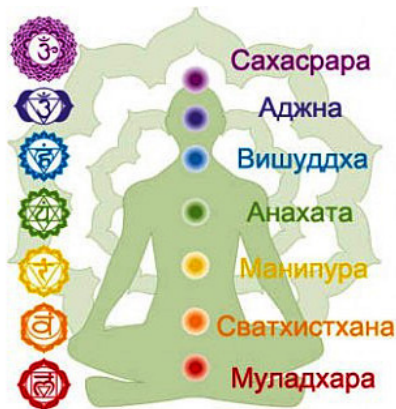
Рисунок 3. Строение Чакр на теле человека

При открытии всех нижних центров и восстановлении «самосборки» или всех сутей человека автоматически открывается Сахасрара чакра – тысяче лепестковый лотос, который находится в районе макушки головы, и человек получает прямой доступ к телу Сознания и к общему мировому потоку, к Сознанию Вселенной, Сознанию всего Мироздания.