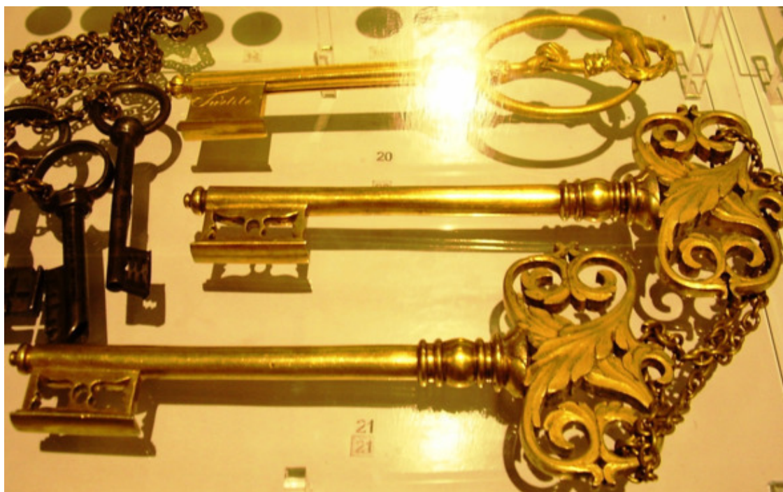
Трофейные ключи от крепостей Кёльн (20) и Данциг (21). ГИМ.

Когда же войски все прошли, были мы у молебна нашево при пушечной пальбе, потом были в их церкви. Обед был большой. За обедом мальчик говорил речь и венки поднёс. Вечеру город был освещён и был театр Титово милосердие с прологом на случай нашева вступления» 59 . Атаманский казачий полк из Оренбурга служил в нём до конца 1814 года, пока не был отпущен на родину. «За Данциг шеф полка (2-го Тептярского – авт.) А. Н. Струков 2-й получил высочайшее благоволение и орден Св. Анны 2 ст. Из числа 715 Знаков отличия Военного ордена «для поспешнейшего награждения участников осады Данцига по представлению е.к. высочества генерала от кавалерии герцога Александра Вюртембергского» полагалось на Оренбургский атаманский – 14, 2-й Тептярский – 4, 7-й Башкирский – 9» 60 .