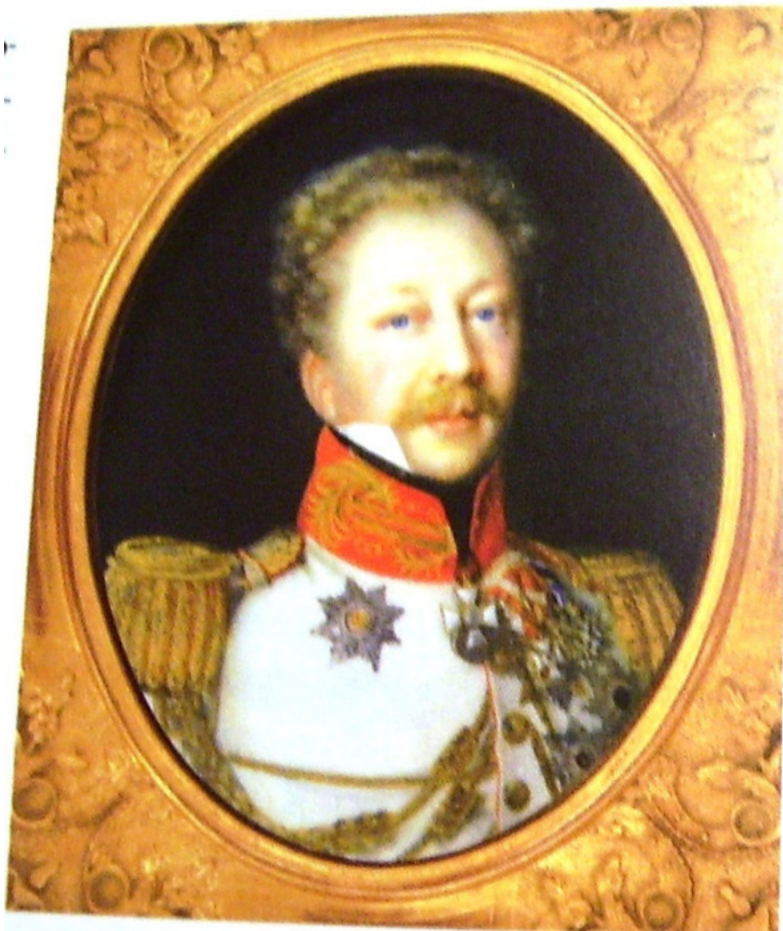
Теттенборн Ф. К. (1779—1845).

Барон Фридрих Карл Теттенборн (1778—1845) родился в г. Баден. Ещё будучи студентом Геттингенского университета поступил на австрийскую службу. Участвовал во всех войнах с Францией. Подполковник с 1809 г. 31 августа 1812 года принят на русскую службу тем же чином и направлен в летучий корпус Винценгероде под Москву. Участвовал в боевых действиях под Москвой, боях на Березине, при занятии Вильно. Награждён орденом Св. Георгия 4-й ст. и произведён в чин полковника русской армии. В 1813 году отличился при занятии Кёнигсберга, Берлина, при взятии и защите Гамбурга. В марте получил чин генерал-майора и орден Св. Георгия 3-й ст. В 1813—1814 гг. в составе Северной армии освобождал города на севере Германии, воевал в Дании. Со своим летучим отрядом вкуче с корпусом Винценгероде взял Бремен, участвовал во взятии Кёльна, сражался при Арси-сюр-Об и при Сен-Дизье. Награждён золотой саблей с алмазами. В 1815 г. участвовал в последнем походе во Францию.