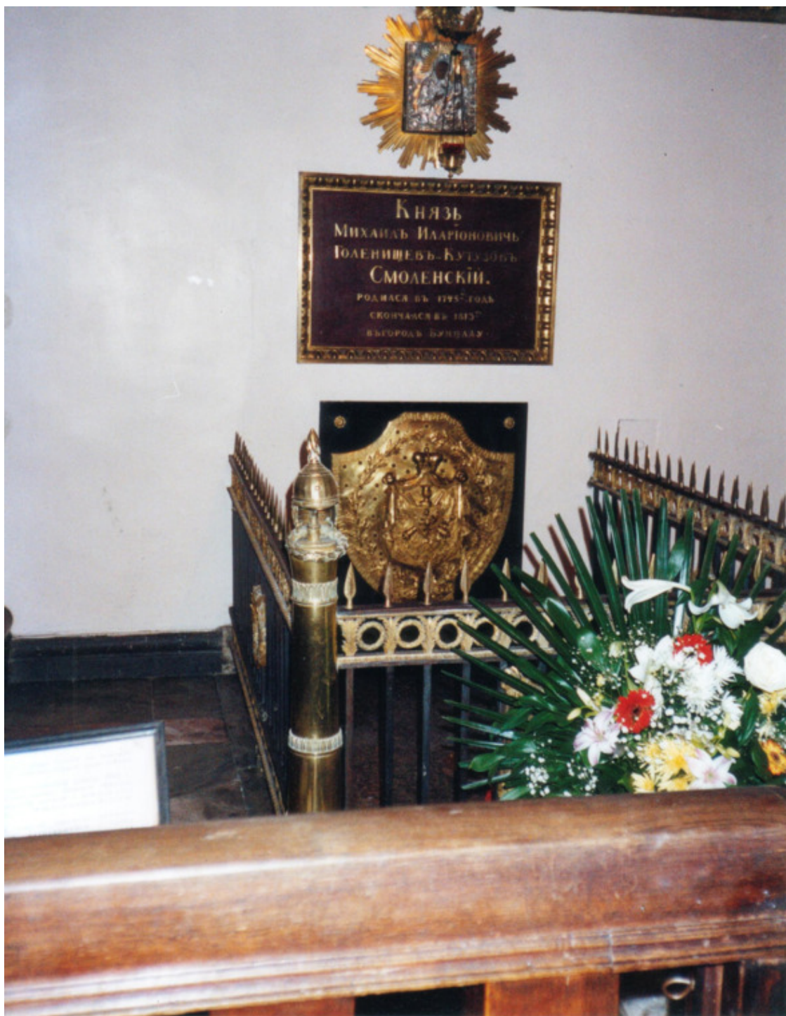
Могила Кутузова в Казанском соборе Санкт-Петербурга

Надгробие обнесено оградой темной бронзы, установленной в 1814 году (последняя работа Воронихина в соборе). К тому времени в соборе были собраны 115 трофейных знамен и штандартов, а также 94 ключа от городов и крепостей, взятых российскими войсками в ходе освобождения Европы. На украшение Казанского собора донские казаки пожертвовали 40 пудов серебра, отбитого у неприятеля. Из него в 1836 г. по проекту архитектора Тона К. А. был создан новый иконостас.