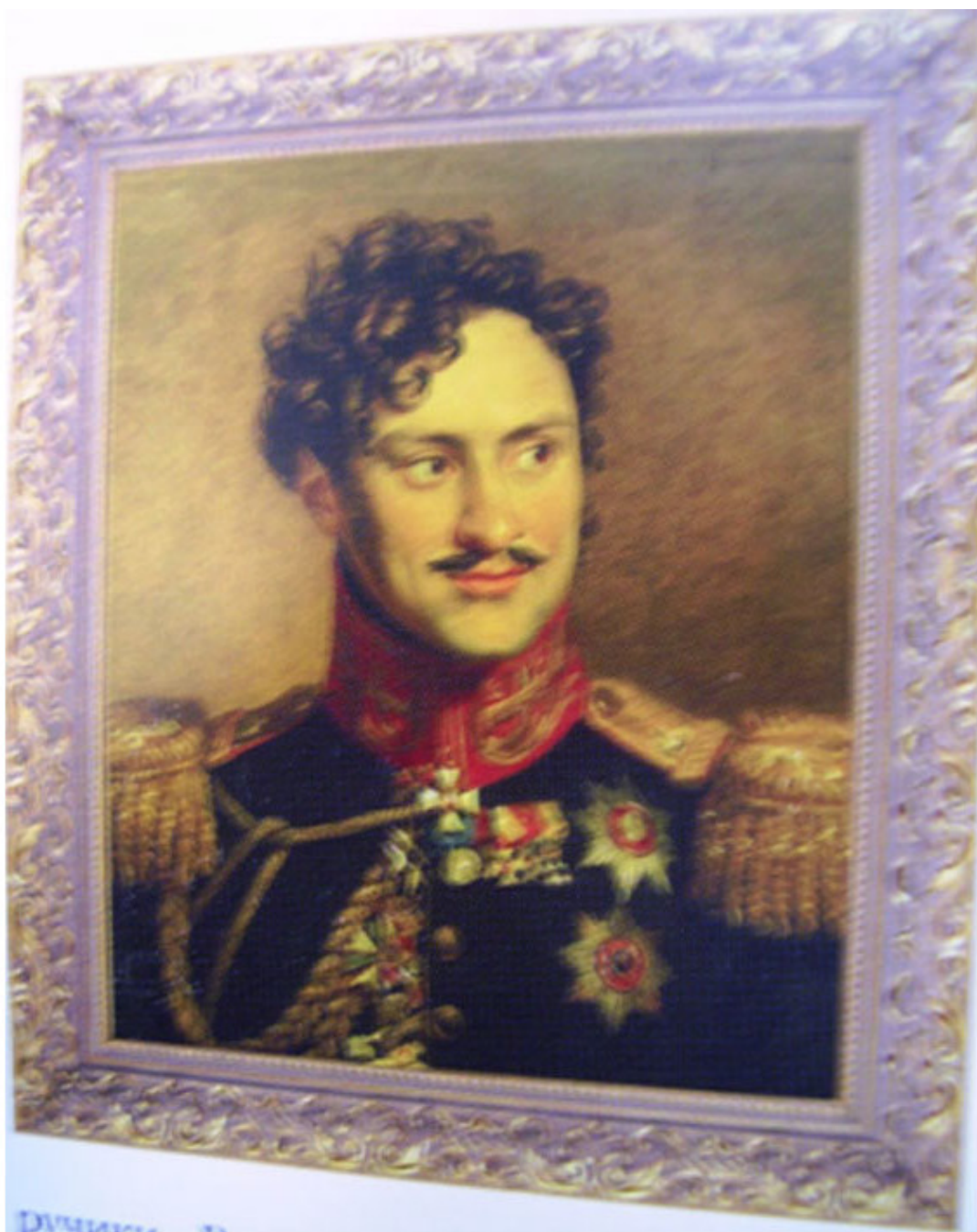
Чернышёв А. И. (1785—1857). Худ. Д. Доу. 1-я четв. 19 в.

30 января передовой отряд генерал – адъютанта Чернышева в 500 человек разбил на реке Варта под Цирке литовскую дивизию князя Р. Т. Гедройца, численностью также около 2 тыс. человек. При этом командир дивизии с большей частью своих солдат был взят в плен. Передовые отряды, тесня французов, заняли города Дризен и др. К 1 февраля был занят Позен и части вышли на линию реки Одер.