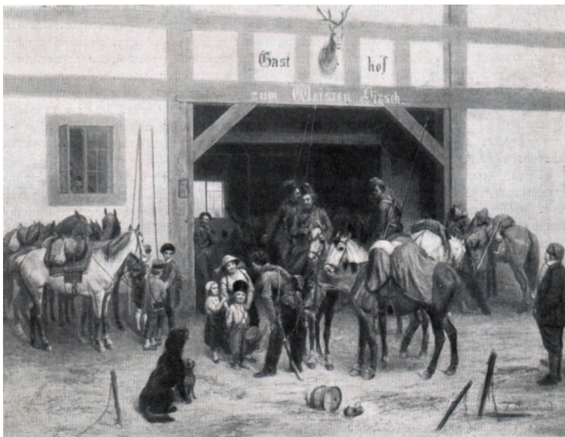
Казачи в Бауцене, в Саксонии в 1813 году. Худ. Виллевалде В. П. 1885 гг.

Наполеон тоже не терял времени даром и сосредоточил свою новую армию в 300 тыс. человек в Тюрингии в районе Эрфурта, планируя начать оттуда контрнаступление. Поэтому