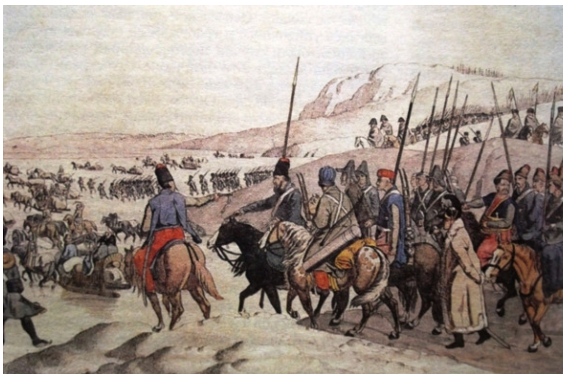
Переход через Вислу. Неизв. худ. 1-я четв. XIX в.

Заняв Кенигсберг, российские войска устремились к Висле.