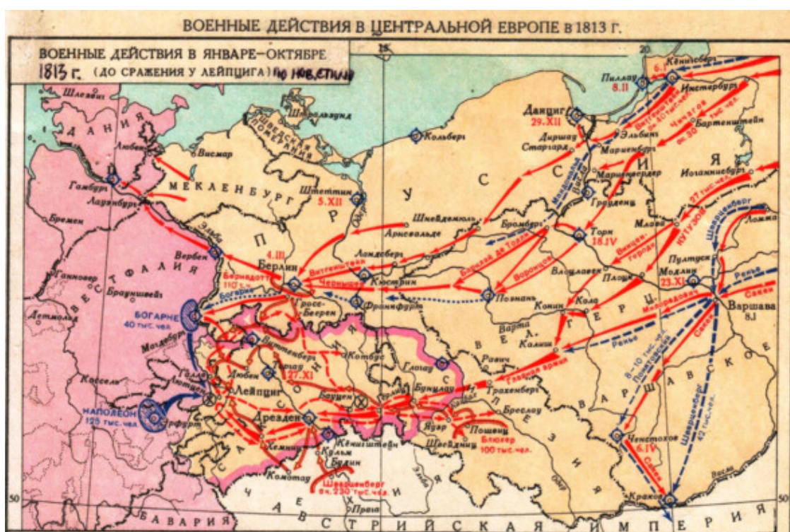
Карта военных действий в 1813 году. Всемирная история. М.: АН СССР, ИСЭЛ. 1959. Т.6.