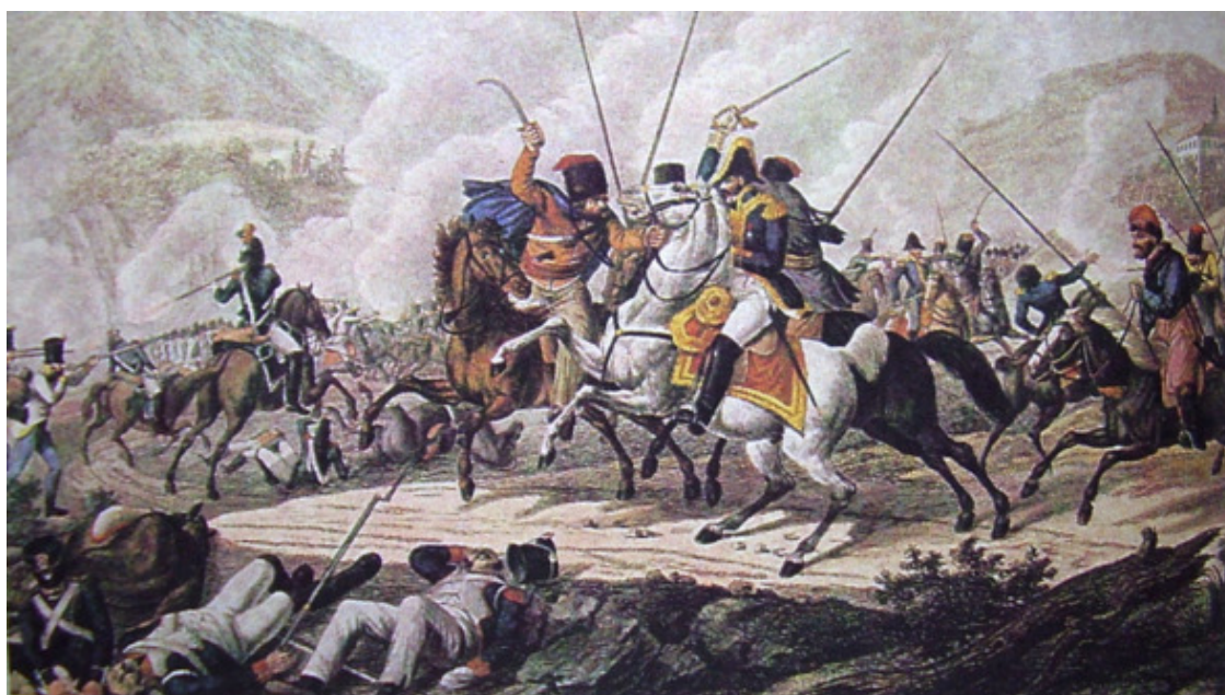
Пленение Вандама 30 августа 1813 г. Раскраш. грав. Раля по ориг. Клейна. 1-я четв. XIX в.

Но в 2-х дневном сражении под Кульмом 17—18 (29—30) августа французы потеряли до 5 тысяч только убитыми, 12 тыс. пленными, всю артиллерию (84 орудия), весь обоз, 2 знамени и 3 орла.