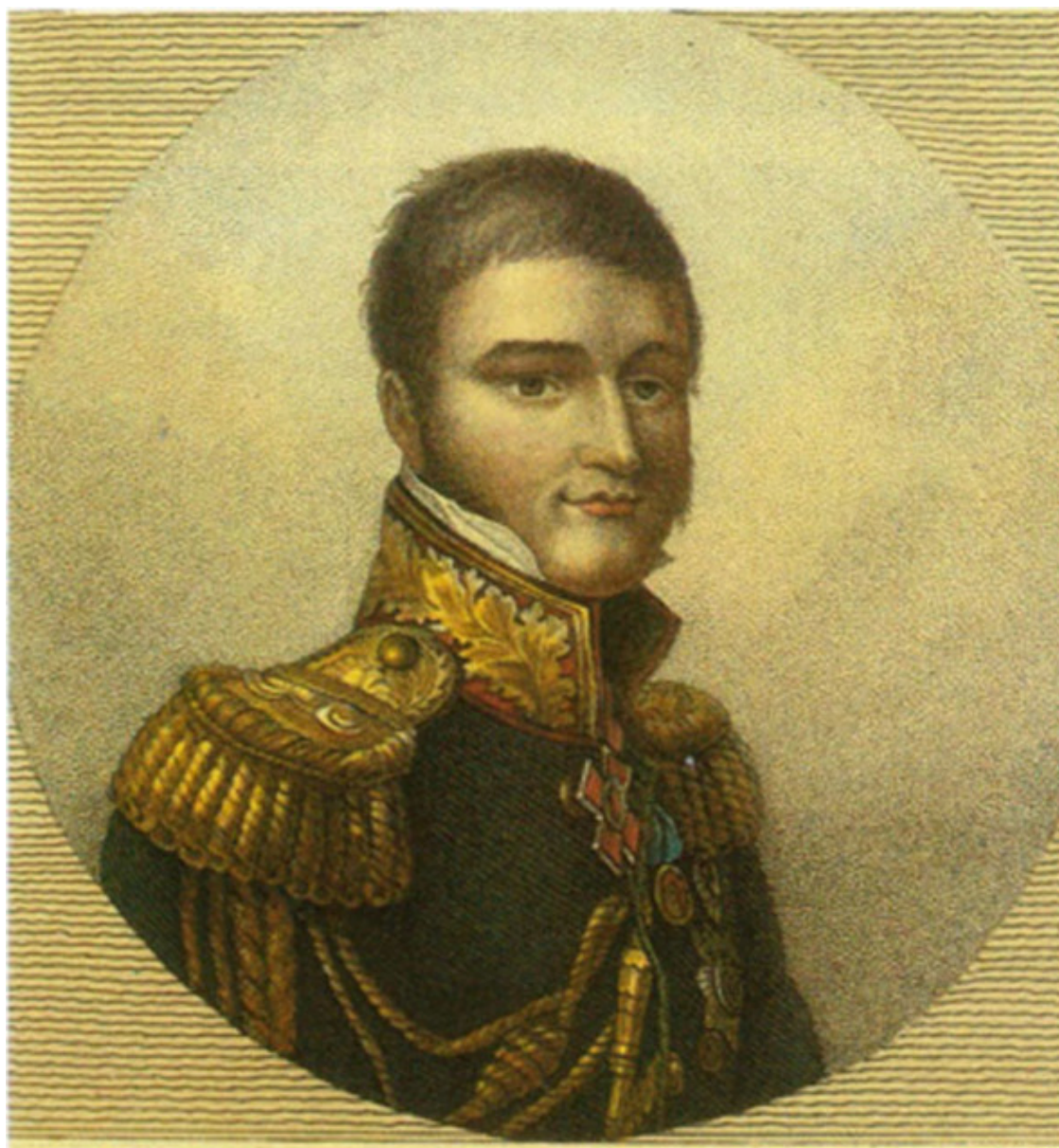
М. С. Воронцов (1782—1856). Раскраш. гравюра Г. Губерта. 1-я четв. 19 в.

Михаил Семёнович Воронцов, светлейший князь. В 1806 и 1807 гг. был в сражениях при Пултуске и Фридланде. В турецкую войну отличился при взятии Базарджика. Шеф Нарвского пехотного полка. Генерал-майор. В 1812 году – командир сводной гренадёрской дивизии в армии Багратиона. Один из героев Бородинского сражения, где был ранен. Из Москвы вместо фамильного имущества вывез сотни раненых и устроил в своём имении госпиталь. В 1813 г. отличился в битве при Лейпциге. В 1814 г. сражался при Краоне против самого Наполеона, награждён орденом Св. Георгия 2-й степени. Командир оккупационного корпуса во Франции в 1815 – 1818 гг. В 1823—1844 гг. – Новороссийский генерал-губернатор. В 1845—1855 гг. – главнокомандующий на Кавказе. Генерал-фельдмаршал.