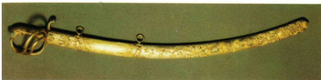
Сабля Чернышева А. И.

Тем не менее, отряды генерала Чернышева и полковника Тетенборна решили рискнуть и своими силами напасть на столицу Пруссии – город Берлин. Там находился корпус маршала Ожеро (родной брат пленённого в России генерала), насчитывавший до 6 тыс. человек с 40 орудиям. По другим данным, гарнизон Берлина насчитывал 18 тысяч человек. Оба отряда значительно уступали противнику в численности. Тем не менее, подойдя 9 (21) февраля к Берлину (еще до заключения союза с прусским государством), они в тот же день атаковали его. Казаки вихрем ворвались через Бранденбургские ворота и промчались по улицам столицы Пруссии, четыре раза врубаясь в скопления французских войск. Их смогло остановить только выстроенное на Александрплац каре с восемью пушками. Естественно, казаки без пехоты и артиллерии, не смогли удержать город, и вынуждены были организованно отступить, уведя с собой 18 офицеров и более 600 рядовых пленными. Убыль же собственных сил у них не превышала 150 человек убитыми и ранеными 29 .