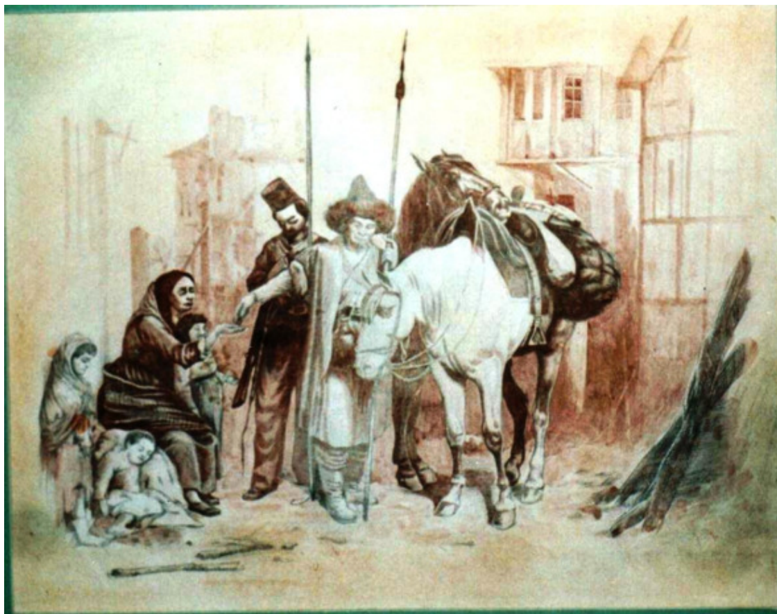
Башкиры в Гамбурге в 1813 году. Неизв. худ. 1-я четв. 19 в. Нацмузей РБ.

Через два дня подполковник Бенкендорф К. Х. с одним казачьим полком (!) занял Любек. 10 (22) марта партизанский отряд полковника Давыдова Д. В. овладел Дрезденом. 19 марта первые казаки вошли в Лейпциг.