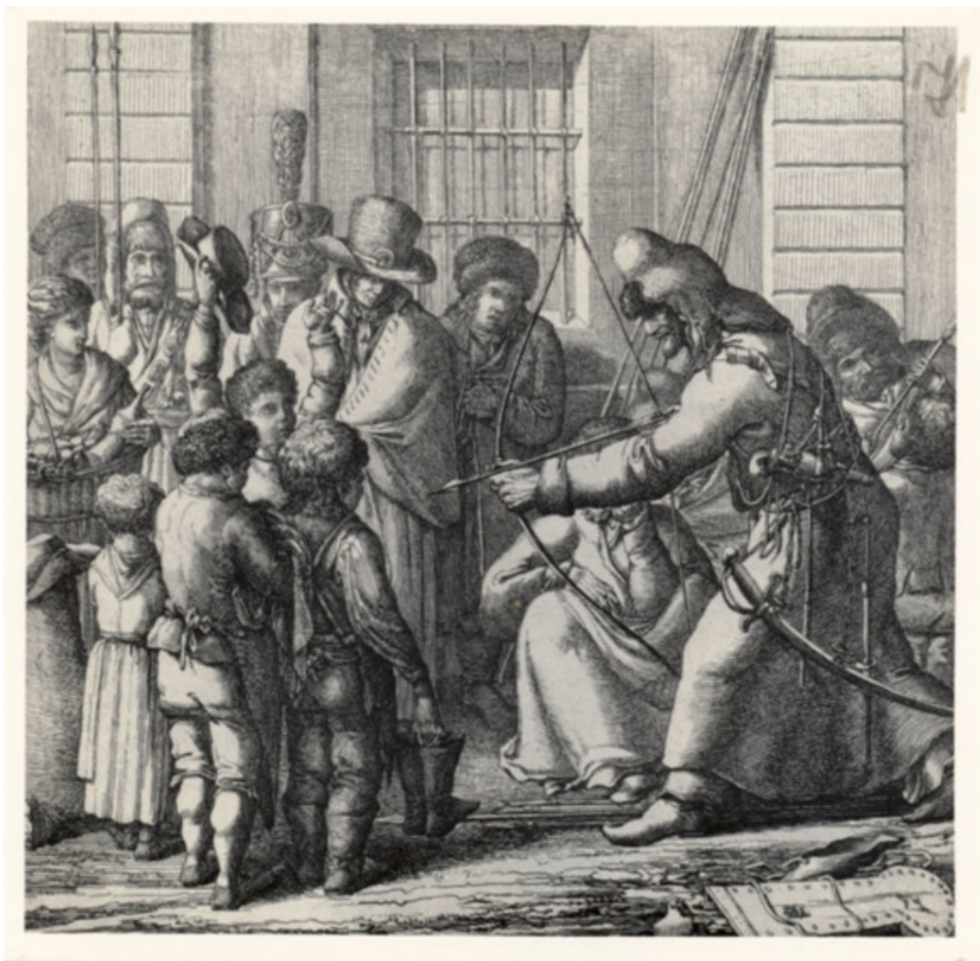
Башкиры в Берлине (Башкир. Унтер ден Линден. 11 марта 1813 г.). Худ. К. Л. Хюбейль. 1813 г.

Первый казачий захват столицы Пруссии имел важное военно – политическое значение. Именно успешные действия этих сил заставили короля Пруссии разорвать союз с Наполеоном и присоединиться к российским войскам. 16 (28) февраля 1813 г. под давлением собственного народа был заключен Калишский союзный договор Пруссии с Россией против наполеоновской Франции, положивший начало антифранцузской коалиции. Командующим всеми прусскими войсками назначили генерала Гебхарда Леберехта Блюхера. «Вчера я имел честь подписать трактат с Пруссией, писал Кутузов жене. – Это даёт нам тысяч сто войска... Без нынешней компании этого бы не было» 38 .