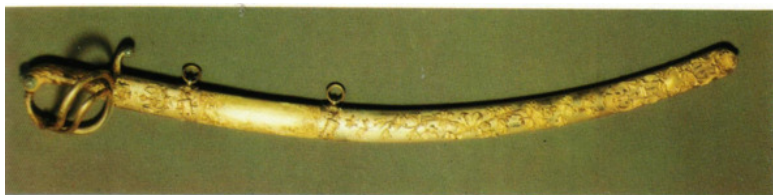
Сабля Чернышева А. И.

пехоты и артиллерии, не смогли удержать город, и вынуждены были организованно отступить, уведа с собой 18 офицеров и более 600 рядовых пленными. Убыль же собственных сил у них не превышала 150 человек убитыми и ранеными 29 .