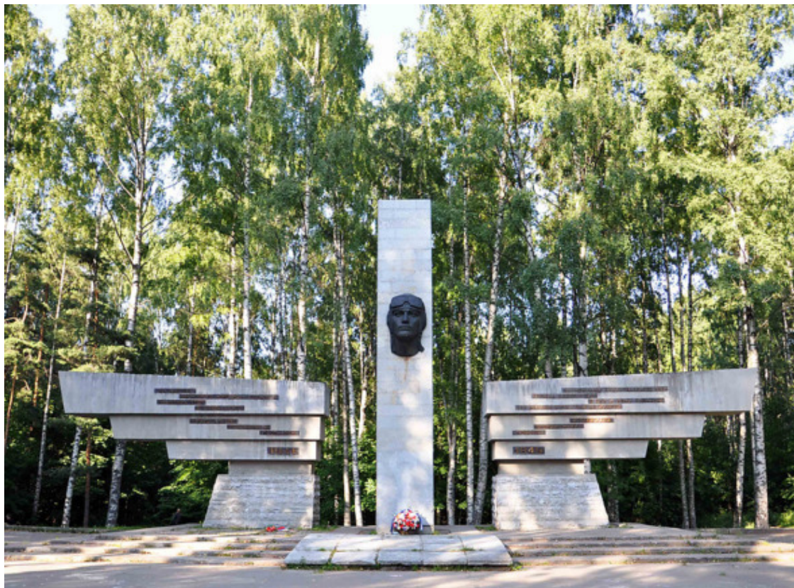
Памятник лётчикам в парке "Сосновка"

«Сосновка» – самый большой парк в Петербурге (302 га), самый молодой (основан в 1960 году), самый зелёный (сосновый бор, переходящий в его северо-восточной части в березняк) и самый посещаемый, поскольку кроме зелени, чистого воздуха, водоёмов с плавающими утками, болотцами, где произрастает клюква, морошка, а по берегам – черника, имеются в парке теннисные корты, волейбольные площадки, футбольное поле, площадки для игры в бадминтон и для занятий фитнесом. Да и выпить, закусить есть где. Не парк, а настоящая зелёная городская драгоценность. Ну и ну! получился целый рекламный блок.