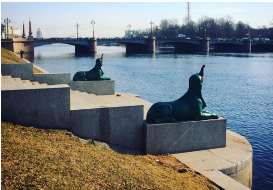
Сфинксы на набережной Малой Невки

У студентов академии сфинксы почитаемы. Считается, что они помогают при сдаче экзаменов.