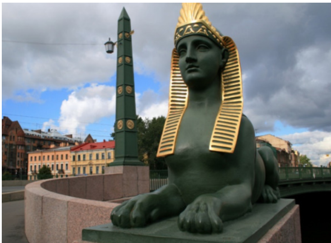
Один из сфинксов Египетского моста