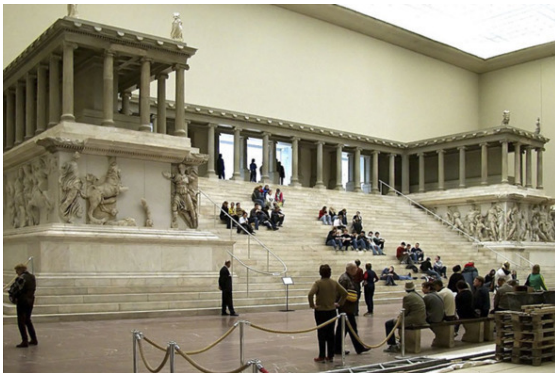
Пергамский алтарь. Берлин

В девяностых годах прошлого века в России победили демократы. Россия стала другой, демократической. Раз государство другое, то и герб, отражающий суть государства, должен быть другим, демократическим. Однако российский герб «рванул в графья». Он отказался от «подлых» серпа и молота и обзавёлся странными для демократической государственной эмблемы императорскими коронами и царскими скипетром и державой.