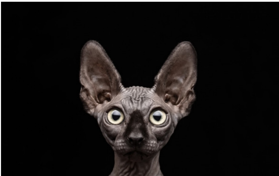
Тоже сфинкс, но только кошка