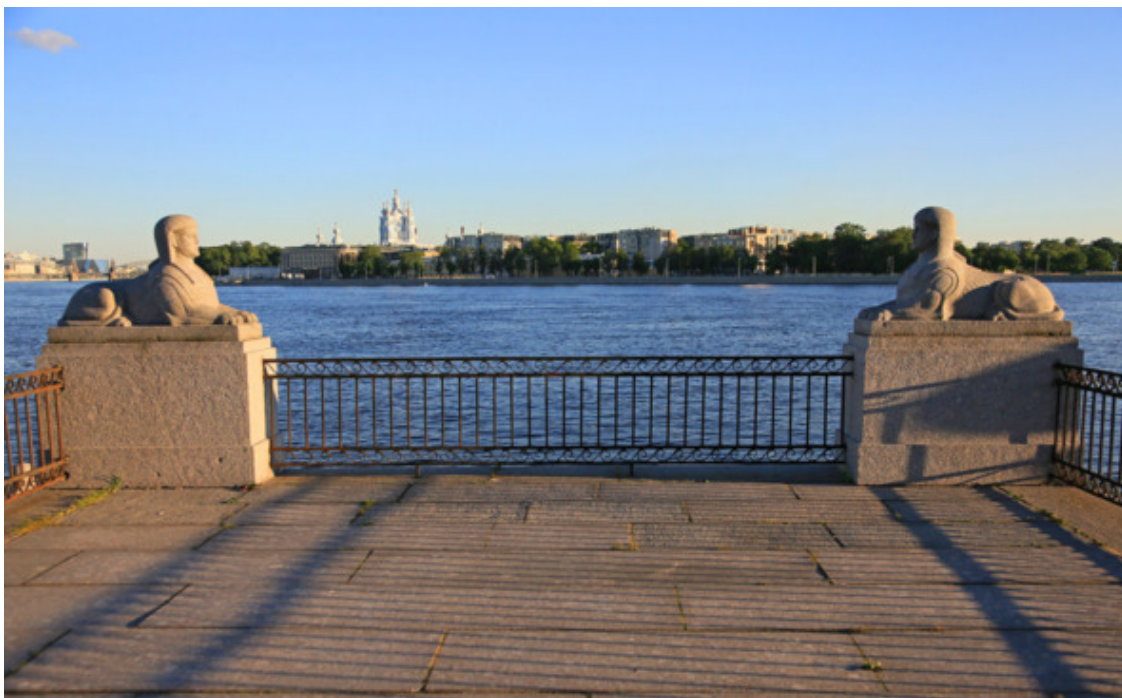
Свердловская набережная. Пара сфинксов на крыше грота. На заднем плане Смоленский собор

Целебность ключей в Полюстрове открыл лекарь Петра Первого. С 1839 года на базе этих родников стал функционировать курорт и осуществлялся розлив в бутылки минеральной воды. Здесь с 1930 года завод «Полюстрово» производит промышленный выпуск минеральной воды под маркой «Полюстровская» и «Охтинская».