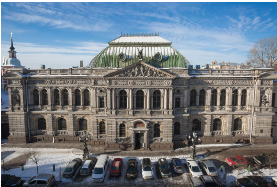
Музей прикладного искусства. Петербург