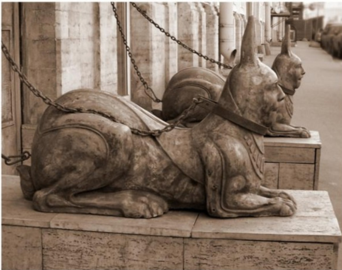
Сфинксы-мужчины на Фонтанке

Эти сфинксы многим не нравятся, но сносить их не стоит. Пусть стоят. Память.