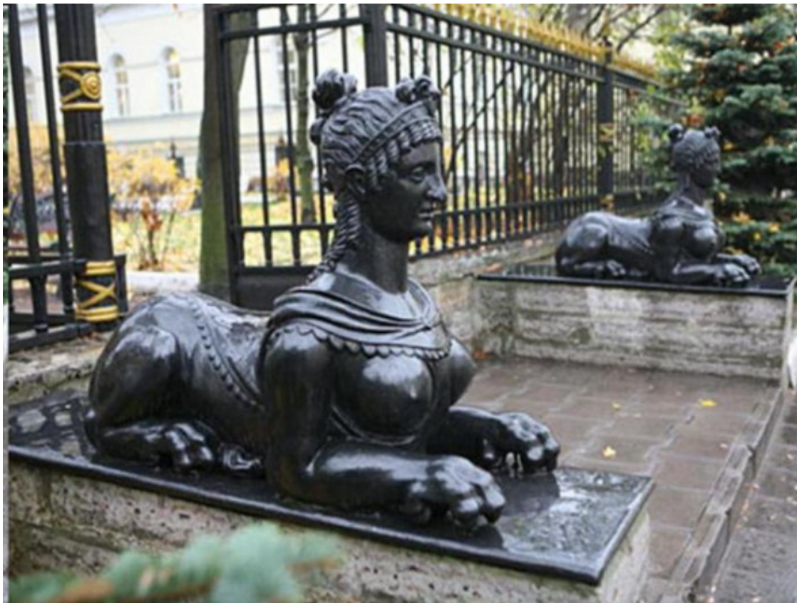
Сфинксы во дворе Горнгй академии

по сторонам пристани предполагалось установка конных статуй. Но изготовление скульптур оказалось очень дорогим. Тогда-то и вспомнили о сфинксах.