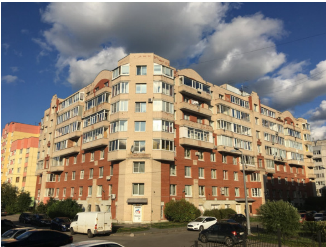
Сиреневый бульвар, дом 23

В компании цивилизованных стран Россия является позорным лидером по числу преднамеренных убийств на сто тысяч населения. А в России, одним из лидеров по этому параметру является Петербург (в смысле бандитский Петербург). А в Петербурге (Барсуков точно не знал, но предполагал) самым «мёртвым домом» можно было считать дом 16/18 по Сиреневому бульвару. Там за два не полных последних года были убиты четыре человека.