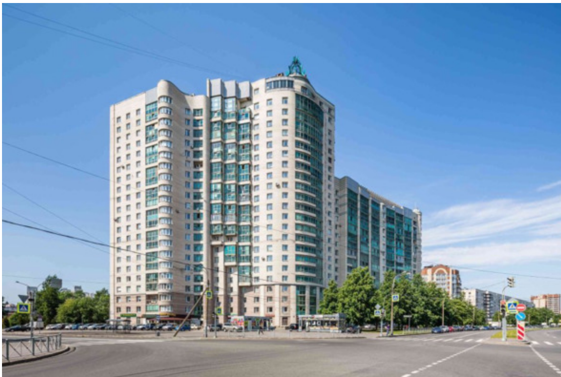
Проспект Художников, 10. Петербург

Людка, ярко раскрашенная в пёстрой шали на плечах, ошивалась возле подъезда капитального кирпичного дома, в котором она и жила. На шестнадцати этажах этого дома размещалось сто квартир. Характерно, что во многих квартирах жили не их хозяева, а разношерстная молодёжь: студенты, торговцы с юга, молодожёны и т.п. Хозяева же (в основном пенсионеры), сдав свои апартаменты в аренду, обретались на дачах, и в деревнях или у родственников.