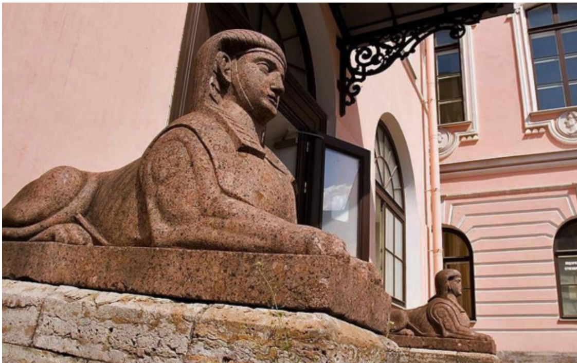
Сфинксы во дворе Строгановского дворца

(арх. А. Н. Воронихин), располагавшейся на правом берегу Большой Невки, возле места впадения в неё Чёрной речки.