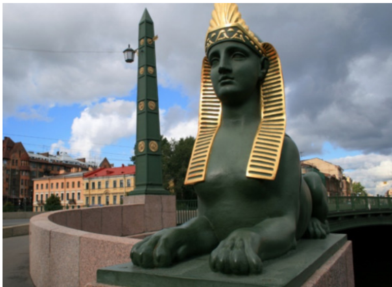
Один из сфинксов Египетского моста