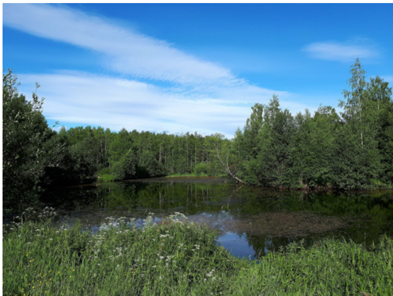
Пруд в Сосновке

— Вот скажи, Алексей, ты умеешь хранить тайны?