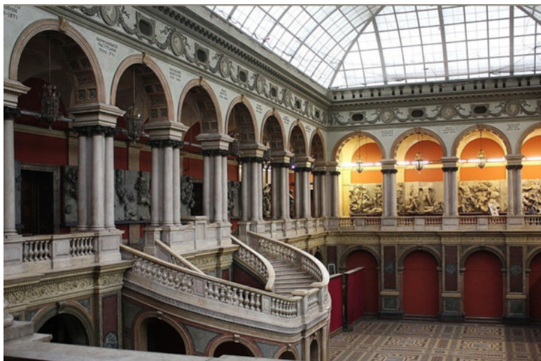
Центральный выставочный зал Музея прикладного искус-