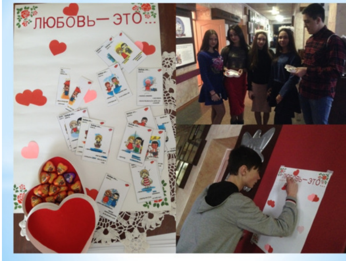
Иллюстрация 5. Фото проведения психологической акции ко Дню влюбленных