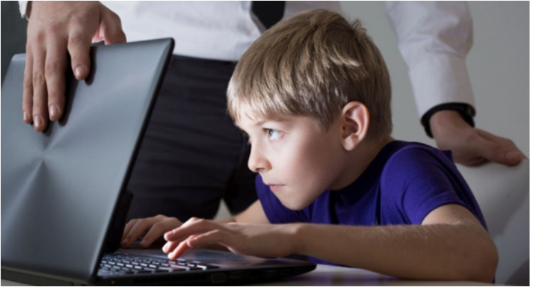
Иллюстрация 1 к статье «Как избавить ребенка от компьютерной зависимости?»

дители научают детей работать с их помощью, тогда гаджеты будут служить детям. Если же это не удастся, тогда дети будут служить гаджетам и гаджеты их поработят.