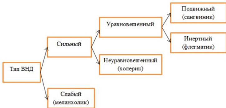
Рис. 1. Зависимость темперамента от особенностей нервной системы