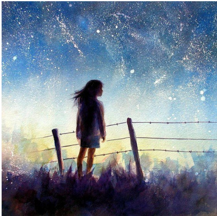
Иллюстрация 6 к статье о поиске предназначения