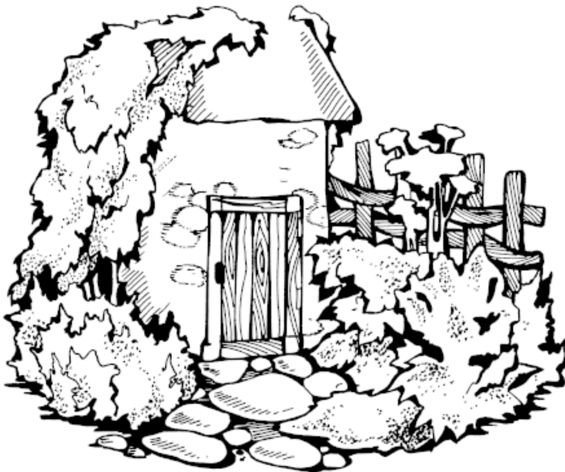
Рисунок 2. Цветник в сельском стиле

Декоративный огород – это огород с грядками строгой геометрической формы, на которых овощи и зелень чередуются с декоративными растениями (рис. 3). Как правило, грядки огорожены бордюрами. Из них может складываться какой-либо узор. Между грядками располагают ровные прямые дорожки, посыпанные гравием. Впервые декоративные огороды появились во Франции.