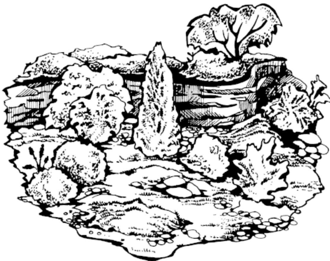
Рисунок 5. Группы растений