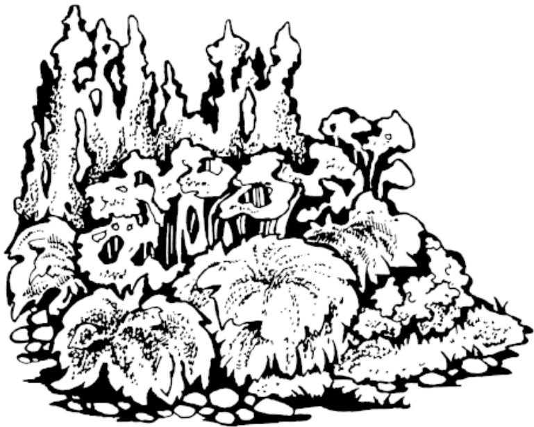
Рисунок 6. Расположение растений в цветнике по высоте

Если ограда территории граничит с опушкой леса или за ней открывается простор полей, а на прилегающей к дому территории сохранились деревья, например березы, то отлично будет смотреться цветник в сельском стиле.