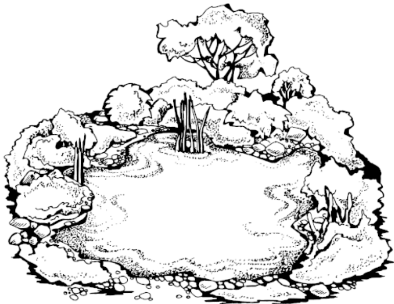
Рисунок 1. Прибрежная композиция

гах водоема расположить еще несколько растений, то получится прекрасный оазис (рис. 1). Рядом с таким цветником часто устанавливают скамейки и шезлонги. Это романтическое место для отдыха.