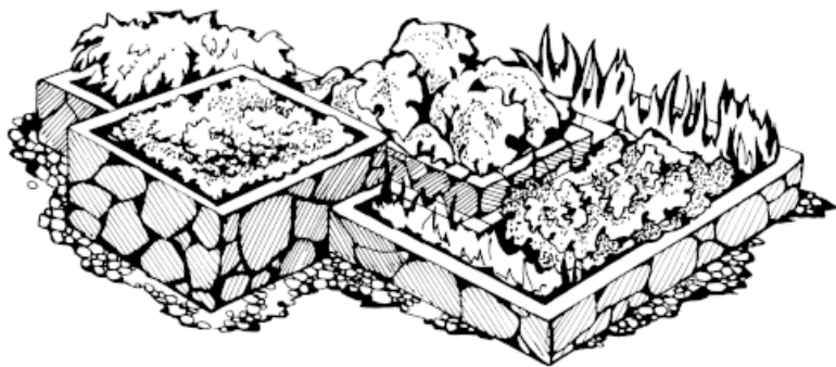
Рисунок 3. Декоративный огород

Рутарий – это новый вид ландшафтного дизайна, при создании которого используют не только цветы, но также корни деревьев и пни. Из них составляют оригинальные композиции, в которых элементы деревьев и цветы подчеркивают красоту друг друга.