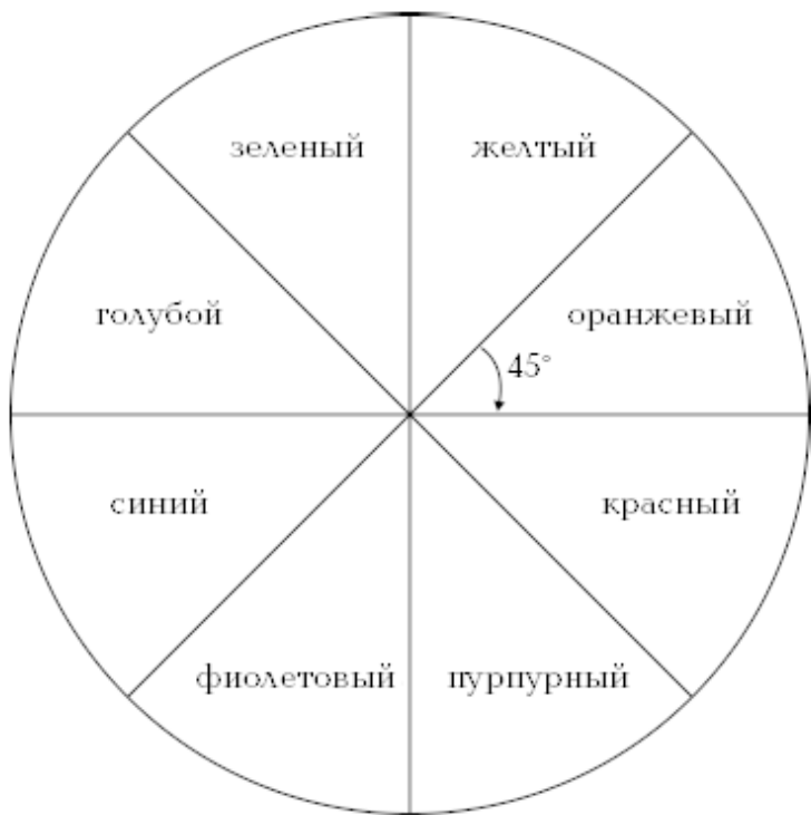
Рисунок 7. Цветовой круг

Существуют и другие цветовые системы, в которых цветовой круг делят на большее количество частей – оттенки основных цветов.