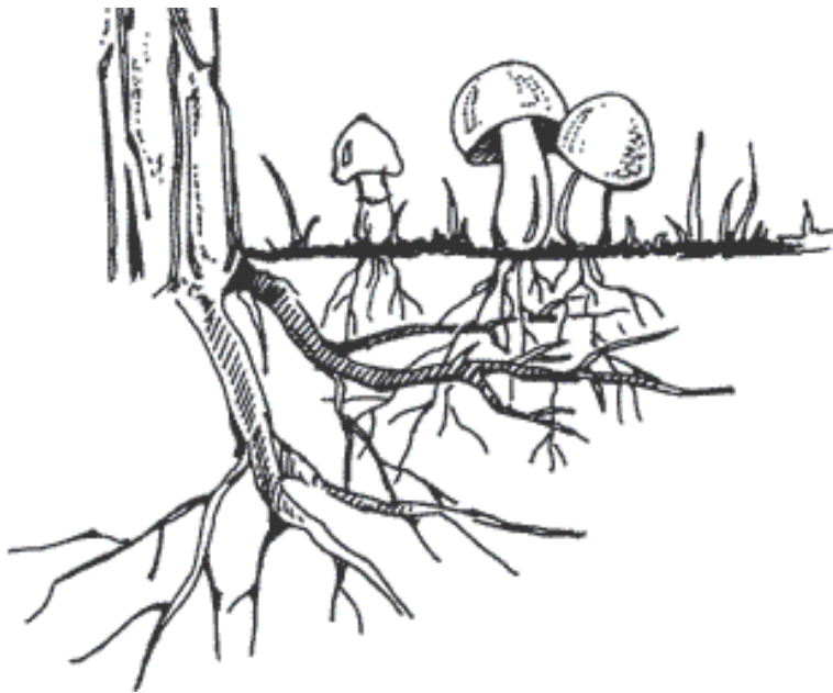
Рисунок 2. Схема связи грибницы с корнями дерева-хозяина