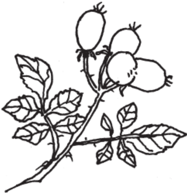
Рисунок 3. Плод розы

Цветок может быть от 1 до 16 см в диаметре, по величине цветки делятся на мелкие, средние и крупные.