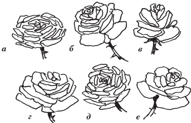
Рисунок 2 а – е. Форма цветков розы

Форма бутонов бывает яйцевидной, шаровидной, урнообразной, остроконечной или стройной.