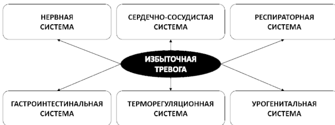
Рис. 5. Многогранность телесных проявлений тревоги