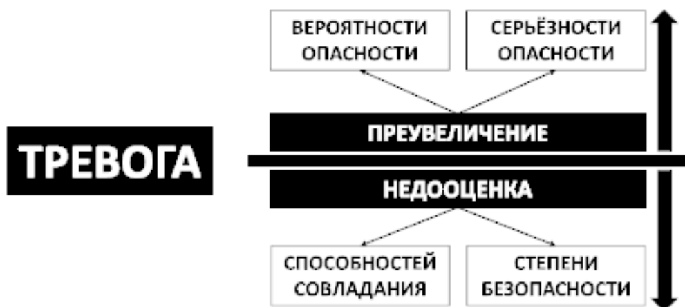
Рис. 3. Полная формула тревоги