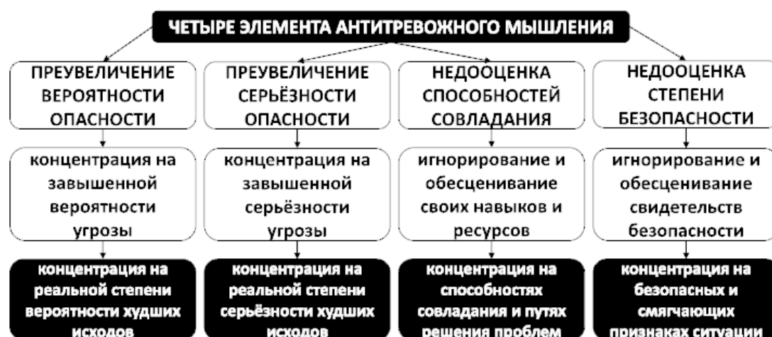
Рис. 4. Элементы антитревожного мышления