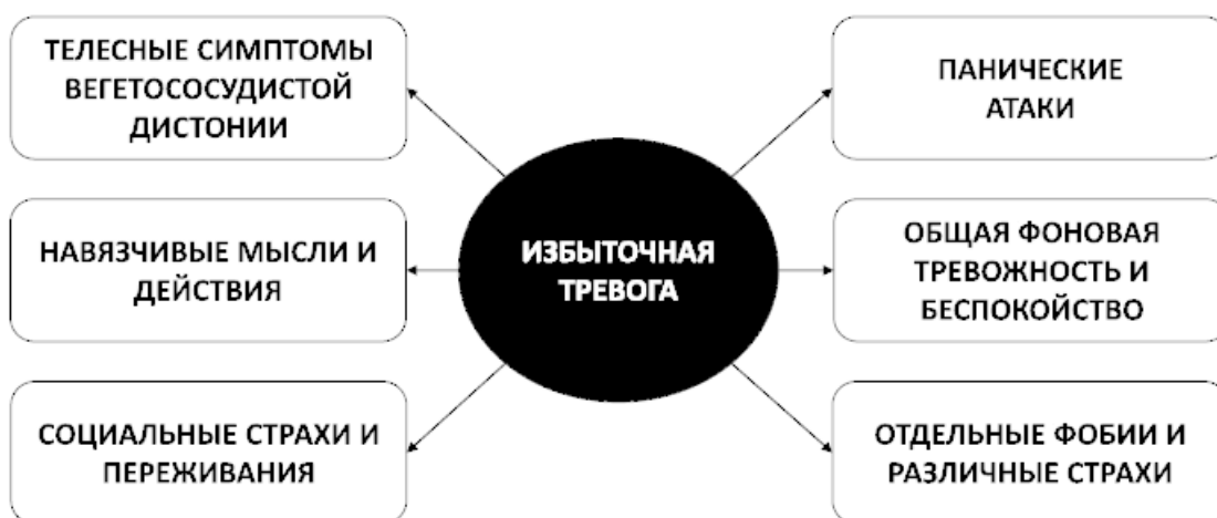
Рис. 6. Возможные следствия избыточной тревоги