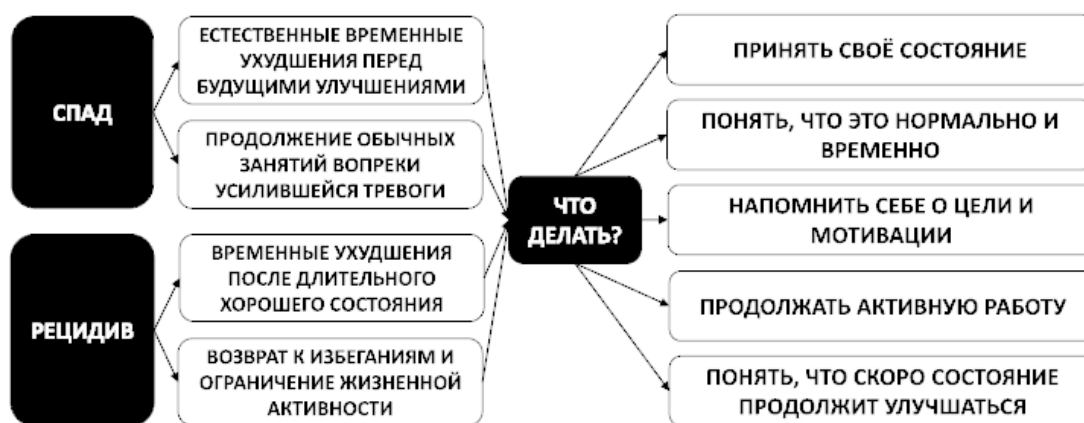
Рис. 1. Элементы тревожного мышления

Во время эпизодов тревоги человек избыточно концентрируется на мыслях об опасности и своей неспособности справиться с тревожащей ситуацией. Это приводит к невозможности увидеть менее угрожающие варианты развития событий, поскольку в такие моменты человеку довольно сложно мыслить рационально. Иными словами, человек начинает тревожиться, когда риски трактуются как высокие, а он не осознает, за счет чего и как можно с ними совладать (см. рис. 2).