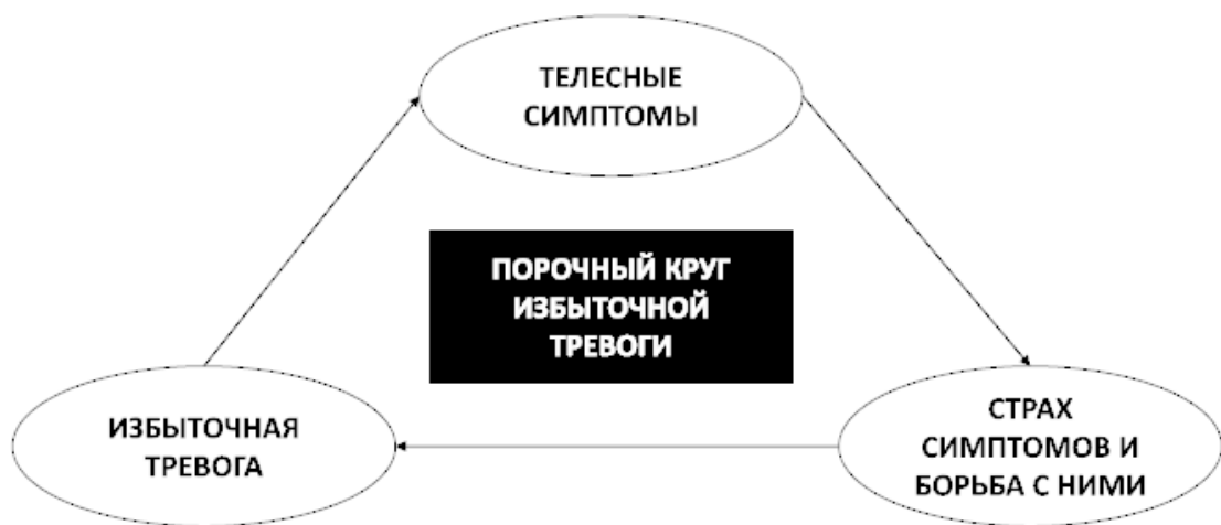
Рис. 7. Порочный круг избыточной тревоги

Однако в основе избыточной тревоги лежит длительный страх, сохраняющийся даже при отсутствии реальной угрозы. Стоит особо отметить, что борьба с вышеуказанными проявлениями тревоги бесполезна.