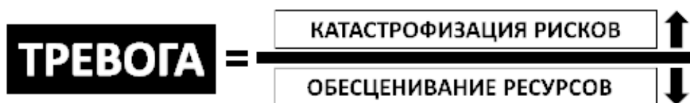
Рис. 2. Краткая формула тревоги

Более подробно формула тревоги выглядит следующим образом (см. рис. 3).